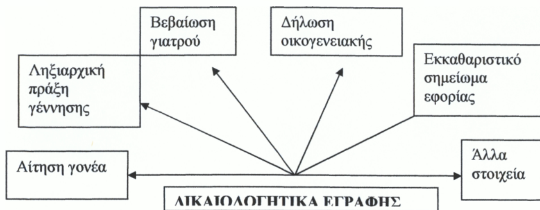
Σχήμα 1 ο : Δικαιολογητικά εγράφης