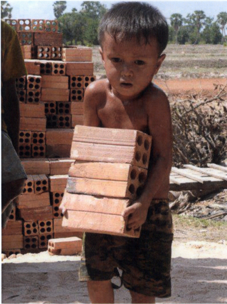
Μια εικόνα που, δυστυχώς, δεν ανήκει στο παρελθόν