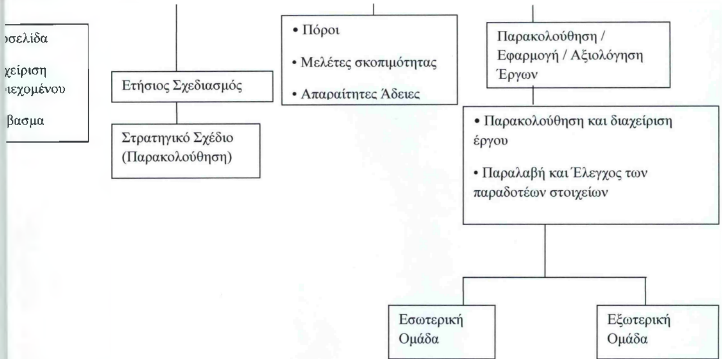
Σχήμα 1. Οργανόγραμμα Ινστιτούτου Οδικής Ασφάλειας «Πάνος Μυλωνάς»