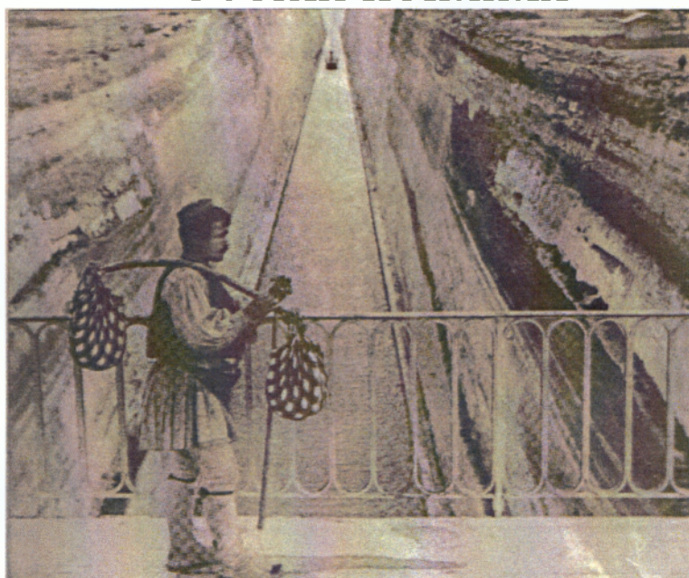
Εικ.1 Η «Αναχώρηση» (1906)