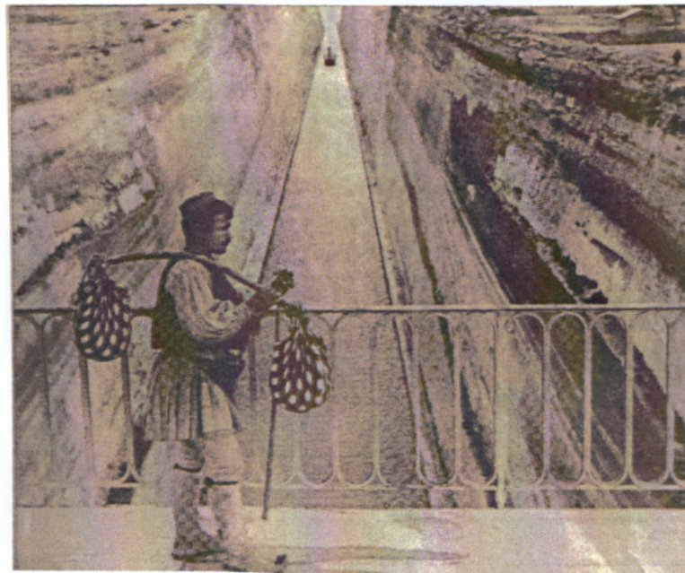
Εικ.1 Η «Αναχώρηση» (1906)