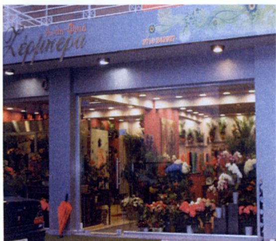
Εικ. 4.5 Ανθοπωλείο στην Τρίπολη

διανεμηθούν με δύο τρόπους στους καταναλωτές. Ο πρώτος τρόπος για να τα παραλάβουν οι ίδιοι οι καταναλωτές και να τα μεταφέρουν οι ίδιοι στα σημεία που επιθυμούν, ο οποίος μπορεί να είναι ο χώρος κατοικίας τους, ο χώρος εργασίας τους, είτε να τα προσφέρουν σε κάποιο αγαπητό τους πρόσωπο. Ο δεύτερος τρόπος είναι να αναλάβει το ίδιο το ανθοπωλείο τη διανομή των φρέσκων λουλουδιών στα σημεία που επιθυμεί ο καταναλωτής.