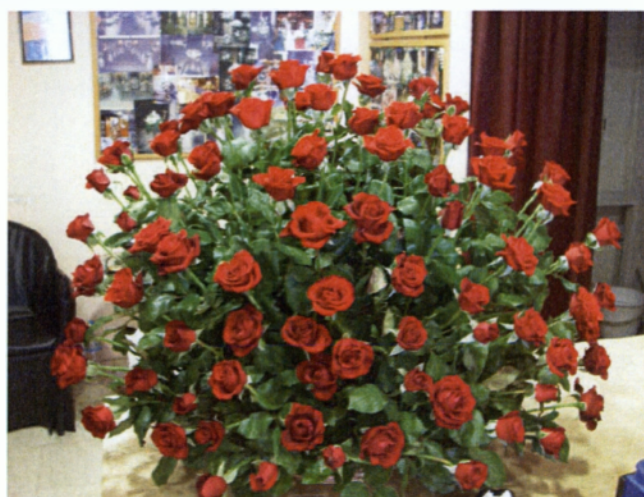
Εικ. 4.4 Καλάθι με τριαντάφυλλα.