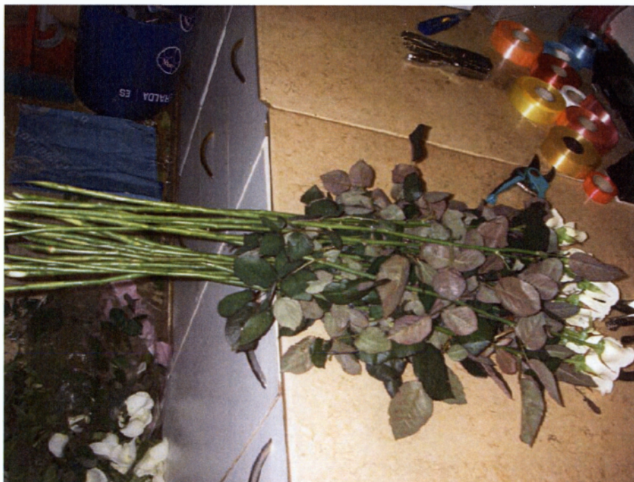
Εικ. 4.2 Τριαντάφυλλα μετά τον καθαρισμό τους.

Για τον καθαρισμό των φρέσκων λουλουδιών χρησιμοποιούνται διαφορετικές τεχνικές ανά είδους λουλουδιού. Τα τριαντάφυλλα πρέπει να καθαριστούν από τα αγκάθια και από τα φύλλα του κάτω μέρους των κοτσανιών τους, αυτό γίνεται με τη βοήθεια ενός ειδικού εργαλείου, το οποίο είναι μία λάμα σαν τσιμπίδα η οποία στην άκρη της έχει δύο ημικυκλικές τρύπες μέσα στις οποίες τοποθετείται το τριαντάφυλλο και όπως περνάει από τις τρύπες αφαιρούνται τα αγκάθια και τα περιττά φύλλα. Ύστερα κόβεται το κάτω μέρος του κλαδιού και καθαρίζεται το μπουμπούκι από τα πρώτα φύλλα τα οποία συνήθως είναι λερωμένα από τα λιπάσματα. Τα υπόλοιπα φρέσκα λουλούδια καθαρίζονται με το χέρι επειδή δεν έχουν αγκάθια όπως τα τριαντάφυλλα, σε αυτά αφαιρούνται τα φύλλα από το κάτω μέρος του κορμού τους επειδή δεν πρέπει όταν τα τοποθετούμε σε δοχεία με νερό τα φύλλα να είναι μέσα στο νερό γιατί το μολύνουν και μειώνεται η διάρκεια ζωής των φρέσκων λουλουδιών.