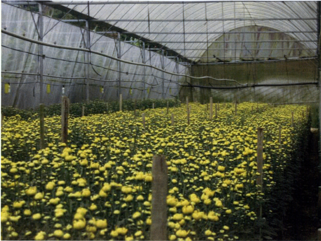
Εικ. 1.3 Καλλιέργεια χρυσάνθεμου