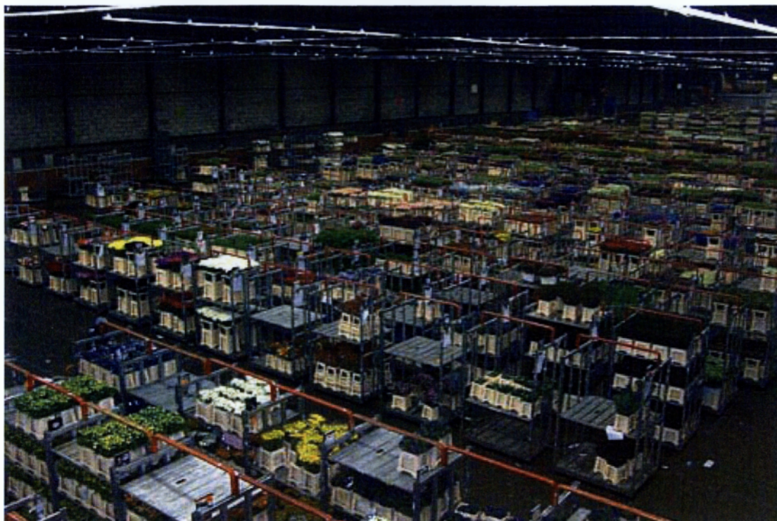
Εικ.1.1 Αποθήκες της αγοράς του Aalsmeer

ολλανδικού συμβουλίου χονδρεμπόρων ανθοκομικών προϊόντων είχε μεγάλη αύξηση αφού μόνο οι ολλανδικές εξαγωγές φρέσκων λουλουδιών ανήλθαν στα 4,8 δις. ευρώ.