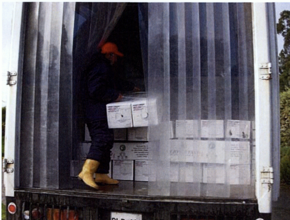
Εικ. 3.1 Φόρτωση χαρτοκιβωτίων σε φορητό ψυγείο

Η οδική μεταφορά προσφέρει το πλεονέκτημα της ευελιξίας των μέσων μεταφοράς που προσαρμόζονται ακόμη και σε μικρά φορτία και τα προϊόντα φτάνουν από πόρτα σε πόρτα με όλες τις ευκολίες που προσφέρει το φορητό αυτοκίνητο στη φόρτωση και ξεφόρτωση. Έχει όμως και μειονεκτήματα, όπως τις ζημιές που παθαίνουν τα προϊόντα όταν το οδικό δίκτυο δεν είναι και τόσο καλό ή την ταλαιπωρία που παθαίνει το προϊόν λόγω των δυσκολιών που παρουσιάζονται όταν επικρατούν κακές καιρικές συνθήκες με βροχερό καιρό, χιόνια κ.λπ. (Σφακιωτάκης, 2004)