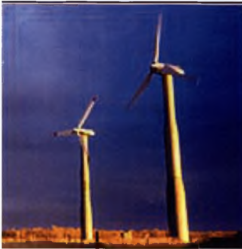
Εικ.3.6 Αιολικές μονάδες.