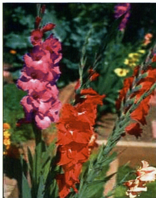
Εικ. 1.7 Γλαδίολος

Τα δρεπτά άνθη είναι περισσότερο ευπαθή στη μάρανση σε σχέση με τα φρούτα και τα λαχανικά και αυτό συνεπάγεται ότι χρειάζονται ιδιαίτερη προσοχή, ώστε να διαφυλαχθεί η ποιότητα του προϊόντος μετά τη συγκομιδή. Οι μετασυλλεκτικοί χειρισμοί περιλαμβάνουν σειρά από διεργασίες, οι οποίες εξασφαλίζουν την ποιότητα και τη διατηρησιμότητά τους. Αυτοί είναι :