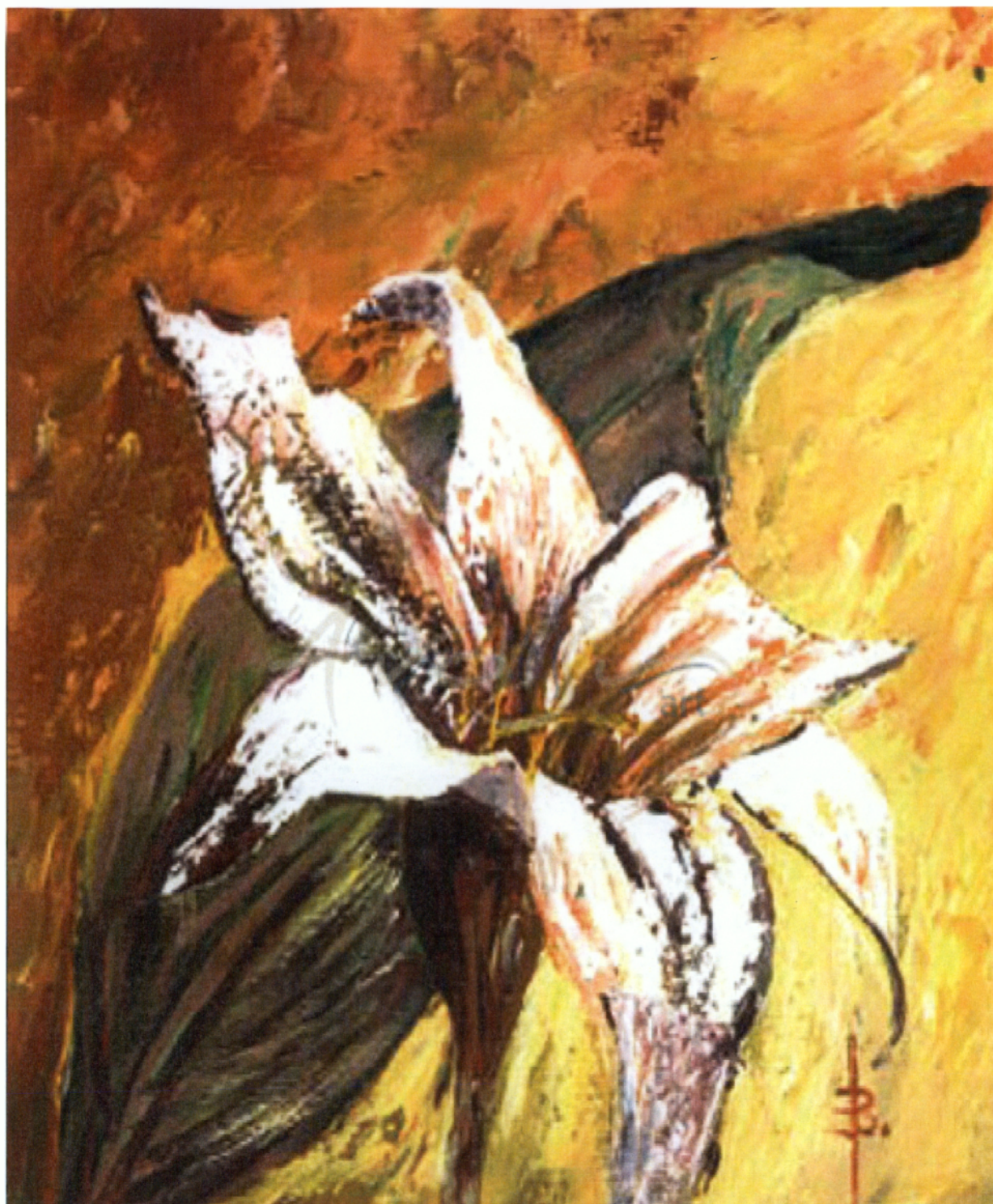
Ελαιογραφία σε καμβά