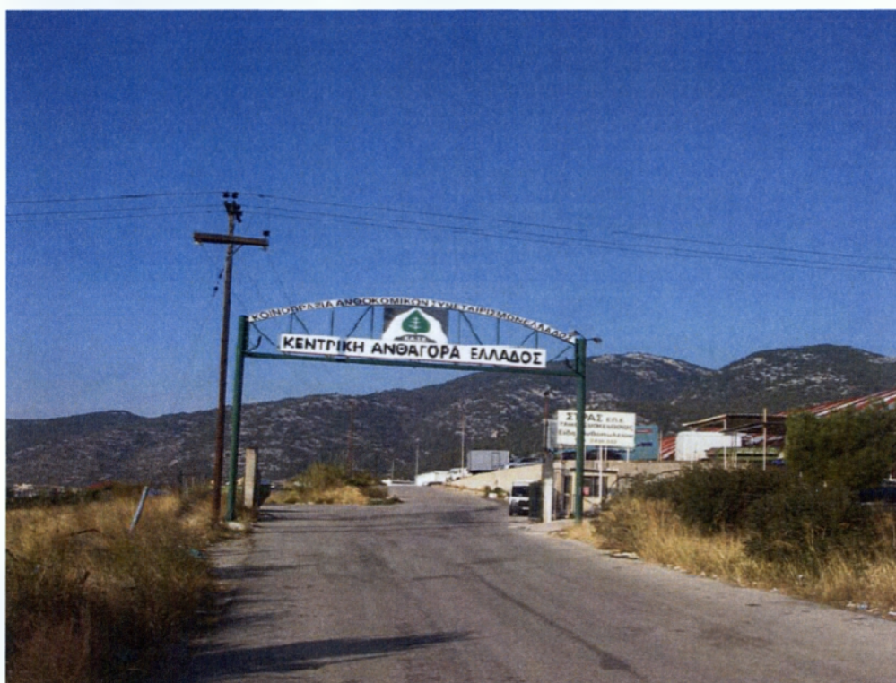
Εικ 3.5 Είσοδος κεντρικής ανθαγοράς Ελλάδος στην Αμυδαλέζα

τους διαθέτει η αγορά με ενοίκιο. Το 70% της αγοράς καταλαμβάνεται από παραγωγούς, ενώ το 30% από εμπόρους- εισαγωγείς φρέσκων λουλουδιών, επιπλέον στην αγορά δραστηριοποιούνται και οι λεγόμενοι αντιπρόσωποι οι οποίοι διακινούν φρέσκα λουλούδια για λογαριασμό παραγωγών οι οποίοι λόγω απόστασης και εργασιών δεν μπορούν να παραβρίσκονται οι ίδιοι για την πώληση των λουλουδιών.( ΥΠΑΑΤ).