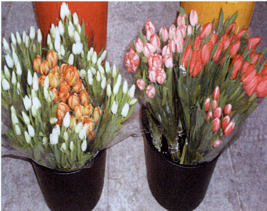
Εικ. 1.13 Τουλίπες σε νάιλον μέσα σε νερό