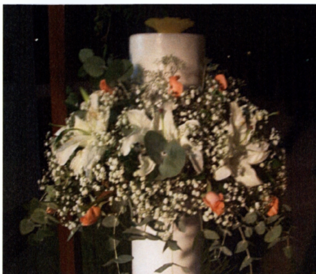
Εικ 4.3 Σύνθεση λουλουδιών για γάμο.

Εκτός από τον καθαρισμό των φρέσκων λουλουδιών, γίνονται αρκετές ακόμα εργασίες που σκοπό έχουν την ευκολότερη πώληση των λουλουδιών στους καταναλωτές. Αυτές οι εργασίες δεν είναι άλλες παρά αυτές που γίνονται για την ομαδοποίηση των λουλουδιών σε ανθοδέσμες,(μπουκέτα) και συνθέσεις σε καλάθια για διάφορες περιπτώσεις όπως π.χ στολισμός ενός γάμου, ενός αρραβώνα και διάφορα καλάθια με άνθη για άλλες περιπτώσεις εορτασμού.