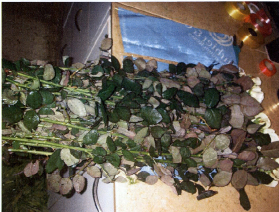
Εικ. 4.1 Τριαντάφυλλα πριν τον καθαρισμό τους

Ο ανθοπώλης είναι ο κρίκος της αλυσίδας που αναλαμβάνει την επεξεργασία των φρέσκων λουλουδιών, που απαιτούνται ώστε να μπορέσουν τα λουλούδια να έρθουν σε μια τέτοια κατάσταση, (απαλλαγμένα από περιττά στοιχεία), για να είναι εκτός από εύκολα στη χρήση από τους καταναλωτές αλλά και πιο όμορφα με σκοπό να πουληθούν πιο γρήγορα.