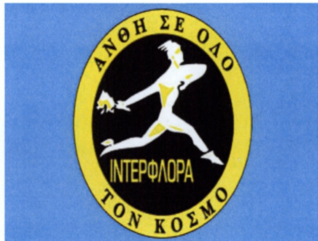
Εικ. 4.7 Τα σήματα των δύο εταιριών το περιστέρι και ο Ερμής.