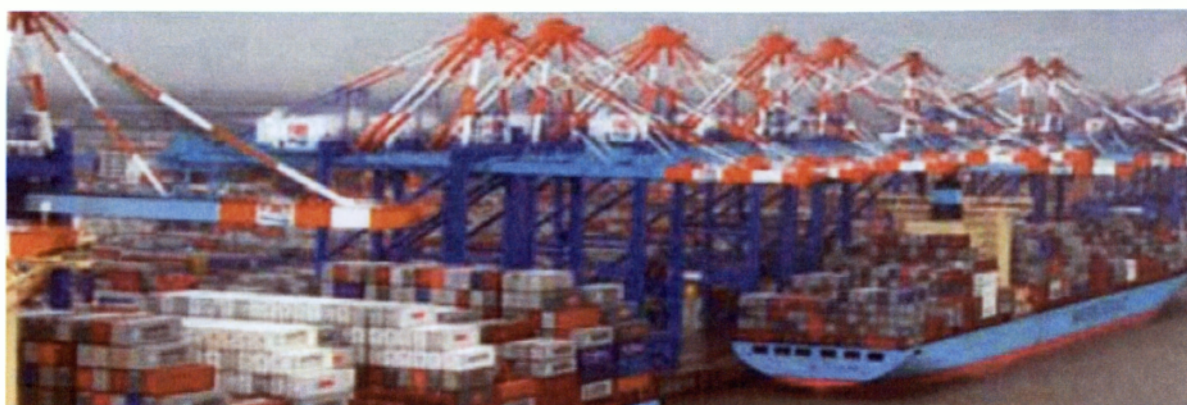
Εικ. 3.2 Φορτηγά πλοία με κοντέινερ

Οι θαλάσσιες μεταφορές περιλαμβάνουν τις μεταφορές με πλοία ψυγεία, με ειδικά πλοία για εμποροκιβώτια (containers) και τις μεταφορές με οχηματαγωγά. Συνήθως οι μεταφορές αυτές, συμπληρώνουν τις οδικές κυρίως μεταξύ νησιών με την ηπειρωτική χώρα, Κρήτη – Πειραιάς. Τις διαδρομές αυτές ακολουθούν κατ' ανάγκη τα φορτηγά αυτοκίνητα που μεταφέρουν άνθη από την Κρήτη προς στις μεγάλες αγορές της Αθήνας και της Θεσσαλονίκης, από τις αγορές αυτές τα άνθη φτάνουν στον προορισμό τους με μικρότερα ιδιόκτητα ημιφορτηγά. (Σφακιωτακης, 2004)