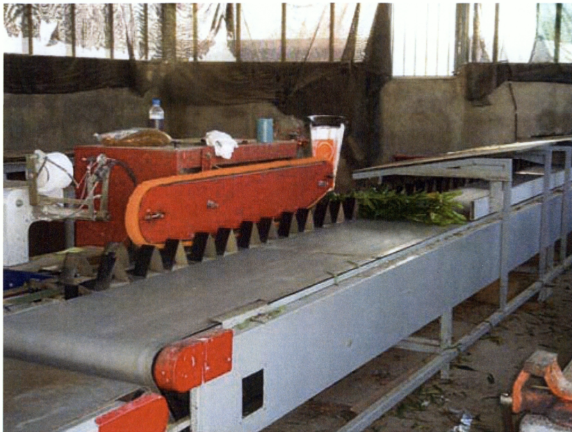
Εικ. 1.9 Μηχάνη καθαρισμού Φρέσκων Ανθέων

Η συσκευασία των δρεπτών ανθέων θα πρέπει να είναι τέτοια ώστε να τους εξασφαλίζει την κατάλληλη προστασία, να αποφεύγονται οι μώλωπες, οι φθορές και η απώλεια υδρατμών από τα άνθη, αλλά και να διευκολύνει την διακίνηση, να εξασφαλίζει οικονομία χώρου και να διατηρεί τα άνθη άθικτα. Επίσης, σημαντικό ρόλο παίζουν και τα υλικά συσκευασίας που θα χρησιμοποιηθούν και που θα έρθουν σε άμεση επαφή με τα δρεπτά άνθη, όπως είναι το χαρτί, το σελοφάν κλπ. (Σφακιωτάκης,2004)