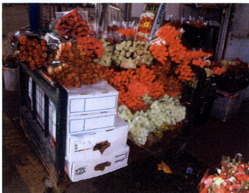
Εικ. 1.10 Τριαντάφυλλα σε δέσμες

εξωτικά λουλούδια επίσης, επειδή συνήθως η τιμή τους είναι υψηλή, συνήθως προσφέρεται μια αυξημένη προστασία κατά τη μεταφορά και τη συσκευασία τους. Στα γαρίφαλα γίνεται ξηρή αποθήκευση και τα άνθη τοποθετούνται σε δεσμίδες 10 ανθοφόρων βλαστών σε χαρτοκιβώτιο, τυλιγμένα με φύλλα χαρτιού.(Σάββας, 2003)