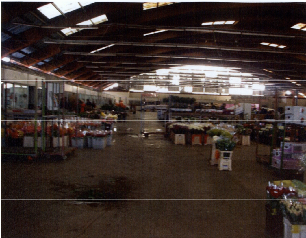
Εικ 3.4 Εσωτερικό κεντρικής αγοράς Αμυδαλέζας

Τα εισαγόμενα φρέσκα λουλούδια μεταφέρονται από την Ολλανδία συνήθως με φορτηγά- ψυγεία, τα οποία καταφθάνουν στις αγορές κάθε Δευτέρα τα ξημερώματα και πρόκειται για φρέσκα λουλούδια τα οποία έχουν αγορασθεί στην ολλανδική αγορά την Παρασκευή το μεσημέρι. Λόγω της μεγάλης αύξησης των μεταφορικών, οι μεταφορές φρέσκων λουλουδιών με αεροπλάνο προς την αγορά της Ελλάδος είναι αισθητά μειωμένες σε σχέση με άλλα χρόνια αλλά και πολύ μικρότερες σε μέγεθος φορτίου σε σχέση με τα προϊόντα τα οποία μεταφέρονται από την Ολλανδία με φορτηγά αυτοκίνητα.