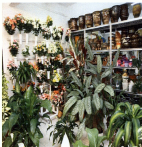
Εικ. 4.6 Ανθοπωλείο στο Ρέθυμνο

Η διανομή των λουλουδιών από τα καταστήματα λιανικής πώλησης γίνεται με δύο τρόπους, είτε με ίδια μέσα του καταστηματάρχη, τα οποία μπορούν να είναι: μηχανάκια, μικρά φορτηγά αυτοκίνητα, μέσα μαζικής μεταφοράς (αν ο διανομέας είναι μικρός σε ηλικία) και σε μικρές αποστάσεις με τα πόδια. Ο δεύτερος και πιο διαδεδομένος τρόπος ειδικά στις μεγάλες πόλεις Αθήνα, Θεσσαλονίκη είναι η χρήση ειδικής μεταφορικής εταιρίας, η οποία χρησιμοποιεί ίδια μέσα διανομής μικρών δεμάτων. Τα καταστήματα λιανικής πώλησης για να μπορούν να χρησιμοποιήσουν τις εταιρείες διανομής, πληρώνουν μια μηνιαία συνδρομή η οποία ανέρχεται στα 30 €, επιπλέον για κάθε διανομή που πραγματοποιούν πληρώνουν ένα ποσό ανάλογα με την απόσταση την οποία έχει το ανθοπωλείο με το σημείο αποστολής των λουλουδιών, το ποσό ξεκινάει από τα 4 € και μπορεί να φτάσει μέχρι τα 25 με 30 €, αυτό το ποσό επιβαρύνει τον πελάτη και δεν αποτελεί κόστος για το ανθοπωλείο. 25