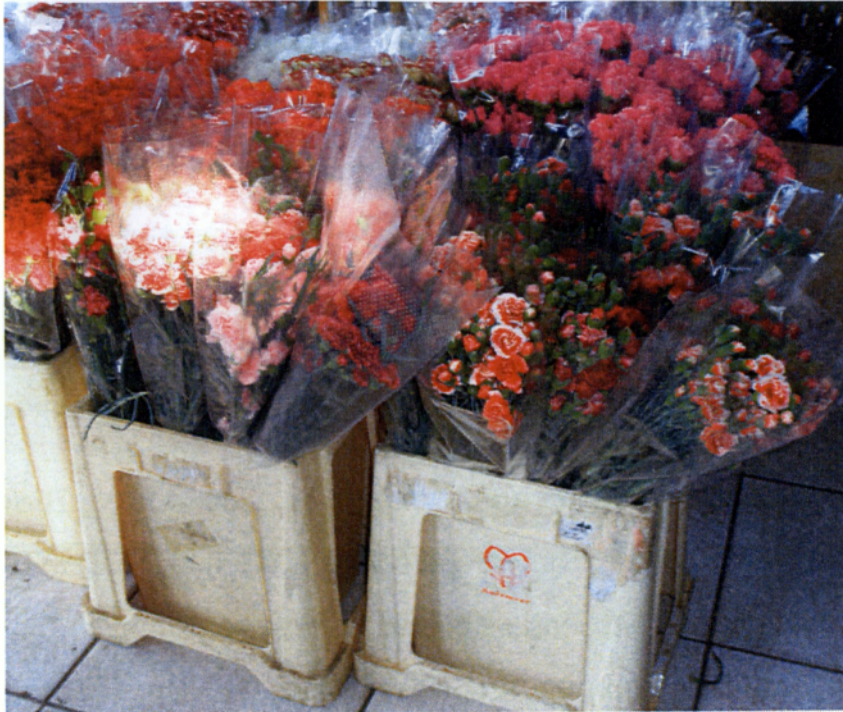
Εικ. 1.12 Γαρίφαλα υγρή αποθήκευση με νάιλον