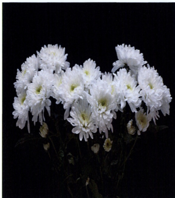
Εικ. 1.6 Λευκό χρυσάνθεμο

Κατά την διαδικασία συγκομιδής το άνθος πρέπει να κόβεται όσο το δυνατόν πιο ομοιόμορφα, σε σωστή χρονική στιγμή (που αυτό για το κάθε είδος διαφέρει) ενώ σε αυτή τη διαδικασία θα πρέπει να υπολογίζεται και ο χρόνος ο οποίος απαιτείται για να φτάσει το λουλούδι στο τελικό σημείο πώλησης, καθώς είναι ζωντανό υλικό και συνεχίζει να ωριμάζει μετά την κοπή του. Η διαδικασία αυτή ξεκινάει καθημερινά το πρωί και ολοκληρώνεται μόλις κοπεί και το τελευταίο άνθος που μπορεί να προωθηθεί στην αγορά.