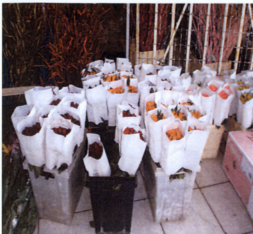
Εικ. .1.11 Τριαντάφυλλα σε χαρτί