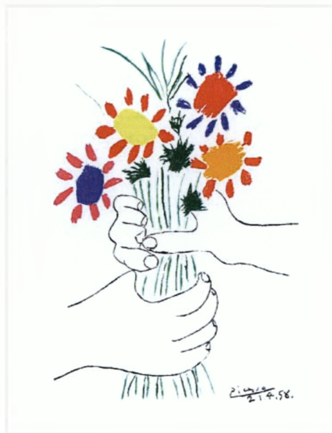
Εικ. 2.1 Χέρια με Λουλούδια (1958) – Πάμπλο Πικάσο

Άκερ ή Σφένδαμος, Αρούντο ροζ πανασε, Ασπάραγος, Αουκούμπα, Δίσκο ή Γκύ, Ευώνυμο, Γλεξ ή Ού, Ιριδα, Κρανία, Κόσμος, Κωνοφόρα διάφορα ( Πεύκο, Πικαία. Τάξος, Τούγια, Έλατο κ.α.), Κισσός, Λεπτοκαρύα, Μαώνια, Μυρτιά, Παρθενοκισσός ή Αμπέλοψις, Προύνος, Πυξάρι, Ρούσκος τάμαριξ ή Αλμυρίκι. Φτέρες διάφορες (Χριστόπουλος Ν.Ι.)