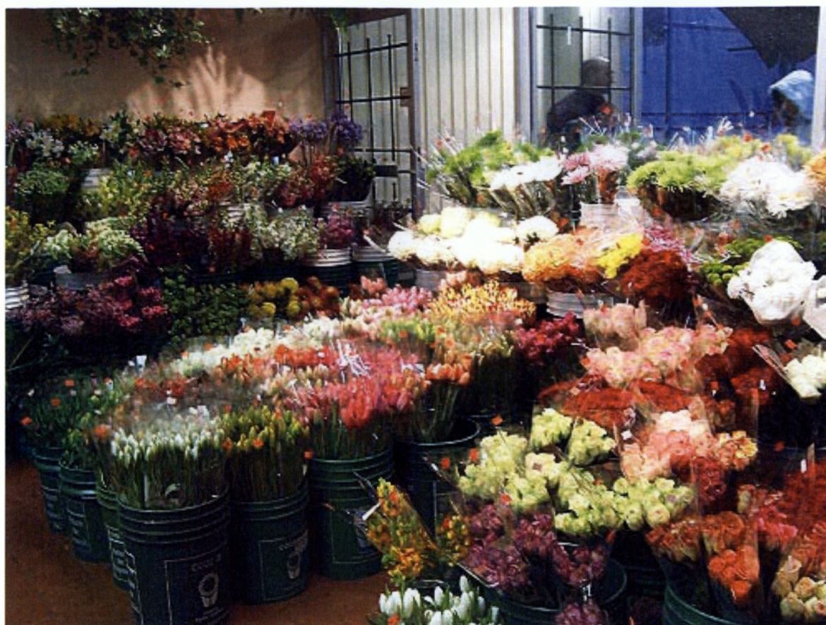
Εικ.1.2 Αποθηκευμένα φρέσκα λουλούδια σε δοχεία με νερό

Τα φυτά που καλλιεργούν και εμπορεύονται οι ανθοκόμοι είναι από τα μικρά μονοετή ή πολυετή όπως είναι οι κρίνοι, οι νάρκισσοι, οι ντάλιες, τα κυκλάμινα, οι τουλίπες, τα γαρίφαλα, οι βιολέτες, τα χρυσάνθεμα, οι ανεμώνες και φυσικά τα τριαντάφυλλα.