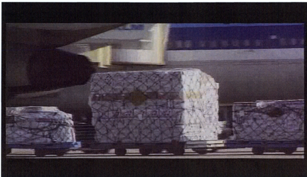
Εικ. 3.3 Μεταφορά φρέσκων λουλουδιών με αεροπλάνο