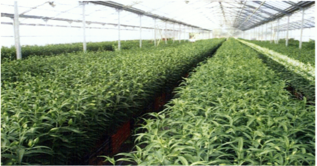
Εικ. 1.5 Θερμοκήπιο με καλλιέργεια Λύιουμ