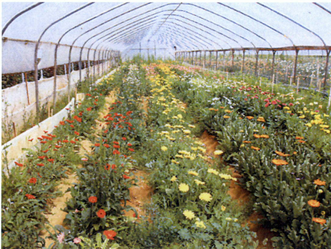
Εικ.1.4 Καλλιέργεια ζερμπερας