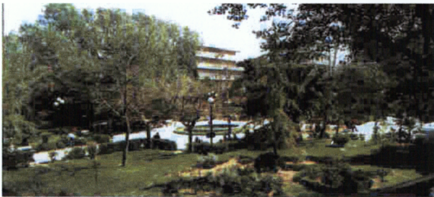
Η Κεντρική πλατεία του Ηρακλείου το 2002