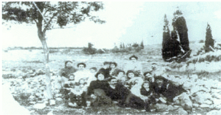
Το Ηράκλειο όπως ήταν το 1904