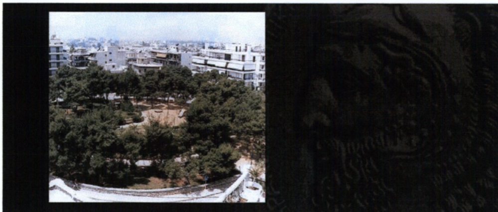
Μια γενική άποψη του Ηρακλείου σήμερα