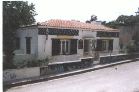
4 ος Παιδικός Σταθμός