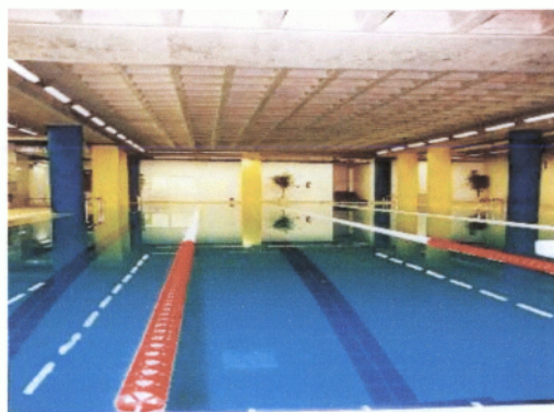
Δύο κλειστά κολυμβητήρια. Πισίνα Ολυμπιακών προδιαγραφών