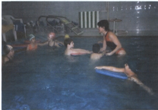
Συμμετοχή σε μαθήματα κολύμβησης