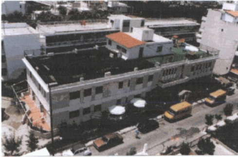
1 ος Παιδικός Σταθμός (Βρεφονηπιακό Κέντρο )