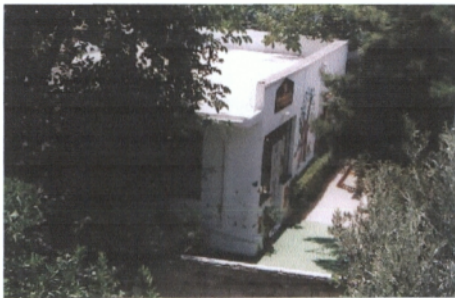
3 ος Παιδικός Σταθμός