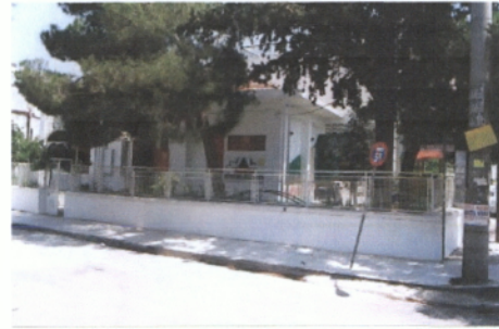
Παιδικός Σταθμός στην Πλατεία Μανδηλαρά