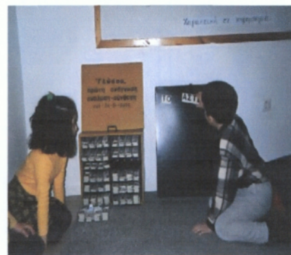
Μύηση στις συμβολικές έννοιες και στη σχολική γνώση μέσα από οργανωμένες παιχνιδιές δραστηριότητες με δομημένο υλικό.