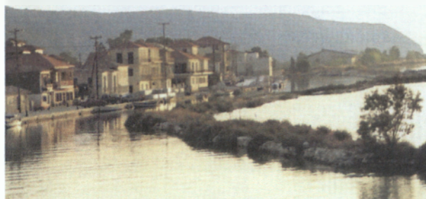
Η πόλη της Λευκάδας

Επτανήσων κι έχει πληθυσμό 23.000 κατοίκους. Το νησί της Λευκάδας μαζί με τα γύρω νησιάκια, Μεγανήσι, Κάλαμο, Καστό, Σκορπιό , Σκορπίδι, Μαδουρή , Σπάρτη, Θηλειά και Κυθρό , αποτελούν διοικητικά τον Νομό Λευκάδας.