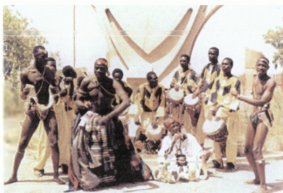
Συγκρότημα από τη Σενεγάλη

αισθάνονταν να γίνεται πραγματικότητα η συναδέλφωση των λαών, που ήταν ένας από τους σημαντικότερους σκοπούς του Φεστιβάλ. Το Φεστιβάλ άρχιζε με την παρέλαση κατά μήκος της κεντρικής οδού της πόλης - αγοράς, όλων των συγκροτημάτων. Δεξιά και αριστερά, πλήθος κόσμου παρακολουθούσε και χειροκροτούσε. Η παρέλαση κατέληγε στην πλατεία της Παραλίας, όπου όλα τα συγκροτήματα κάνοντας έναν τεράστιο κύκλο, έστηναν «μέγα χορό», τον χορό της Ειρήνης και της Συναδέλφωσης των λαών. Ο χορός αυτός φανέρωνε και το πνεύμα των εμπνευστών ενός τέτοιου θεσμού. Βέβαια, τα μέσα που διέθεταν τότε οι διοργανωτές ήταν από πενιχρά έως ανύπαρκτα. Σημειώνουμε πως το πλαίσιο του Φεστιβάλ δεν άφηνε απ' έξω ούτε τα μικρότερα χωριά του νησιού.