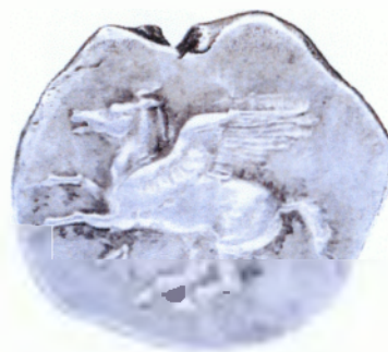
Έμβλημα Πνευματικού Κέντρου

Με το άρθρο 175 του Π.Δ. 76/1985 ορίζεται η επωνυμία "Πνευματικό Κέντρο Δήμου Λευκάδας" με έδρα την πόλη της Λευκάδας. Η νομική του μορφή είναι Δημοτικό Νομικό Πρόσωπο