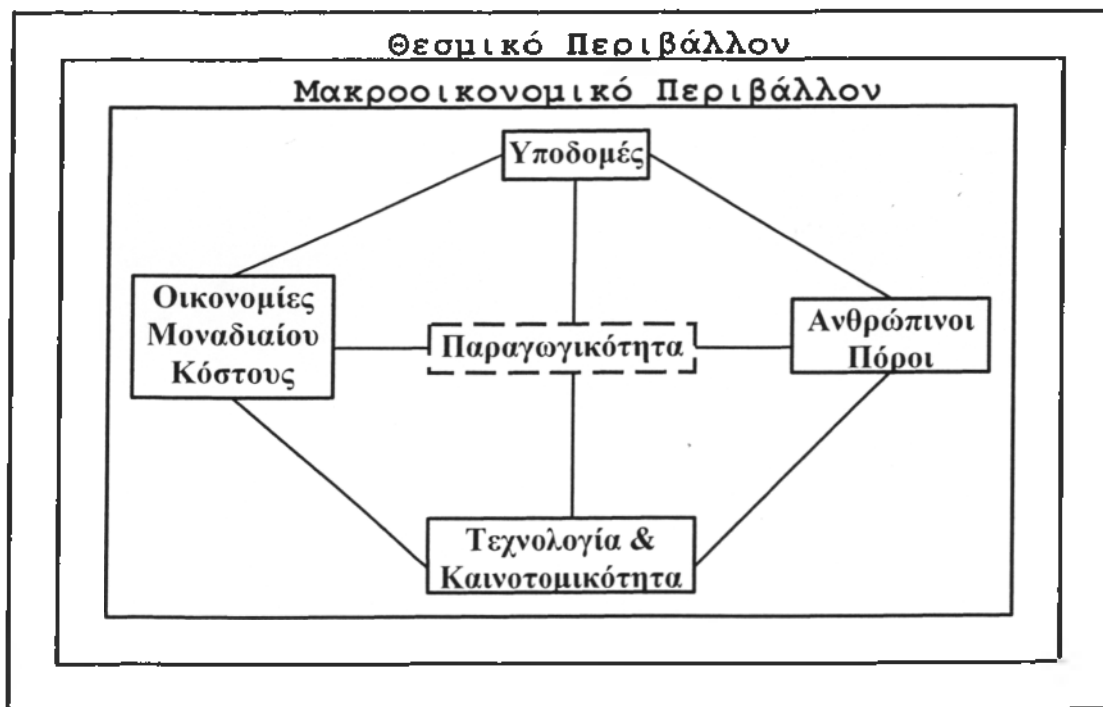
Διάγραμμα 1: Ο τροχός της παραγωγικότητας

Οι ανθρώπινοι πόροι καταρχάς, περιλαμβάνουν όλα τα άτομα που εμπλέκονται στην παραγωγική διαδικασία: τους εργαζόμενους, τους επιχειρηματίες και το διοικητικό προσωπικό, κυρίως τους managers. Η ποσότητα (ώρες, ένταση) της εργασίας είναι σημαντική, αλλά πιο σημαντική