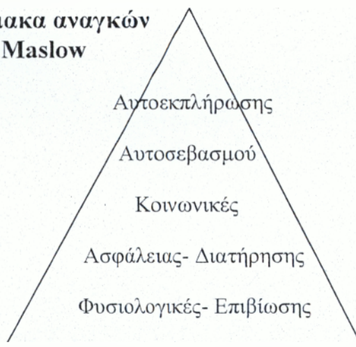
Σχήμα 1: Κλίμακα αναγκών Του Maslow

Με τη μαζική παραγωγή αγαθών και την οικονομική ευμάρεια που επιτεύχθηκε ύστερα από τη βιομηχανική επανάσταση, οι ανάγκες των τριών πρώτων βαθμίδων της πυραμίδας, η ικανοποίηση των οποίων απαιτούσε την κατανάλωση υλικών κυρίως αγαθών, σε πολύ μεγάλο βαθμό καλύφθηκαν. Στις μέρες μας ο άνθρωπος επικεντρώνει τις προσπάθειές του στην ικανοποίηση των αναγκών των δύο ανώτερων βαθμίδων καταναλώνοντας κατά κύριο λόγο υπηρεσίες. Σε όλο τον πλανήτη και επομένως και στην Ελλάδα τα τελευταία χρόνια,