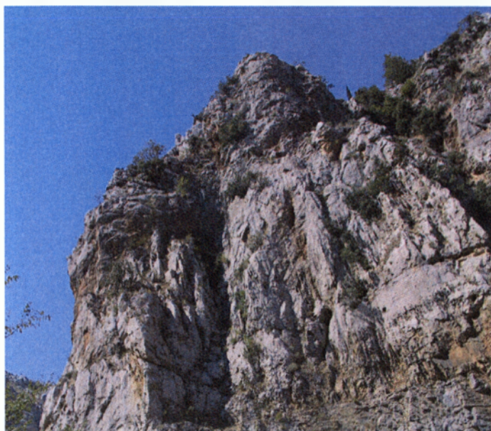
το φαράγγι στην Κρύα

Το αναρριχητικό πάρκο έλκει πλήθος επισκεπτών /αναρριχητών καθώς είναι εύκολη η πρόσβαση σε αυτό διότι βρίσκεται μέσα στην πόλη. Σε τακτά χρονικά διαστήματα διοργανώνονται αγώνες αναρρίχησης από το Δήμο και από τοπικούς ορειβατικούς συλλόγους.