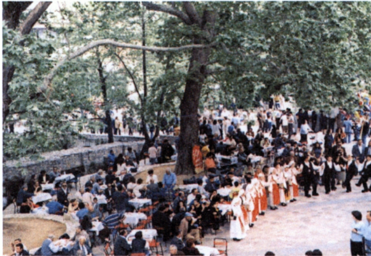
Πασχαλινές εκδηλώσεις στην περιοχή της Κρύας

<<Όμορφη που 'σαι Λειβαδιά! Με τα πλατάνια τα ψηλά δροσιά κι ανάσα δίνεις και με τις δυο σου τις πηγές Λήθης και Μνημοσύνης ξεχνάει καθείς από τη μια, όσα έχει αλλού περάσει, και με την άλλη δένεται ποτές μη σε ξεχάσει>> 5 .