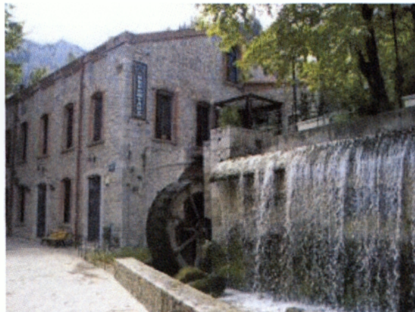
Νερόμυλος-Συνεδριακό κέντρο Κρύας