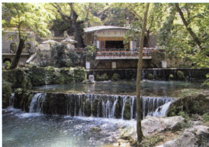
Το Δημοτικό αναψυκτήριο ΞΕΝΙΑ στις πηγές της Κρύας