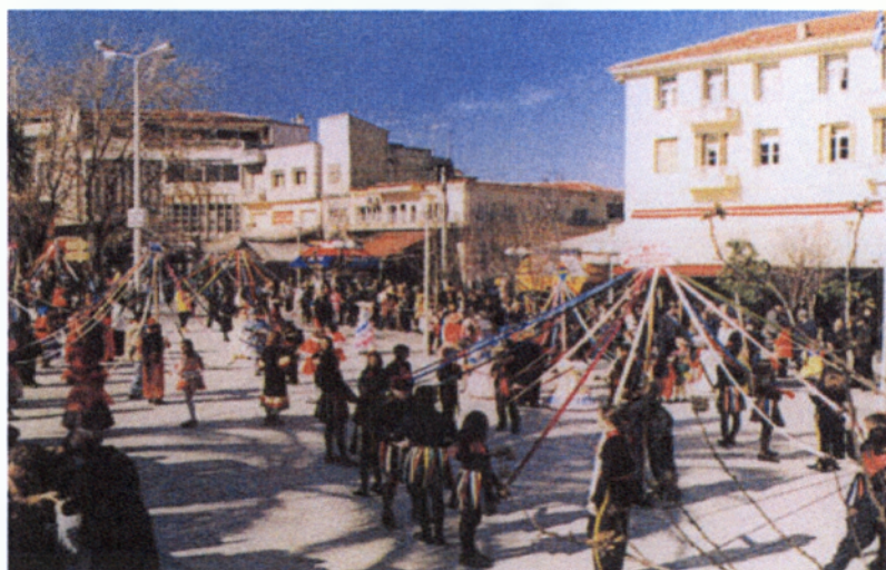
Γαϊτανάκι στην κεντρική πλατεία

Η κορύφωση των εκδηλώσεων της γιορτής πραγματοποιείται την τελευταία Κυριακή της Αποκριάς. Τότε, γίνεται παρέλαση αρμάτων και ομάδων από τις γειτονιές της πόλης, σχολεία, συλλόγους και παρέες, οι οποίοι μασκαρεμένοι πλέκουν το γαϊτανάκι τους με χορούς και παντομίμες, διασχίζοντας τους κεντρικούς δρόμους της Λιβαδειάς. Η παρέλαση τερματίζει στην πλατεία Λάμπρου Κατσώνη. Εκεί γίνεται βράβευση των τριών καλύτερων ομάδων με χρηματικά έπαθλα που χορηγούνται από διάφορους φορείς της πόλης και στη συνέχεια ακολουθεί γλέντι με δημοτικούς και λαϊκούς οργανοπαίκτες.