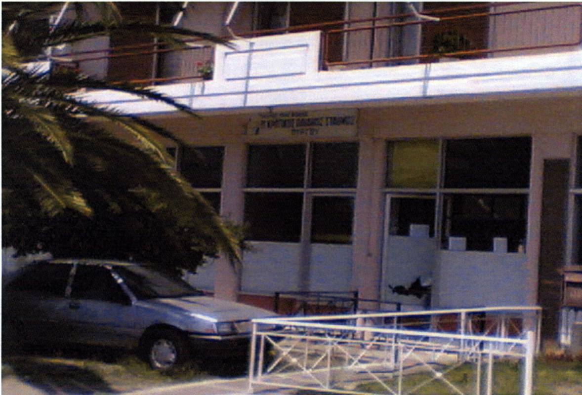
Εικόνα 2.2. Β΄ Παιδικός Σταθμός