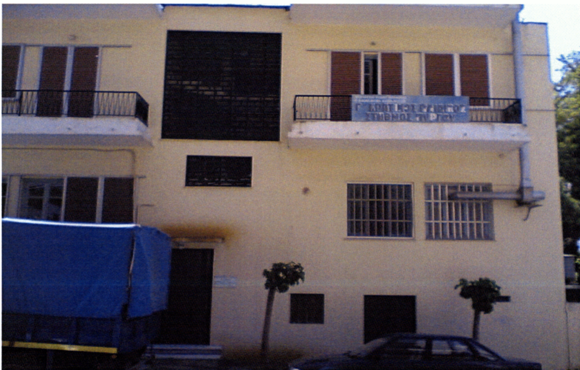
Εικόνα 2.3. Γ΄ Παιδικός Σταθμός