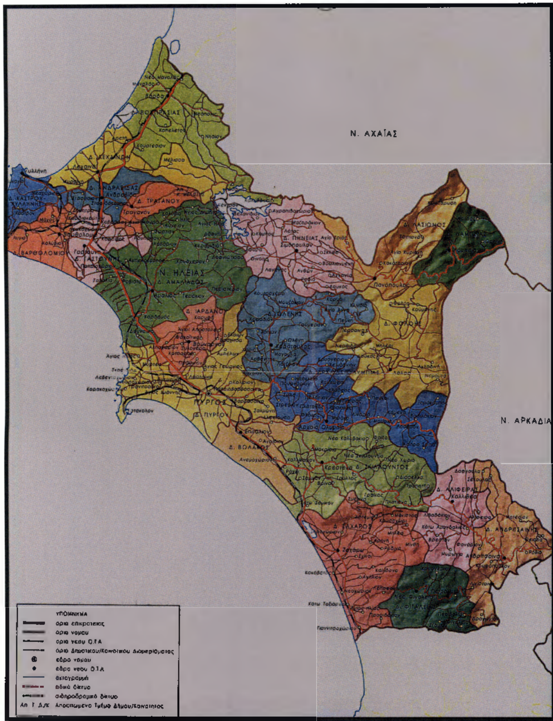
Χάρτης 1.3. Απεικόνιση Νομού Ηλείας

Το 50% των δήμων δεν υπερβαίνει τους 5.000 κατοίκους καθώς ο κύριος όγκος του πληθυσμού είναι συγκεντρωμένος στους δύο μεγαλύτερους δήμους του νομού, τον δήμο του Πύργου και τον δήμο Αμαλιάδος, οι οποίοι συγκεντρώνουν συνολικά 67.697 κατοίκους.