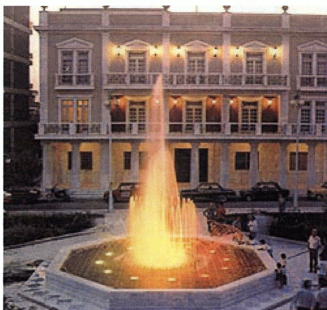
Εικόνα 1.12. Λάτσειο Δημοτικό Μέγαρο

Τις τελευταίες δεκαετίες ιδρύθηκαν φιλανθρωπικοί οργανισμοί, χτίστηκε το “Λάτσειο Δημοτικό Μέγαρο” και το θέατρο “Απόλλων” αναπαλαιώθηκε και αποκαταστάθηκε.