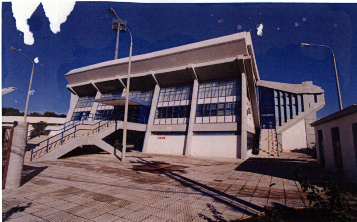
Εικόνα 3.1. Κτίριο Κλειστού Γυμναστηρίου

Οι αθλητικοί χώροι που ανήκουν στην αρμοδιότητα του Δημοτικού Σταδίου Πύργου είναι :