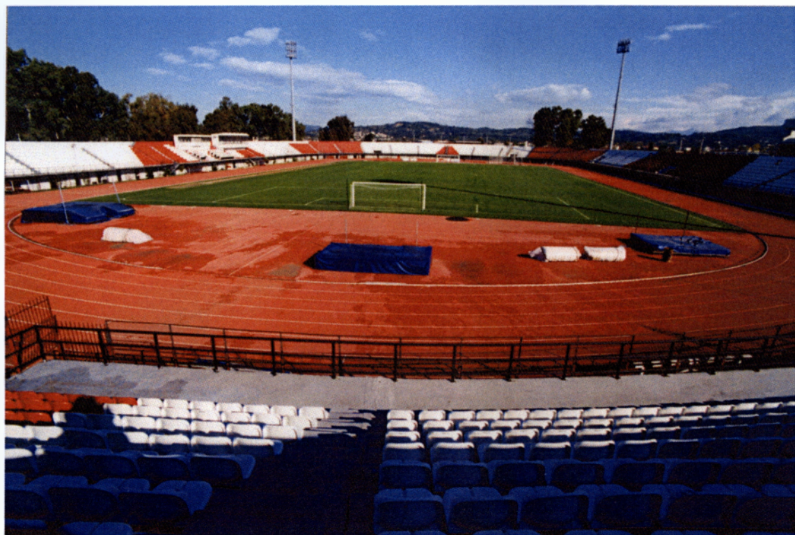
Εικόνα 3.3. Γήπεδο ποδοσφαίρου