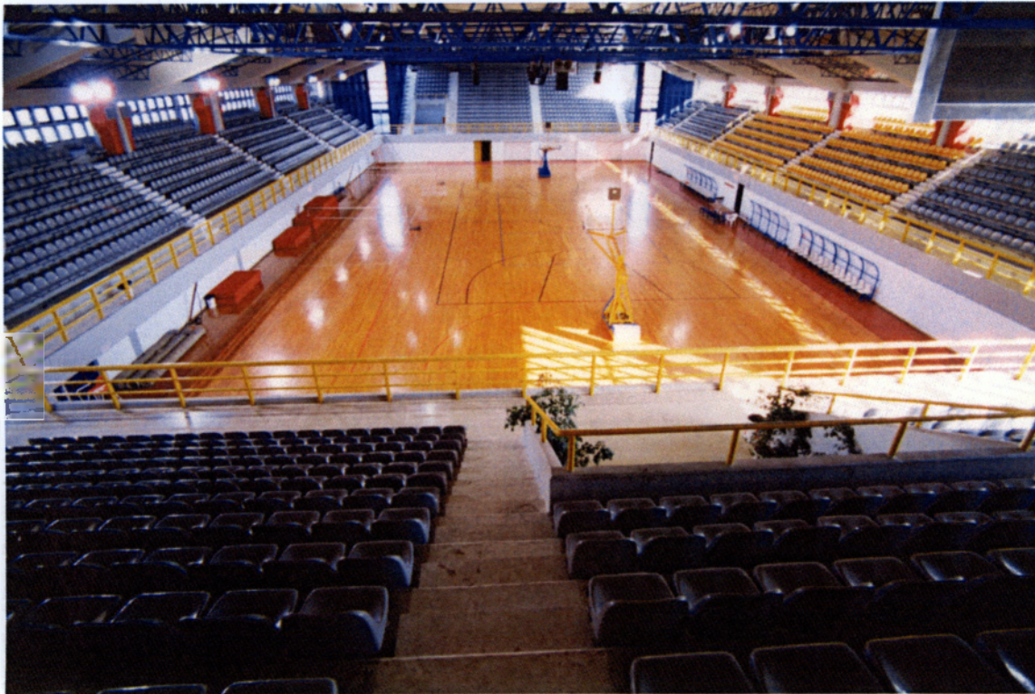
Εικόνα 3.2. Γήπεδο μπάσκετ