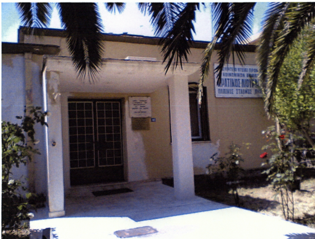
Εικόνα 2.1. Α΄ Παιδικός Σταθμός

Η λειτουργία των Παιδικών Σταθμών αρχίζει από τις 7.00 ώρα και λήγει στις 16.00 ώρα. Με απόφαση του Διοικητικού Συμβουλίου το ωράριο λειτουργίας του Σταθμού μπορεί να παρατείνεται για δύο (2) ώρες επιπλέον, εφόσον σ΄ αυτόν υπηρετεί το προσωπικό που απαιτείται και με την υποχρέωση καταβολής αποζημίωσης σε αυτό.