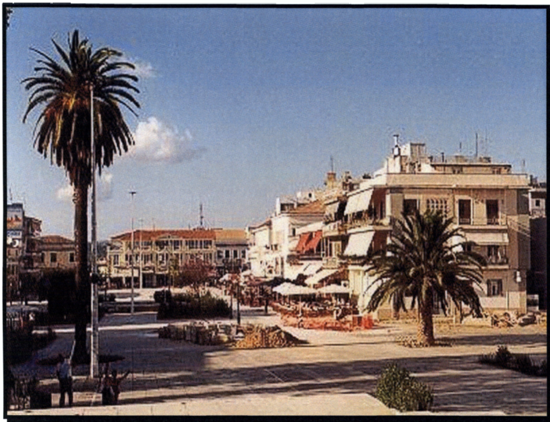
Εικόνα 1.9. Η πόλη του Πύργου

Η πόλη του Πύργου είναι η πρωτεύουσα του νομού Ηλείας. Η πόλη πήρε το όνομά της από έναν ψηλό πύργο που χρησίμευε ως παρατηρητήριο και έχτισε ο τετράρχης Ιωάννης Τσερνότας το 1520. Η πόλη αναφέρεται με το όνομα αυτό από το 1687.