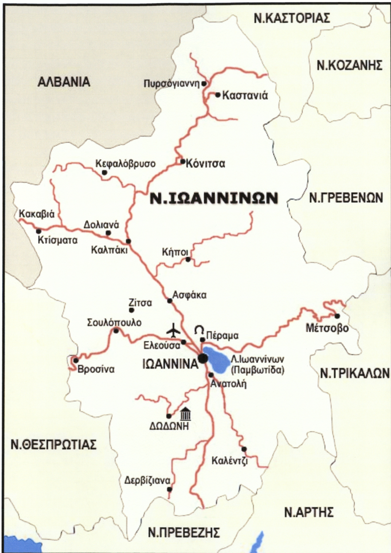
ΧΑΡΤΗΣ ΝΟΜΟΥ ΙΩΑΝΝΙΝΩΝ