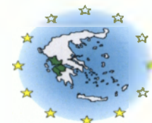
Πίνακας 57: Έργα του Δήμου Ι.Π. Μεσολογγίου στο Μέτρο 5.1