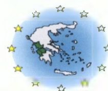
Πίνακας 43: Έργα του Δήμου Πατρέων στο Μέτρο 3.2