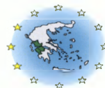
Πίνακας 45: Έργα του Δήμου Ι.Π. Μεσολογγίου στο Μέτρο 4.1