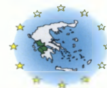
Πίνακας 44: Έργα του Δήμου Πατρέων στο Μέτρο 4.1