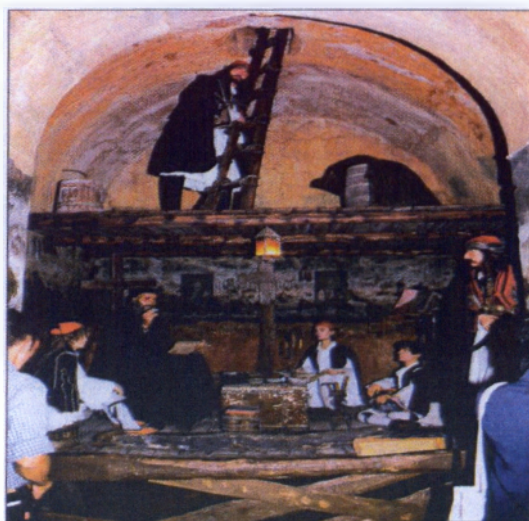
Μονή Αγ. Παρασκευής: Κρυφό Σχολείο - Κέρινα ομοιώματα

Το καθολικό του ναού όπως χαρακτηριστικά αναγράφεται σε μια επιγραφή στην πρόσοψή του, ανακαινίστηκε το έτος 1831. Εδώ στα χρόνια της σκλαβιάς, λειτουργούσε, κατά την παράδοση, Κρυφό Σχολείο. Μοναδική στο είδος της είναι η κρύπτη του μοναστηριού κάτω από τη γη, ανάμεσα στα κυπαρίσσια όπου ο επισκέπτης σήμερα έχει την ευκαιρία να δει την αναπαράσταση των κέρινων ομοιωμάτων των μαθητών και του καλογεροδασκάλου. Στο μοναστήρι της Αγίας Παρασκευής δίδαξε ο ιεροδάσκαλος Προκόπιος Γιαννέλος ο Αιτωλός από το Δρυμώνα (Μπερίκο), ο οποίος μάλιστα, σύμφωνα με την παράδοση υπήρξε και ο πρώτος δάσκαλος του Κοσμά του Αιτωλού.