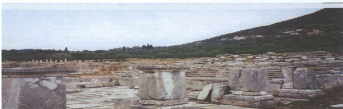
Εικόνα 3: ερείπια της Αρχαίας Μεσσήνης

Τα ερείπια της Αρχαίας Μεσσήνης απλώνονται σε απόσταση 20 χιλιομέτρων, 30 χιλιόμετρα βορειοδυτικά της Καλαμάτας. Είναι χτισμένη μέσα σε ένα επίλεκτο τόπο με πηγές και πλατάνια, στους πρόποδες του όρους Ιθώμη, κάτω από το χωριό Μαυρομάτι. Η Αρχαία Μεσσήνη χτίστηκε από τον Επαμεινώνδα το 370-369 π. Χ για να περιορίσει τη δύναμη της Σπάρτης.