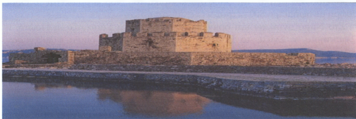
Εικόνα 1: Κάστρο Μεθώνης, Μπούρτζι

Κατά την περίοδο της Φραγκοκρατίας η Μεσσήνη έγινε φέουδο του ηγεμόνα της Αχαΐας. Το 1430 πέρασε στο Δεσποτάτο του Μοριά και μετά την κατάλυσή του έγινε θέατρο συγκρούσεων μεταξύ Ενετών, που κρατούσαν τη Μεθώνη- τη Κορώνη και τη Πύλο, και των Τούρκων. Το 1715 πέρασε στην κυριαρχία των Τούρκων και το 1821 συμμετείχε στην επανάσταση.