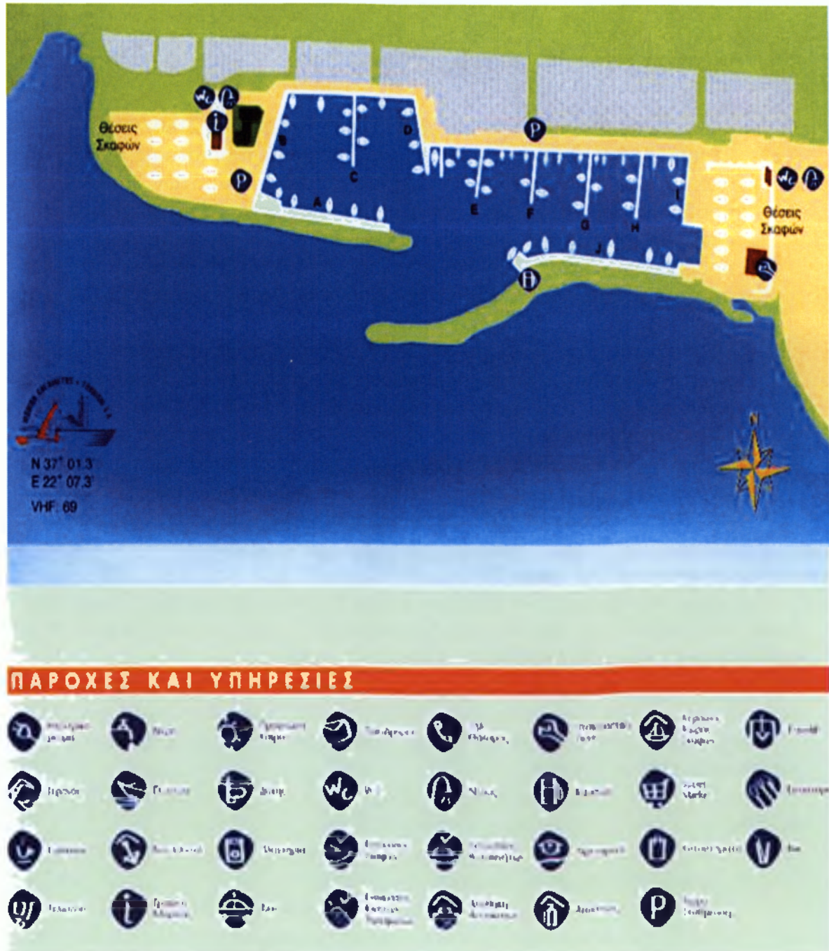
Εικόνα 1 : άποψη της Μαρίνας Καλαμάτας

Η μαρίνα Καλαμάτας είναι ένας από τους πιο σημαντικούς φορείς, ο οποίος ενισχύει το τουρισμό της πόλης, και ειδικότερα το θαλάσσιο τουρισμό. Ενδεικτικό στοιχείο είναι ότι το 1998 τα τουριστικά σκάφη που καταλάμβαναν θέσεις όλο τον χρόνο ήταν μόλις 5, ενώ αυτή τη στιγμή φτάνουν τα 190.