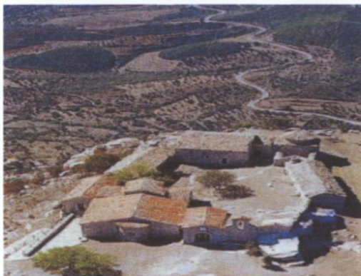
εικόνα 4: Μονή Βουλκάνου (παλιό μοναστήρι)

Στη Μονή σώζονται σπουδαία χειρόγραφα, λείψανα του Αγίου Ιωάννου του Χρυσοστόμου και του Διονυσίου του Αρεοπαγίτου, ιερά σκεύη και άμφια αλλά και η θαυματουργή εικόνα της Υπεραγίας Θεοτόκου (έργο του 14 ου αιώνα).