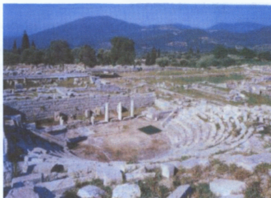
Εικόνα 5: Αρχαία Μεσσήνη- άποψη του εκκλησιαστηρίου