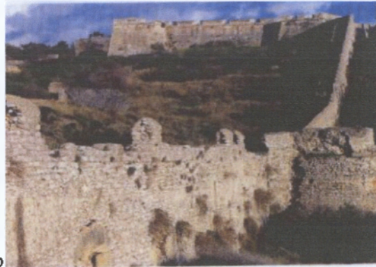
Εικόνα 6: Άλλη άποψη Παλιόκαστρου

Βρίσκεται στα βόρεια της σύγχρονης πόλης στο ακρωτήριο του Κορυφασίου, στον κόλπο της Βοϊδοκοιλιάς και κτίστηκε από τους Φράγκους τον 13 ο αιώνα. Διακρίνονται ερείπια φράγκικων και ενετικών κτισμάτων, τετράγωνοι και στρογγυλοί πύργοι και το εξωτερικό τείχος. Η σπηλιά του Νέστορα επικοινωνεί με το Παλιόκαστρο. Βόρεια του ακρωτηρίου σώζονται ερείπια της ελληνιστικής πόλης και στο νότιο άκρο τα ερείπια της ρωμαϊκής και της πρωτοχριστιανικής πόλης.