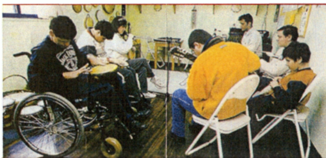
Εικόνα 1: Μουσικό συγκρότημα του ΚΔΑΠ ΑΜΕΑ του Δήμου Κω.

Τα ΚΔΑΠ ΑΜΕΑ του Δήμου Κω στελεχώνονται από ένα γυμναστή και φυσικοθεραπευτή, μία κοινωνική λειτουργό, δύο εκπαιδευτές τεχνικούς και ένα άτομο βοηθητικό προσωπικό.