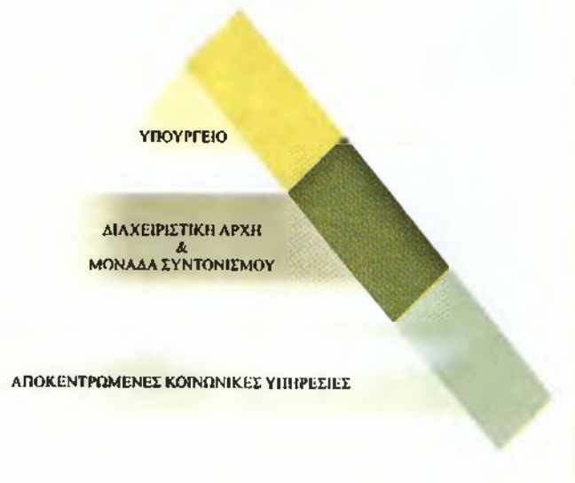
Πίνακας 1: Διάρθρωση του Δικτύου κοινωνικών υποστηρικτών διαδικασιών 26

Στα ανώτερα επίπεδα δραστηριοποιείται το Υπουργείο Υγείας και Κοινωνικής Αλληλεγγύης το οποίο φέρει ευθύνη για το σχεδιασμό, την παρακολούθηση και τον συντονισμό των κοινωνικών υπηρεσιών σε συνεργασία με την Διαχειριστική Αρχή του Προγράμματος και την Μονάδα Συντονισμού (δεύτερο επίπεδο). Στο κατώτερο επίπεδο βρίσκονται οι αποκεντρωμένες υπηρεσίες οι οποίες αναλαμβάνουν την επίτευξη των στόχων του Δικτύου