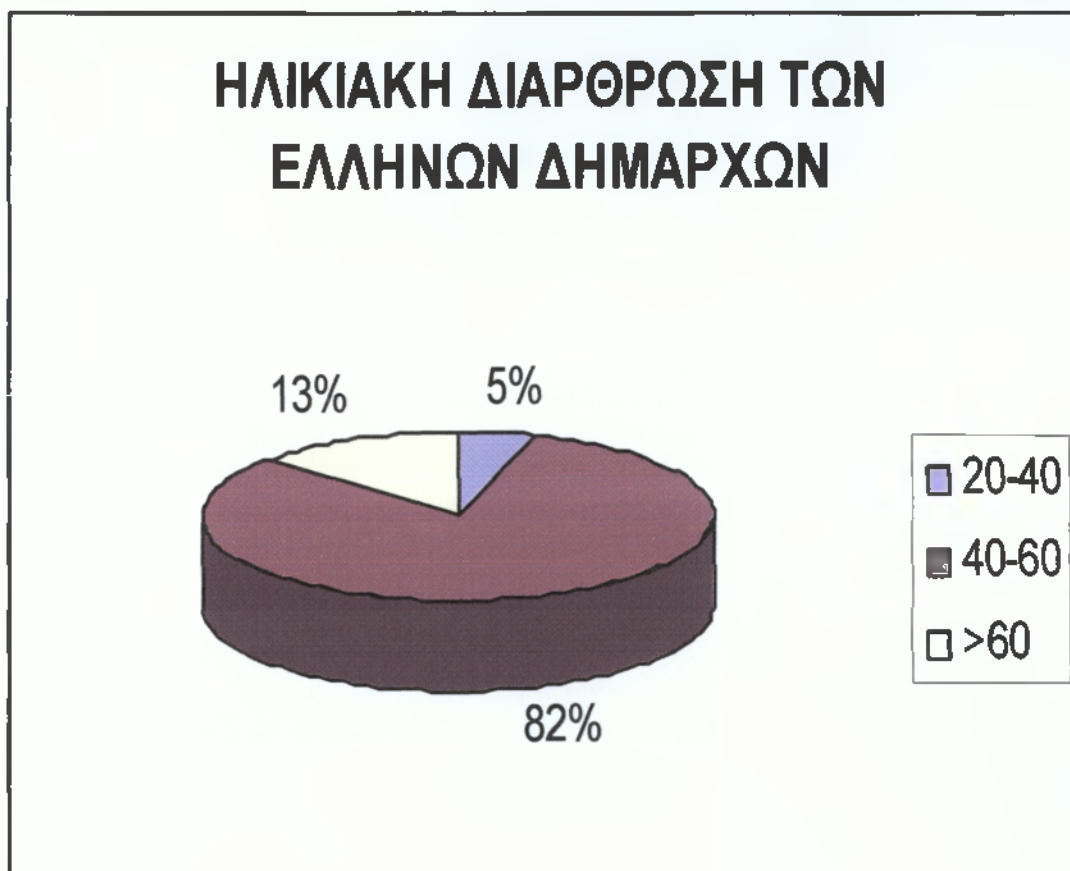
ΠΙΝΑΚΑΣ 1 Η ΗΛΙΚΙΑΚΗ ΔΙΑΦΘΡΩΣΗ ΤΩΝ ΕΛΛΗΝΩΝ ΔΗΜΑΡΧΩΝ

Με τη βοήθεια του διαγράμματος , παρατηρούμε πως η πλειοψηφία των εκλεγμένων Δημάρχων ανήκει στην κατηγορία σαράντα έως εξήντα και στις δύο δημοτικές και κοινοτικές περιόδους , δηλαδή ο Δήμαρχος στην Ελλάδα είναι μεσήλικας.