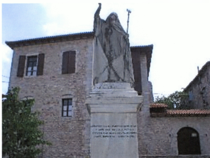
Οι ανδριάντες των Πατριάρχου Γρηγορίου του Ε΄(πάνω) και του Επισκόπου Παλαιών Πατρών Γερμανού (δεξιά) στη Δημητσάνα.

Μετά τη μονή Φιλοσόφου και τη μονή Αιμυαλών που είχαν γίνει εστίες γραμμάτων και καλλιτεχνίας, ακολούθησε η Δημητσάνα με τη συστηματική Σχολή Ελληνικών γραμμάτων που ιδρύθηκε το έτος 1764. Στα προεπαναστατικά χρόνια, από τις σχολές αυτές αποφοίτησαν πολλοί και διαπρεπείς άνδρες, οι οποίοι κατέλαβαν επισκοπικές έδρες στο θρόνο της Κωνσταντινούπολης, των Ιεροσολύμων, της Αντιόχειας και της Αλεξάνδρειας. Ο Εθνομάρτυρας Πατριάρχης Γρηγόριος ο Ε΄ και ο Πρωτεργάτης του αγώνα Επίσκοπος Παλαιών Πατρών Γερμανός, αποτελούν την πιο πειστική μαρτυρία για την πνευματική άνθηση αυτού του τόπου.