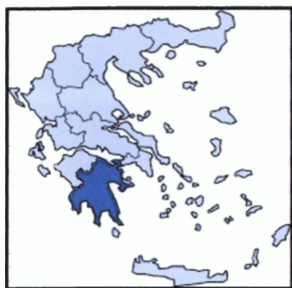
Σχήμα 1: Γεωγραφικό πεδίο εφαρμογής του ΠΕΠ

Το γεωγραφικό πεδίο εφαρμογής του Περιφερειακού Επιχειρησιακού Προγράμματος Πελοποννήσου καλύπτει όλη την έκταση της εν λόγω Περιφέρειας, η οποία καταλαμβάνει το νότιο τμήμα της ηπειρωτικής Ελλάδας (Σχήμα 4-1).