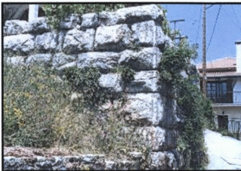
Ισόδομο τείχος- Αρχαϊκή εποχή