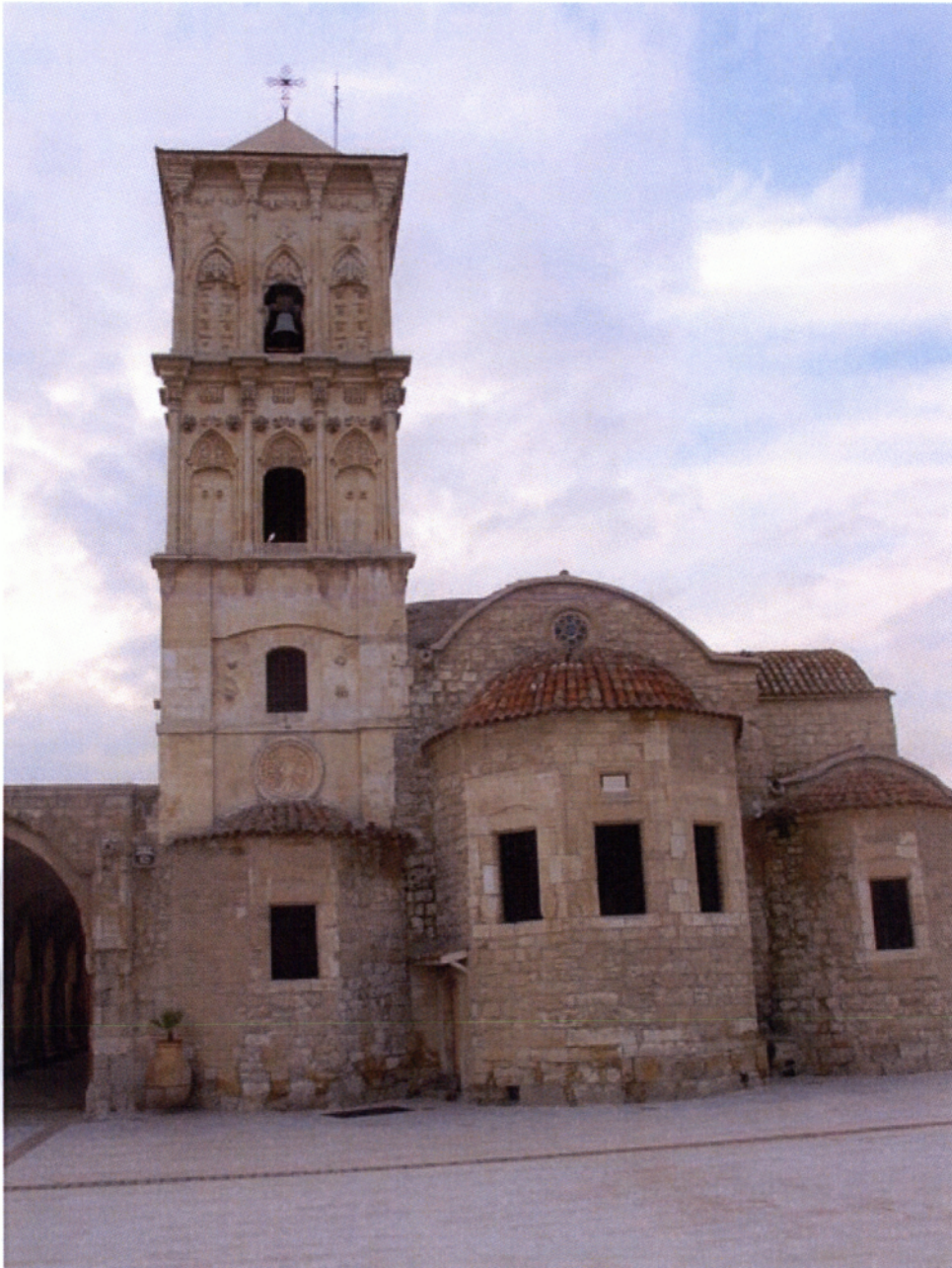
6.1.2. Η Εκκλησία του Αγίου Λαζάρου στη Λάρνακα.