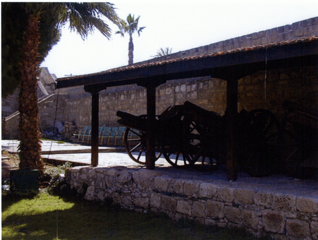
6.1.3. Κανόνια από την εποχή της Αγγλοκρατίας στην Κύπρο στο Μεσαιωνικό Κάστρο Λάρνακας.