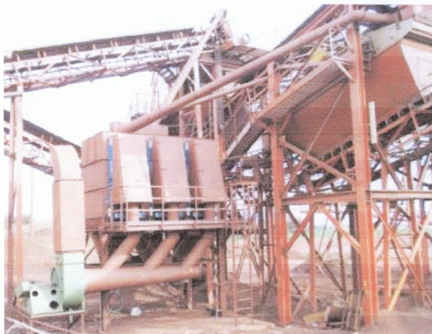
Εικόνα 1 Τεχνική απορρύπανσης.