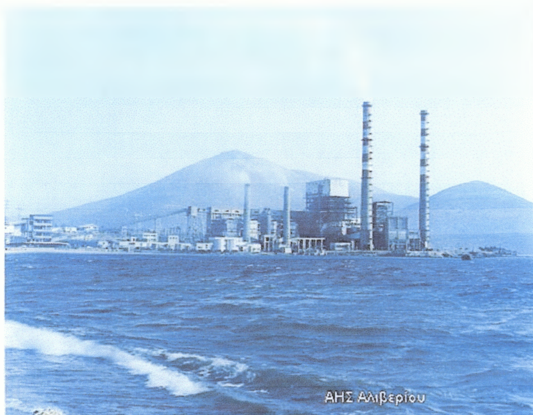
Εικόνα 2 Εργοστάσιο ΔΕΗ Αλιβερίου