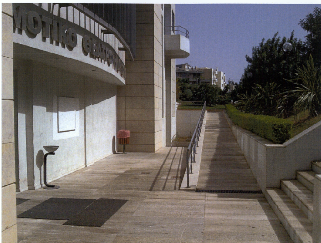
Εικόνα 8: Ράμπα από αντιολισθηρό υλικό στην είσοδο του δημοτικού θεάτρου.