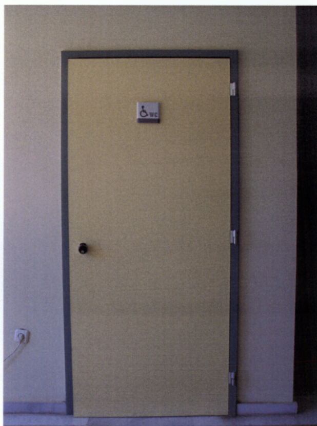
Εικόνα 9: Σε κάθε όροφο του δημαρχείου, υπάρχει WC για Α.μ.Ε.Α.