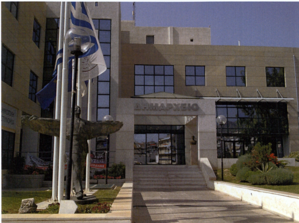
Εικόνα 6: Το Δημαρχείο Ηλιούπολης.