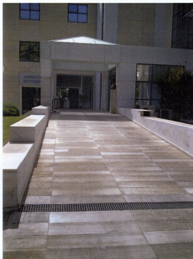
Εικόνα 7: Ράμπα από αντιολισθηρό υλικό (είσοδος Δημαρχείου).