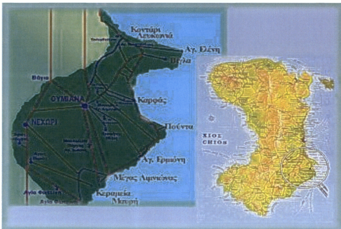
ΧΑΡΤΗΣ ΧΙΟΥ-ΔΗΜΟΥ ΑΓΙΟΥ ΜΗΝΑ

Έχει (πραγματικό) πληθυσμό σύμφωνα με την απογραφή της Ε.Σ.Υ.Ε του 2001 2686 κατοίκους από το οποίο το 51% είναι γένους θηλυκού ενώ το υπόλοιπο 49% είναι γένους αρσενικού. Επίσης παρατηρείται και ένα μικρό ποσοστό αλλοδαπών το οποίο ανέρχεται στο 5%.