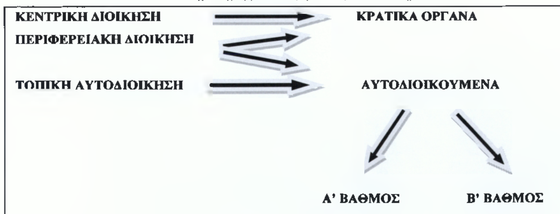
Σχεδιάγραμμα 1: Δομή Διοικητικού Συστήματος

Γενικότερα, η περιφερειακή διοίκηση μπορεί να είναι είτε αποκεντρωμένη κρατική υπηρεσία είτε αυτοδιοικούμενη, όπως δείχνει και το παρακάτω σχεδιάγραμμα.