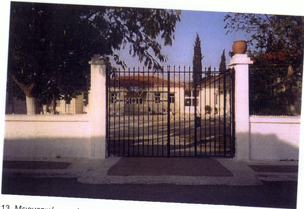
13. Μειονοτικό γυμνάσιο στον οικισμό Ήφαιστο στην Κομοτηνή.