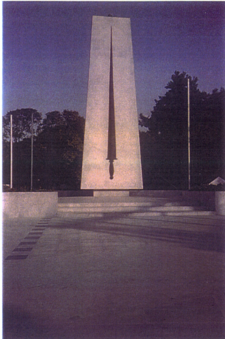
1. Από τα γνωστά χαρακτηριστικά της Κομοτηνής : το Ηρώο.