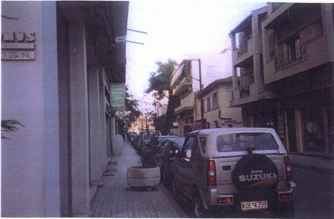
16. Στο βάθος το τουρκικό προξενείο στην Κομοτηνή: μόνο κακά προξενεί.