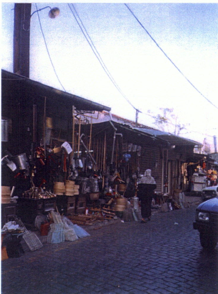
2. Γραφικά σοκάκια της Κομοτηνής.