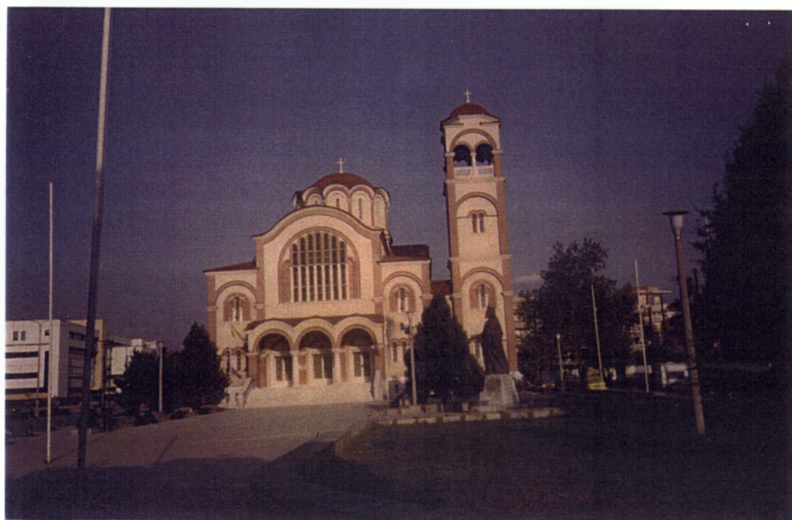
6. Κομοτηνή: Ο Ιερός ναός Ευαγγελισμού της Θεοτόκου.