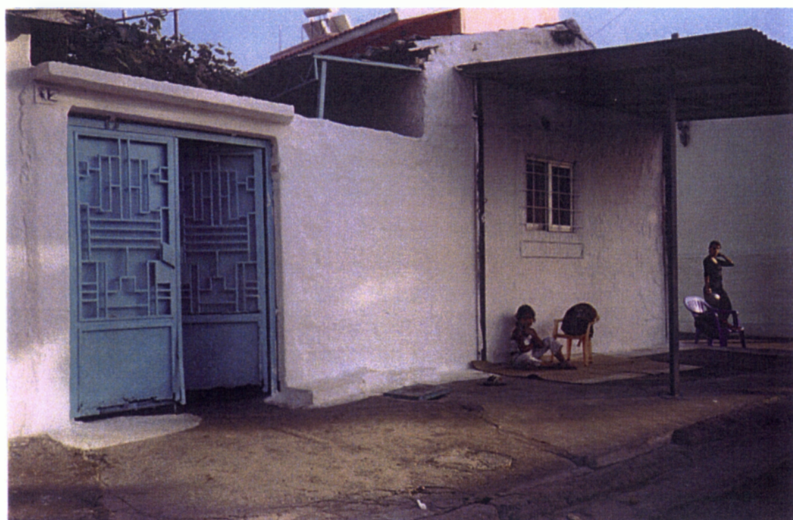
11. Μουσουλμανικό σπίτι στον Ήφαιστο της Κομοτηνής.