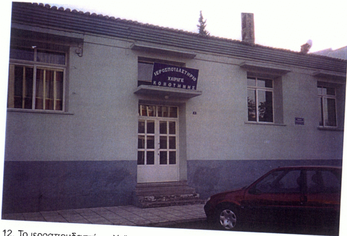
12. Το ιεροσπουδαστήριο Χαΐριγιέ στην Κομοτηνή.