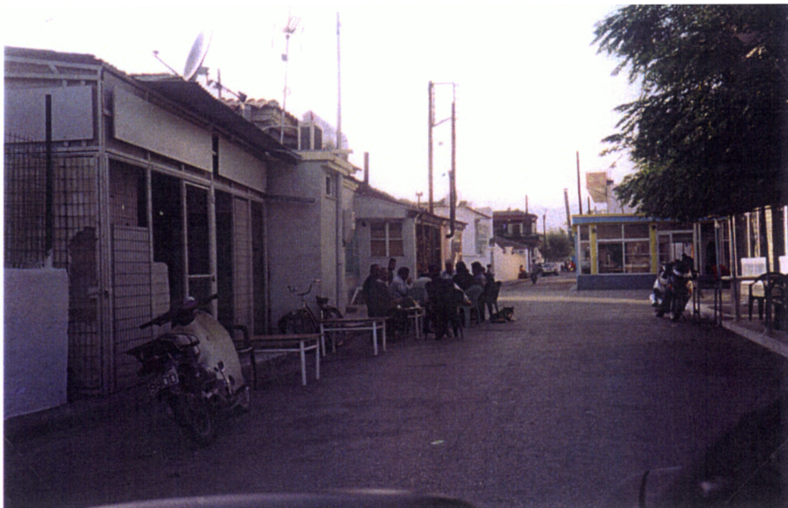
3. Μουσουλμανικό καφενείο σε χωριό, κοντά στην Κομοτηνή.