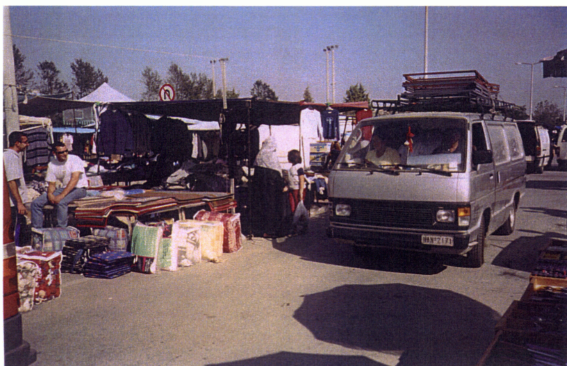
15. Έλληνες πόντιοι πρόσφυγες και Έλληνες μουσουλμάνοι εκθέτουν τηνπραμάτεια τους στη λαϊκή αγορά.