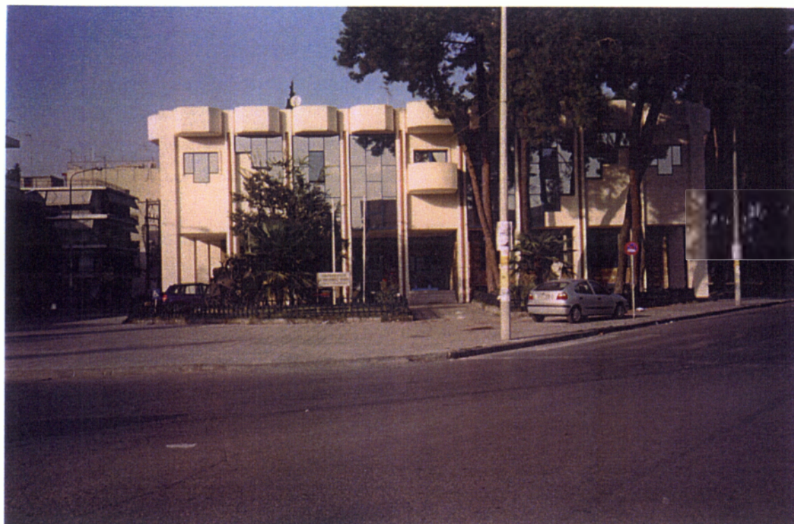
5. Η Περιφέρεια Ανατολικής Μακεδονίας και Θράκης η οποία εδρεύει στην Κομοτηνή.