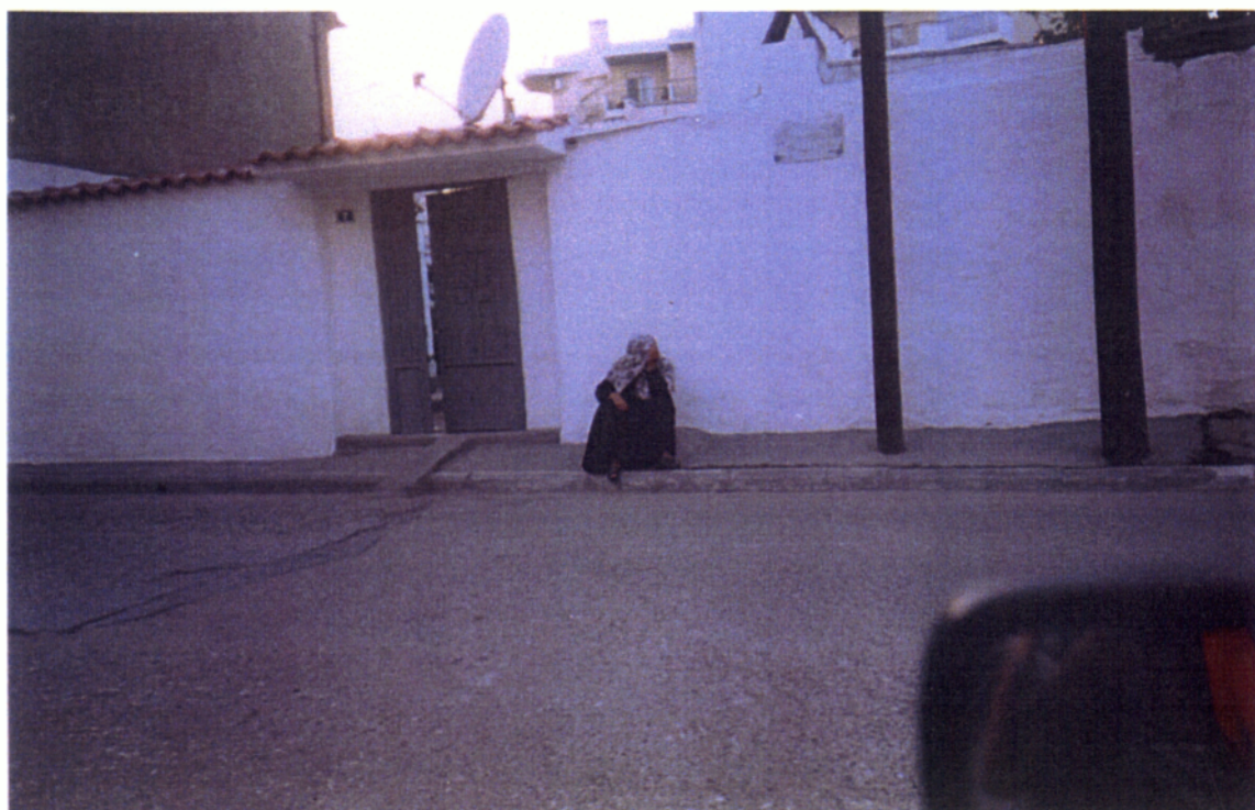
10. Εδώ, η συντηρητική μουσουλμάνα, φανερά ενοχλημένη από την παρουσία μας, κρύβει το πρόσωπό της από τον φακό.