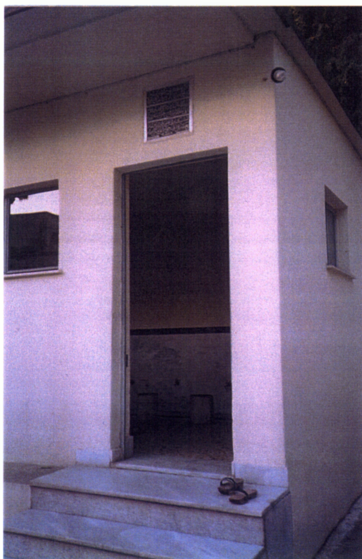
9. Πρίν από την προσευχή απαιτείται το πλύσιμο και ο καθαρισμός των μελών του σώματος και του προσώπου.