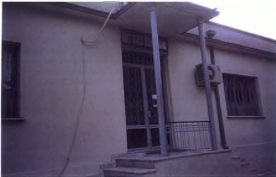
8. Η Μουφτεία Κομοτηνής.