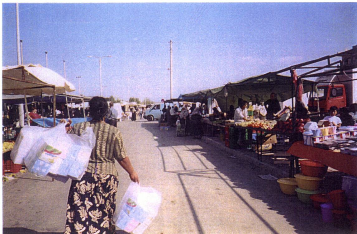
14. Το παζάρι της Τρίτης στην Κομοτηνή.