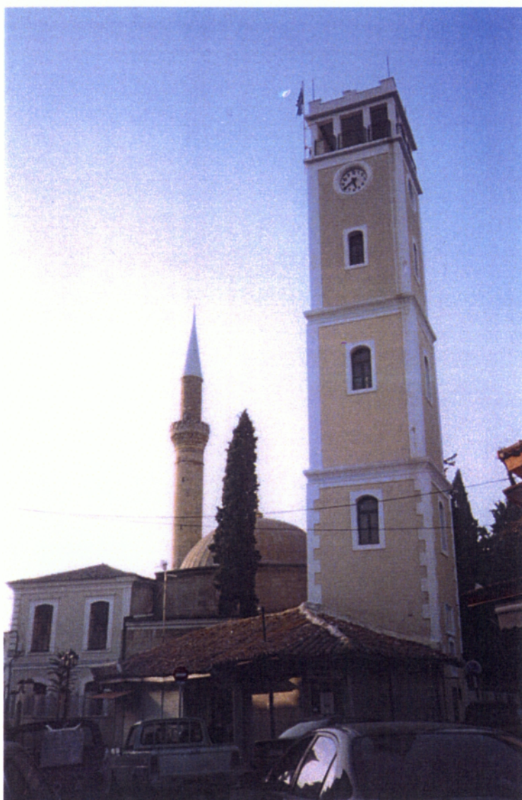
7. Το γνωστό Γενί Τζαμί με το δημοτικό ρολόι, στην Κομοτηνή.