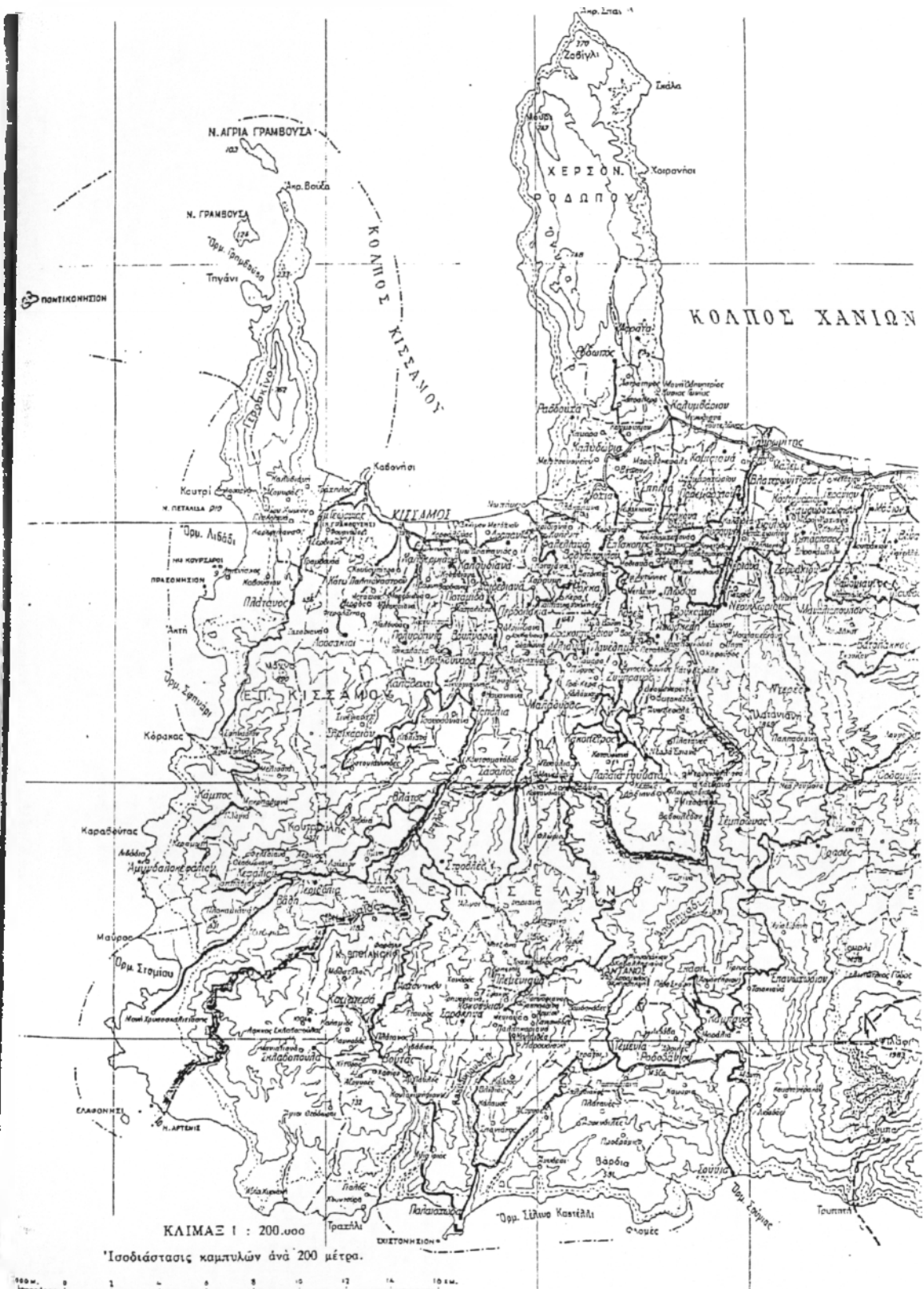
ΧΑΡΤΗΣ 1.1. Επαρχία Κισσάμου Ν. Χανίων