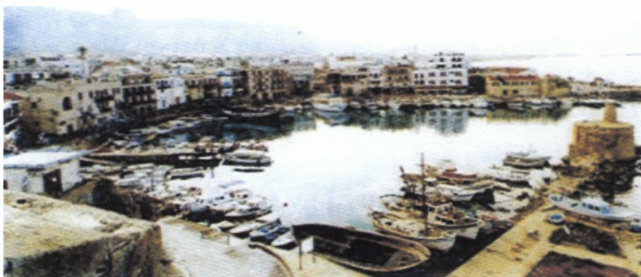
Το λιμανάκι της Κερύνειας

Η Κερύνεια, η μικρότερη σε έκταση και πληθυσμό από τις έξι πόλεις της Κύπρου και πρωτεύουσα της ομώνυμης επαρχίας, ήταν σημαντικό τουριστικό κέντρο τόσο για Κύπριους όσο και για ξένους επισκέπτες. Κτισμένη στη βόρεια ακτή της Κύπρου και έχοντας πίσω της την εντυπωσιακή οροσειρά του Πενταδάκτυλου, περιτριγυρίζεται από ένα εξαιρετο φυσικό περιβάλλον που συνδυάζει τη θάλασσα με το βουνό.