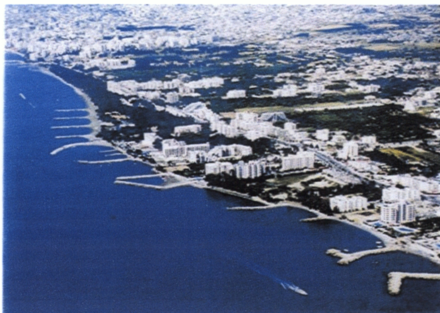
Παραλιακή κάτοψη της Λεμεσού

Η Λεμεσός είναι η δεύτερη μεγαλύτερη πόλη του νησιού και το πιο σημαντικό, σήμερα, τουριστικό και εμπορικό κέντρο της Κύπρου. Βρίσκεται ανάμεσα σε δύο αρχαίες πόλεις – βασιλεία, την Αμαθούντα στα ανατολικά και το Κούριο στα δυτικά. Με το όνομα Νεάπολις άρχισε να αναφέρεται ήδη από την πρώιμη Βυζαντινή εποχή. Στα μεσαιωνικά χρόνια η Λεμεσός φιλοξένησε το γάμο του Ριχάρδου του Λεοντόκαρδου και της Βερεγγάριας, η οποία στέφθηκε εδώ βασίλισσα της Αγγλίας. Αργότερα οι Σταυροφόροι ίδρυσαν το αρχηγείο τους στα δυτικά της πόλης, στο μεσαιωνικό κάστρο του Κολοσσιού, όπου ενθάρρυναν την κατασκευή των κρασιών ιδίως του γλυκού κρασιού, της Κουμανταρίας, που φέρνει το αρχαιότερο όνομα κρασιού στον κόσμο.