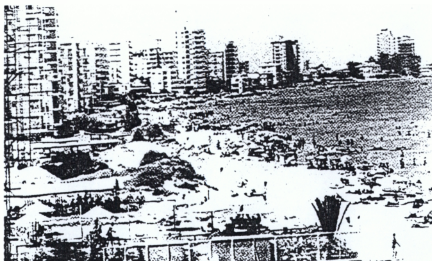
Αμμόχωστος η νεκρή πολιτεία

Η πόλη εκκενώθηκε πλήρως από τον ελληνικό πληθυσμό της κατά τη δεύτερη φάση της τουρκικής εισβολής, μπροστά στον κίνδυνο του βάρβαρου τουρκικού στρατού και αφού η πόλη είχε επανειλημμένα βομβαρδιστεί από την τουρκική αεροπορία.