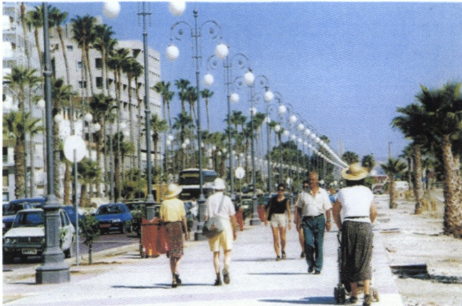
Το παραλιακό μέτωπο των Φοινικούδων

Η νεότερη πόλη της Λάρνακας έχει ένα δικό της μοναδικό χαρακτήρα. Η παραλία της με τη σειρά των πανύψηλων φοινικόδεντρών της, φέρνει στο νου μνήμες από παλιές προκυμαίες. Σε μικρή απόσταση η Μαρίνα της Λάρνακας φιλοξενεί ιστιοπλόους και ταξιδιώτες απ' όλο τον κόσμο. Η Λάρνακα φιλοξενεί το Διεθνές Αεροδρόμιο, έτσι προσφέρει στον ταξιδιώτη την πρωταρχική γεύση του νησιού. Κατά τους χειμερινούς μήνες χιλιάδες αποδημητικά πουλιά κάνουν τον ετήσιο σταθμό τους στην Αλυκή της Λάρνακας προσφέροντας ένα πανέμορφο θέαμα.