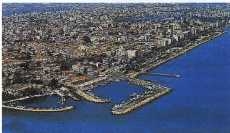
ΤΟ ΛΙΜΑΝΙ ΛΕΜΕΣΟΥ (ένα μεγάλο αναπτυξιακό έργο του Δήμου Λεμεσου)

Περιλαμβάνονται οι δαπάνες για αναπτυξιακά έργα που προγραμματίζει να διενεργήσει ο Δήμος στο υπ' αναφορά έτος και ο τρόπος χρηματοδότησης αυτών των δαπανών. Η χρηματοδότηση των αναπτυξιακών έργων γίνεται συνήθως με δανεισμό ή ειδική κρατική χορηγία.