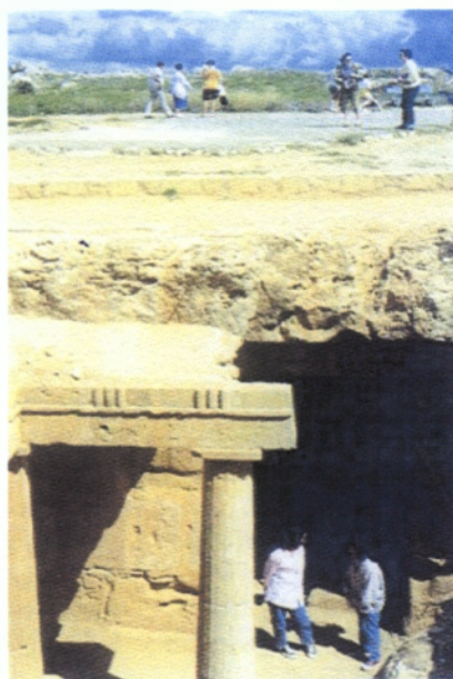
Τάφοι των Βασιλέων

Στην αρχαιότητα, η Πάφος ήταν για ένα μεγάλο διάστημα η πρωτεύουσα της Κύπρου. Στις ακτές της γεννήθηκε, σύμφωνα με την παράδοση, η Αφροδίτη, η θεά του έρωτα και της ομορφιάς και εδώ βρισκόταν το κέντρο της λατρείας της. Στα Κούκλια, ένα χωριό της Πάφου, σώζονται ακόμα και σήμερα τα ερείπια του πρώτου και σημαντικότερου ιερού της θεάς.