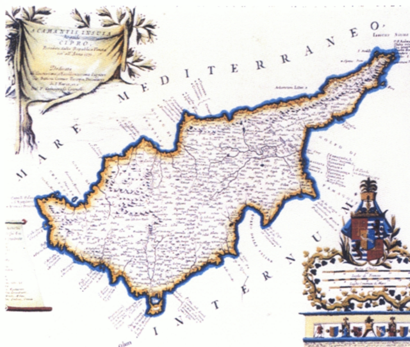
Παλιός χάρτης της Κύπρου

ΣΠΟΥΔΑΣΤΕΣ: ΑΛΕΞΑΝΔΡΟΥ ΚΡΙΣΤΗΣ ΧΡΙΣΤΟΦΟΡΟΥ ΣΟΦΙΑ