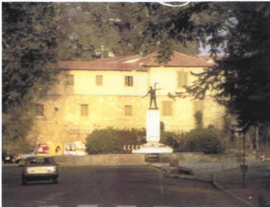
Κυκλικός κόμβος Λευκωσίας

Είναι η πρωτεύουσα της Κύπρου και ο πληθυσμός της στην ευρύτερη αστική περιοχή ανερχόταν το 1996 στις 193.000. Σ' αυτή βρίσκεται η έδρα της κυβέρνησης, οι ξένες πρεσβείες και άλλες αντιπροσωπεΐες και τα κεντρικά γραφεία των μεγάλων οργανισμών.