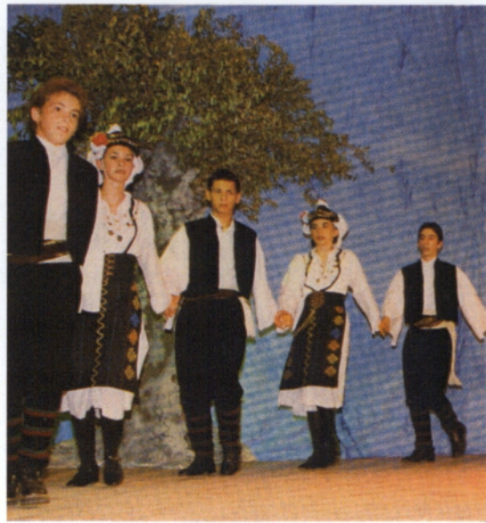
Εμφάνιση χορευτικών συγκροτημάτων στο Δημοτικό Αμφιθέατρο

Έπειτα ακολούθησε ο ετήσιος χορός του συλλόγου Σαρακατσαναίων Ν. Ξάνθης «Ο Λεπενιώτης» στο μουσικό κέντρο «Πολιτεία» με πολύ παραδοσιακή μουσική και τραγούδι και αρκετά ικανοποιητική προσέλευση κόσμου. Λίγο αργότερα ακολούθησε το πάρτι μεταμφιεσμένων του ομίλου Ρόταρακτ Ξάνθης στο καφέ – μπαρ «Αίγλη». Ήταν ένα τρελό αποκριάτικο πάρτι με εκατοντάδες μασκαρεμένους σε μια πραγματικά αξέχαστη καρναβαλική βραδιά. Τέλος την ίδια μέρα είχαμε και το πάρτι που διοργάνωσαν οι Πολιτιστικοί σύλλογοι της οργανωτικής επιτροπής των Θρακικών Λαογραφικών Γιορτών στο χώρο του «Αρίωνα», καθώς και το πάρτι των Πολιτιστικών συλλόγων «Κατακτητές» και «Αμφιτρύωνες» στο κέντρο διασκέδασης «Χάντρες».