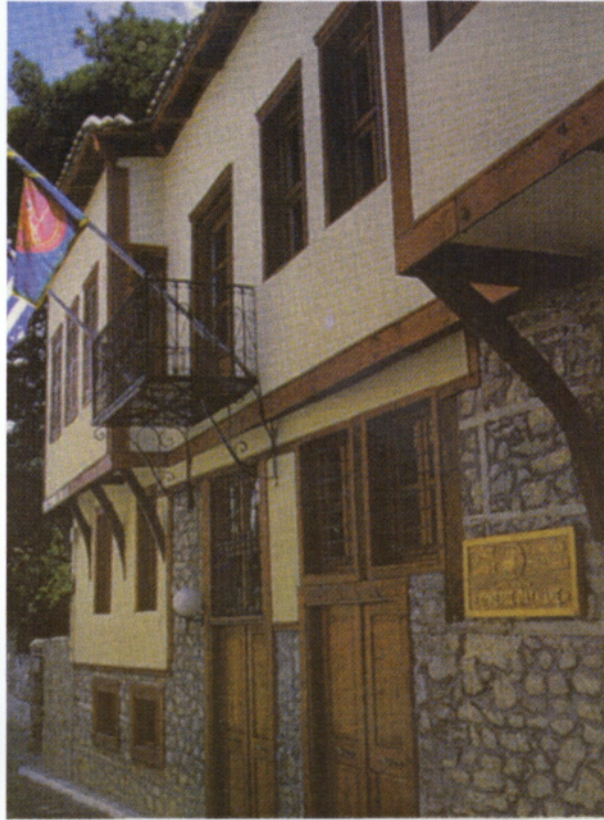
Δημοτική Πινακοθήκη όπου στεγάζονται πολλές εκθέσεις καλλιτεχνών.

Μουσείο της Φ.Ε.Ξ., ενώ οι συναυλίες και οι θεατρικές παραστάσεις στο Πνευματικό & Πολιτιστικό Κέντρο του Δήμου Ξάνθης, στις παλιές καπναποθήκες, και το υπαίθριο Δημοτικό Αμφιθέατρο, καθώς επίσης και στην Πλατεία Μητροπόλεως της Παλιάς Πόλης.