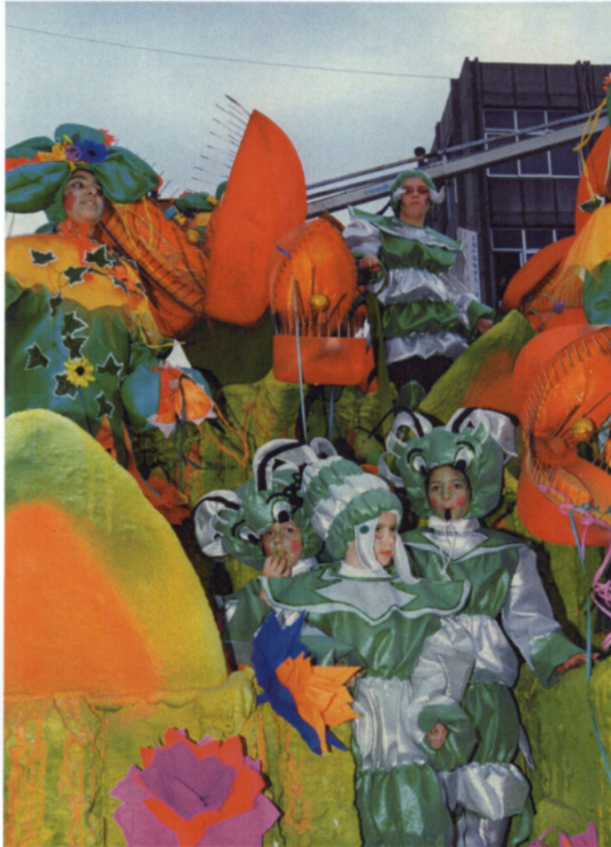
Οι μικροί Καρναβαλιστές πάντα παρόντες σε όλες τις παρελάσεις

συνοδευόταν από εκατοντάδες ντυμένους Λούκι Λουκ και χορεύτριες των Σαλούν. Συμμετείχε στην παρέλαση με 900 καρναβαλιστές. Το σύνολο όλων των καρναβαλιστών που παρέλασαν άγγιξε τις 14.000 και ήταν η μεγαλύτερη σε όγκο παρέλαση που έγινε ποτέ στην πόλη της Ξάνθης 45 .