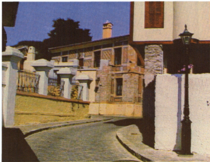
Σοκάκι της Παλιάς Πόλης