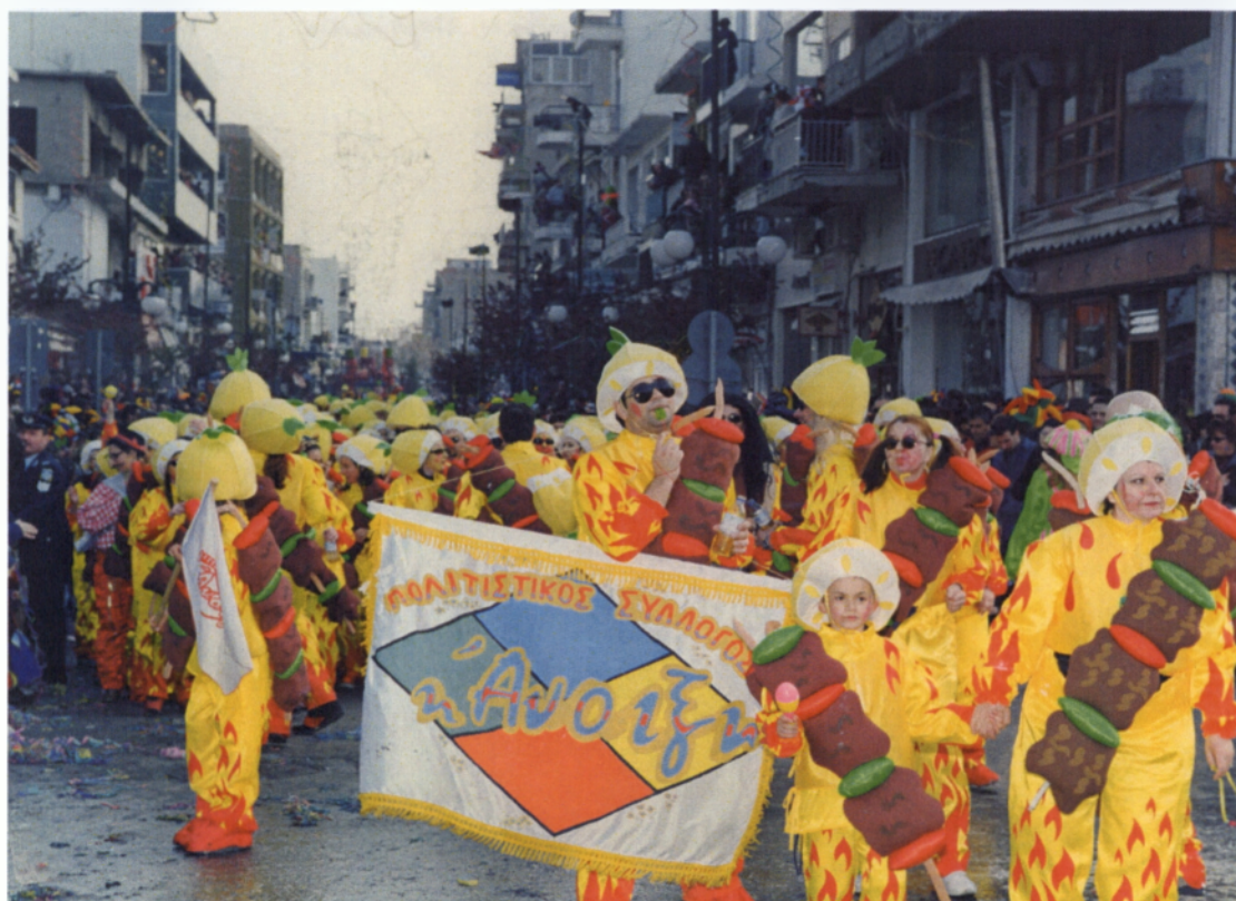
Ο Πολιτιστικός σύλλογος «Άνοιξη» παρελαύνει στη μεγάλη παρέλαση της Κυριακής

Ακολούθησε ο Πολιτιστικός σύλλογος φοιτητών «Η Γέφυρα» με το θέμα τους «Δεν είμαστε πρόβατα». Τα παιδιά από το Πολυτεχνείο Ξάνθης συμμετείχαν για άλλη μια χρονιά, στην παρέλαση, πιστοποιώντας πάλι τη σχέση τους με την τοπική κοινωνία και τη συμμετοχή τους στην πόλη που ζουν και σπουδάζουν. Με το θέμα τους αυτό θέλουν να δείξουν ότι δεν είναι κατευθυνόμενοι από κανέναν και ότι είναι ελεύθεροι και ανεξάρτητοι. Στην παρέλαση συμμετείχαν 550 άτομα.