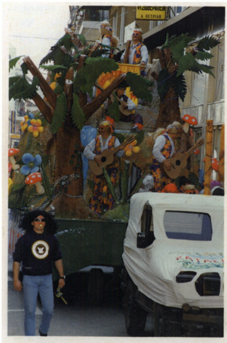
Το άρμα του Συλλόγου κατασκηνωτές, εντυπωσιακό και πρωτότυπο σε κάθε παρέλαση, με θέμα του «Χίπηδες»

Επόμενος σύλλογος ήταν οι «Κατασκηνωτές» με το θέμα τους «Χίπηδες». Νοσταλγώντας τις εποχές που ξέγνοιαστα τα παιδιά των λουλουδιών χάιρονταν τη ζωή τα μέλη του συλλόγου επέλεξαν αυτό το θέμα, και με σύνθημα τους το «Make love not war». Προειδοποιούν ότι ο πόλεμος βλάπτει σοβαρά την υγεία. Συμμετείχε με 400 άτομα.