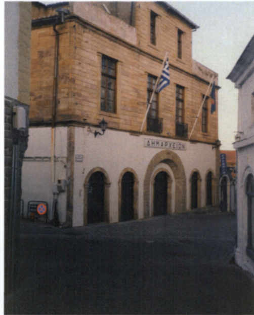
Το Δημαρχείο της πόλης

το Δημαρχείο Ξάνθης κτίστηκε το 1830 από τον Εβραίο καπνέμπορο Μωυσή και πουλήθηκε αργότερα στον Ι. Ορφανίδη. Το 1962 τον εν λόγω κτίριο αγοράστηκε από τον Δήμο Ξάνθης για να στεγάσει τις υπηρεσίες του. Επίσης πανέμορφο είναι και το αρχιτεκτόνημα της Δημοτικής Πινακοθήκης, που πρόσφατα συντηρήθηκε με σεβασμό και μεράκι. Τέλος επιβλητικό είναι και το Αρχοντικό Κουγιουμτζόγλου που βρίσκεται διατηρητέο στην Παλιά Πόλη.