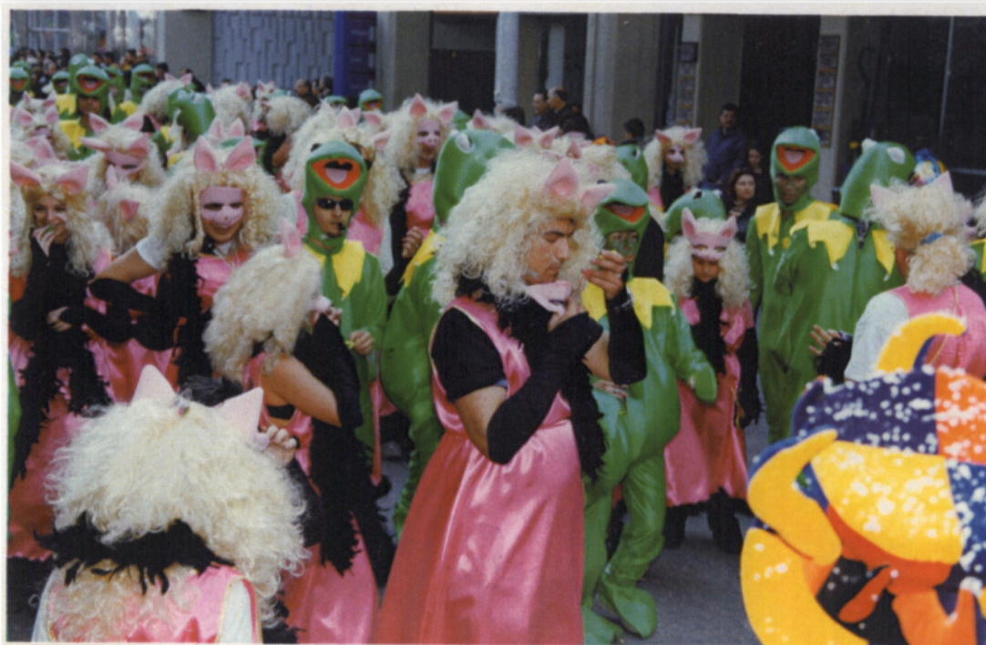
Το σώμα ελλήνων προσκόπων κατά την παρέλαση του την Κυριακή στην μεγάλη καρναβαλική παρέλαση

Στη συνέχεια πέρασε ο Πολιτιστικός σύλλογος γυναικών Δήμου Βιστωνίδας με θέμα του «The Flintstones». Ο σύλλογος συμμετείχε με 850 καρναβαλιστές, ντυμένους με ωραιότατες στολές τις οποίες και κατασκεύασαν μόνοι τους. Ο επόμενος σύλλογος ήταν ο Πολιτιστικός σύλλογος «Σπάρτακοι 82» με θέμα «Οι Σπάρτακοι στην Αρχαία Ρώμη». Ο σύλλογος ιδρύθηκε το 1997, έχοντας συνεχή παρουσία σε όλες τις Καρναβαλικές παρελάσεις. Συμμετείχε με 750 καρναβαλιστές, ντυμένους σαν γενναίοι μονομάχοι, συγκλητικοί, και Ρωμαίες μαζί με τις σκλάβες τους και μας μετέφεραν σε μια αρχαία εποχή και στην Ρωμαϊκή αρένα.