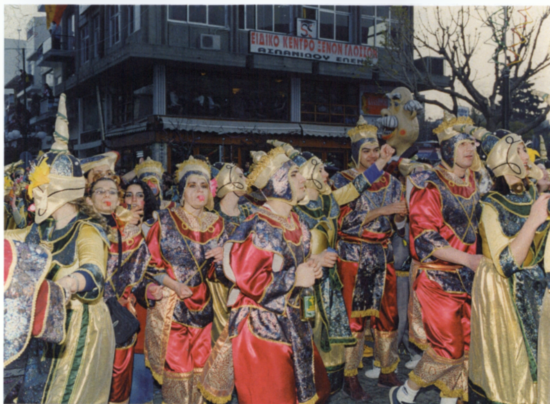
Φώτο βραδινής παρέλασης

Η Κυριακή 17 Μαρτίου ήταν και η τελευταία μέρα των Θρακικών Λαογραφικών Γιορτών – Καρναβάλι της Ξάνθης, και όλοι περίμεναν από νωρίς την κορύφωση των εκδηλώσεων που δεν ήταν άλλη από την μεγάλη Καρναβαλική παρέλαση των Καρναβαλιστών και των αρμάτων, και την λήξη των γιορτών για άλλη μια χρονιά μετά το συμβολικό κάψιμο του «Τζάρου».