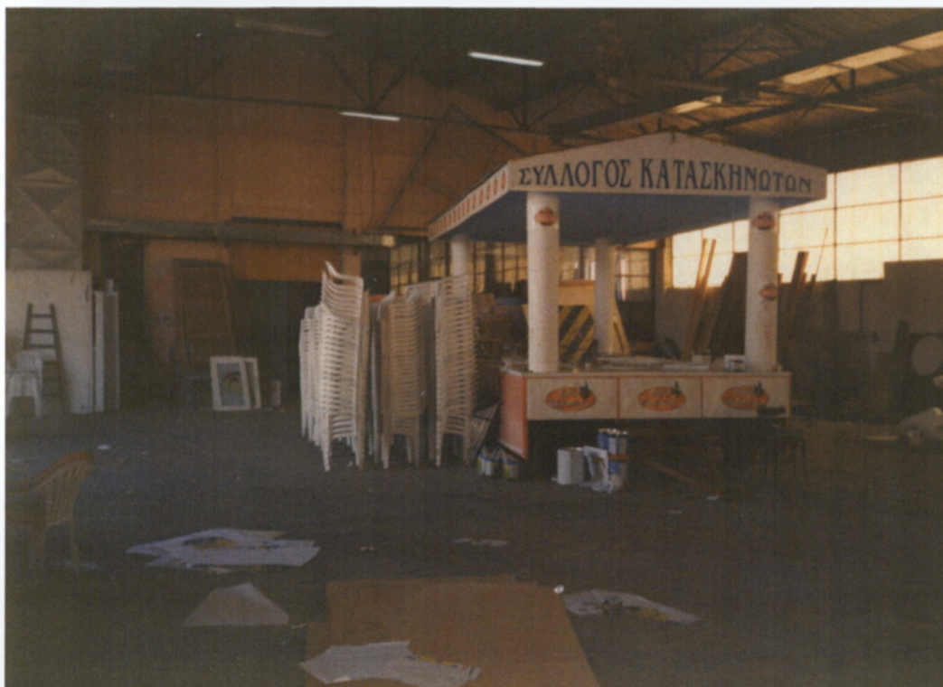
Αποψη του εργαστηρίου του Δήμου στο οποίο γίνεται η κατασκευή των αρμάτων της παρέλασης

το πώς θα είναι. Για την κατασκευή τους εργάζονται με πολύ μεράκι και όρεξη πολλοί Ξανθιώτες κυρίως γλύπτες, ζωγράφοι και άλλοι καλλιτέχνες οι οποίοι με αυτό τον τρόπο θέλουν να έχουν τη δική τους συμβολή στη συνέχιση και ανάπτυξη του θεσμού. Η χρηματοδότηση της κατασκευής τους γίνεται αποκλειστικά από το Δήμο της Ξάνθης.