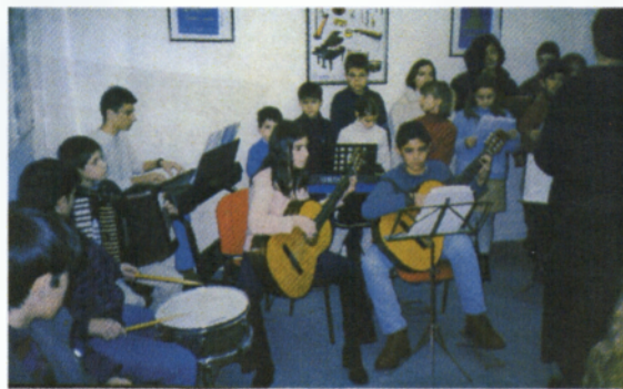
Χορωδιακή Βραδιά από το μουσικό γυμνάσιο της Ξάνθης κατά τη διάρκεια των Γιορτών Νεολαίας

Οι γιορτές αυτές γίνονται από 3 Μαΐου έως 12 Ιουνίου κάθε χρόνο, και περιλαμβάνουν πολλές και διάφορες εκδηλώσεις. Περιλαμβάνουν μουσικούς αγώνες, βραβεύσεις μαθητών μετά από διαγωνισμούς της καλύτερης έκθεσης σε διάφορα θέματα, εκθέσεις ζωγραφικής, παραδοσιακούς χορούς απ' τα νεανικά τμήματα των πολιτιστικών συλλόγων της Ξάνθης, καθώς επίσης και διαγωνισμούς DJs για νέους που αγαπούν τη μουσική. Επίσης διεξάγονται χορωδιακές βραδιές από διάφορες νεανικές χορωδίες της πόλης αλλά και άλλων πόλεων, θεατρικές παραστάσεις, συναυλίες μαθητών από μουσικά γυμνάσια. Παρουσιάζονται ακόμα περιβαλλοντικά προγράμματα από μαθητές της Β/θμιας εκπαίδευσης, και γίνονται ημερίδες με διάφορα θέματα. Διοργανώνονται τουρνουά σε διάφορα αθλήματα όπως κολύμβηση, ποδόσφαιρο και ποδηλασία.