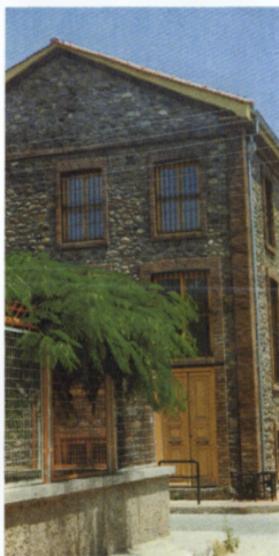
Εικόνα 1: Το κτίριο της Ακαδημίας Θρακικής Τέχνης και Παράδοσης όπου γίνονται διάφορες εκθέσεις στη διάρκεια των Θ.Λ.Γ.

Η αυλαία άνοιξε την 1 η μέρα με την έκθεση παραδοσιακής φορεσιάς της ορεινής Θράκης, όπου παρουσιάστηκαν φορεσιές και αντικείμενα από τα χωριά της ορεινής Θράκης, στοιχεία τα οποία προσδιορίζουν την παράδοση των κατοίκων της ορεινής περιοχής. Επίσης συγκροτήματα από την ορεινή περιοχή και συγκεκριμένα από το χωριό Γλαύκη, έπαιξαν παραδοσιακή μουσική ενώ παράλληλα σερβίρονται εδέσματα από την παραδοσιακή κουζίνα της Ορεινής Περιοχής της Θράκης. Η έκθεση αυτή λειτούργησε καθ' όλη την διάρκεια των Θ.Λ.Ε. στην αίθουσα «Λίλιαν Βιδούρη» από τις 10:00 έως τις 14:00 και από τις 19:00 έως τις 21:00, και συνδιοργανωτές της ήταν η Φιλοπρόοδη Ένωση Ξάνθης, Το Λύκειο Ελληνίδων, Ν. Ξάνθης και η Ακαδημία Θρακικής Τέχνης και Παράδοσης.