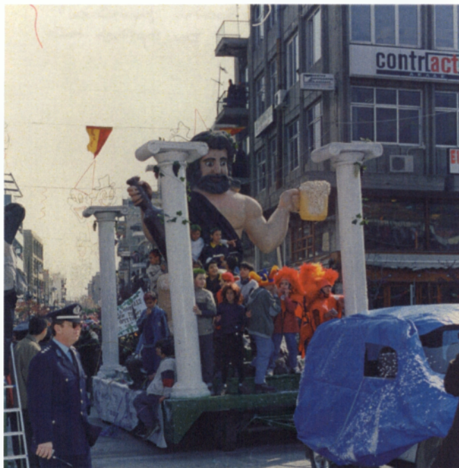
Το άρμα του Βασιλιά Καρνάβαλου ξεκινά πάντα πρώτο την παρέλαση κάθε χρόνο

Την αυλαία άνοιξε το άρμα του Ξανθιώτη Καρνάβαλου που ξεκίνησε την παρέλαση.