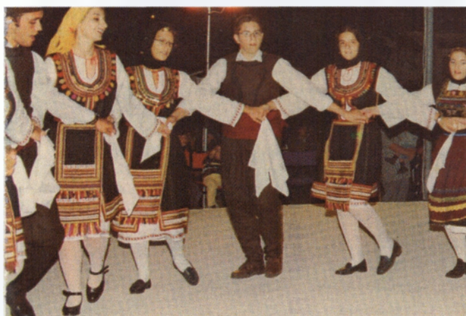
Παραδοσιακοί Θρακιώτικοι Χοροί κατά τη διάρκεια των Θρακικών Λαογραφικών Γιορτών στην κεντρική πλατεία της Ξάνθης.

Το πρόγραμμα των γιορτών περιλαμβάνει θεατρικές παραστάσεις, μουσικές εκδηλώσεις, εκθέσεις ζωγράφων, αιογράφων, γλυπτών αλλά και παλιών αντικειμένων, αυτοκινήτων καθώς επίσης και παρουσιάσεις ποιητών, συγγραφέων, ταινιών. Επίσης γίνονται συναυλίες από γνωστούς καλλιτέχνες, ημερίδες με διάφορα θέματα, ποδηλατικοί γύροι της πόλης, παραστάσεις θεάτρου σκιών για του μικρούς. Τέλος διοργανώνονται και βραδιές Λαογραφίας με τη συμμετοχή των χορευτικών συγκροτημάτων του Νομού Ξάνθης, καθώς επίσης και πανελλήνιες συγκεντρώσεις μοτοσυκλετιστών και δεξιότητες οδηγών αυτοκινήτων.