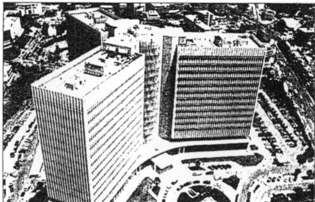
Η διοίκηση του Ο- ΤΕ αναμένει για το σύνολο της χρονιάς πορεία ανάλογη του εξαμήνου, με τη μη- τρική εταιρεία να παρουσιάζει και φέτος ζημιά, ενώ δεν προβλέπεται η διανομή μερίσμα- τος και για την τρέ- χουσα χρήση

Την ερχόμενη εβδομάδα θα πραγματοποιηθούν τέσσερα διοι- κητικά συμβούλια στο Βουκουρέ- στι (ΟΤΕ, Cosmote, Romtelecom, Cosmocom) προκειμένου να εξετα- στούν τα εν εξελίξει θέματα στη Ρουμανία. Μεταξύ εκάτων που θα εξεταστούν είναι η επαναδραστη- ριοποίηση της Cosmocom, η οποία προγραμματίζεται μέχρι το τέλος του χρόνου και η εισαγωγή της Romtelecom στο χρηματιστήριο μέ- σα στο πρώτο εξάμηνο του 2006.