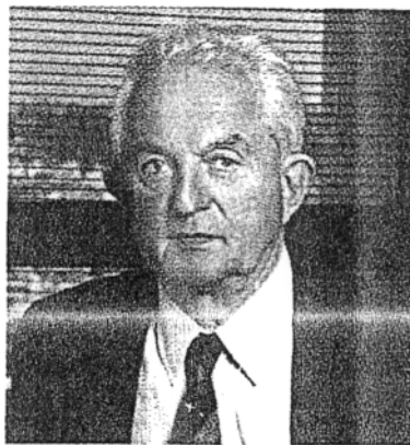
Ο διευθύνων σύμβουλος του ΟΤΕ, Π. Βουρλούμης.

ΜΗΣΗ είναι πως το επόμενο βήμα ποίησης του Οργανισμού θα περνάει την είσοδο στο μετοχικό του πιο μεγάλου ξένου οργανισμού τηλεφωνιών, κάτι όμως που, για να ισοποιηθεί, χρειάζεται προηγουμένως αλλαγή η νομοθεσία για το ποσοστό Δημοσίου (δεν μπορεί να μειωθεί από το 33%). Αν και προς το παρόν συζητήσιμη σχετικά με την περαιωτική ιδιωτικοποίηση του ΟΤΕ έχει κοινό όλο θέμα αναμένεται να ανοίξει θανάτιστα, όταν ολοκληρωθεί η αλλαγή που βρίσκεται σε εξέλιξη την προϋπόθεση βεβαίως ότι το ευνοϊκό συνθήκες στην τηλεπικοινωνία αγορά παγκοσμίως. Είναι χαρακτηριστικό ότι ο πρόεδρος και διευθύν