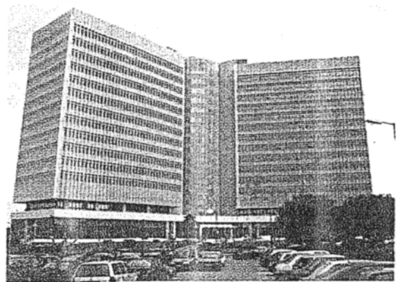
Ενδιαφέρ- τηλεπικοινωνιακό της Σερβίας αναμένεται να εκδηλώσει ο ΟΤΕ.