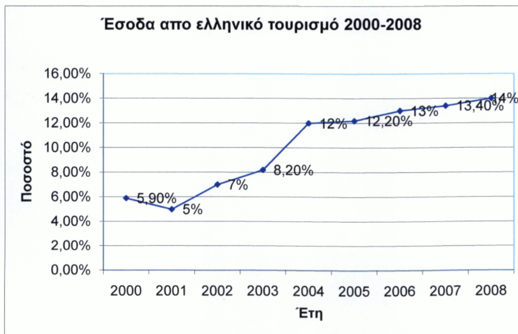
Διάγραμμα 3-1 Έσοδα ελληνικού τουρισμού 2000- 2008

Στο διάγραμμα που ακολουθεί παρουσιάζονται τα έσοδα που πραγματοποίησε ο ελληνικός τουρισμός για την περίοδο 2000- 2008. Από τον πίνακα παρατηρούμε ότι τα έσοδα από τον τουρισμό παρουσιάζουν συνεχή αύξηση γεγονός που καταδεικνύει την σημαντική συμβολή του τουρισμού στην οικονομία.