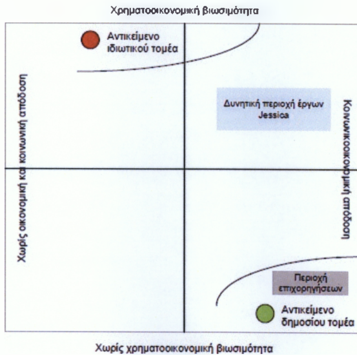
Διάγραμμα 4 Βιωσιμότητα έργων JESSICA