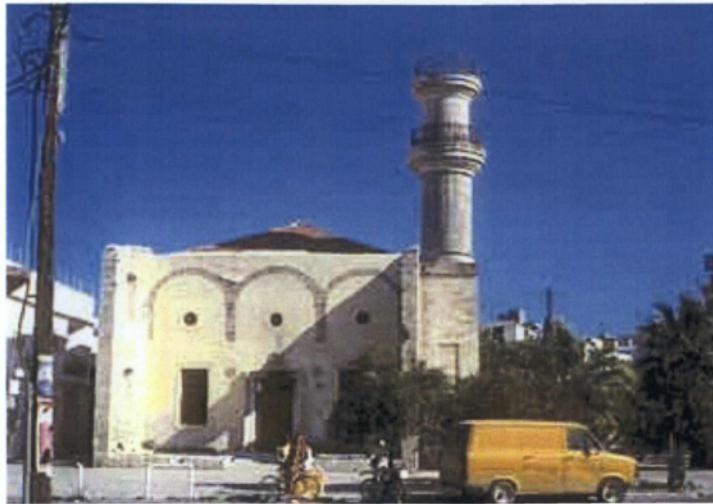
Εικόνα 9. Το Τζαμί της Ιεράπετρας.

Στην πλατεία Κανουπάκη, όπου βρίσκεται και το Δημαρχείο, υπάρχει ένα στενόμακρο κτίριο, γνωστό σαν Οθωμανική Σχολή ή Μεχτέπι (Εικόνα 11). Έγινε το 1899 μετά την απελευθέρωση, για τα Τουρκόπουλα (Παπαδάκης, 2000). Κατά καιρούς εγκαταστάθηκε εκεί η Οικοκυρική Σχολή, η Φιλαρμονική και χρησιμοποιήθηκε για αποθήκη αρχαίων. Σήμερα, έχει αναστηλωθεί και στεγάζει την Αρχαιολογική Συλλογή. Το κτίριο χρησιμοποιείται σαν Μουσείο, και αποτελείται από δύο αίθουσες και ένα ενδιάμεσο χολ. Στη μία αίθουσα εκτίθενται τα κεραμικά και τα μικροευρήματα, από την Πρωτομινωική ως την Ρωμαϊκή εποχή, κυρίως από τη Βασιλική και τα Γουρνιά και στην άλλη τα γλυπτά. Το εσωτερικό του οικήματος έχει παραδοσιακή ομορφιά. Είναι ιδιοκτησία του Δήμου Ιεράπετρας.