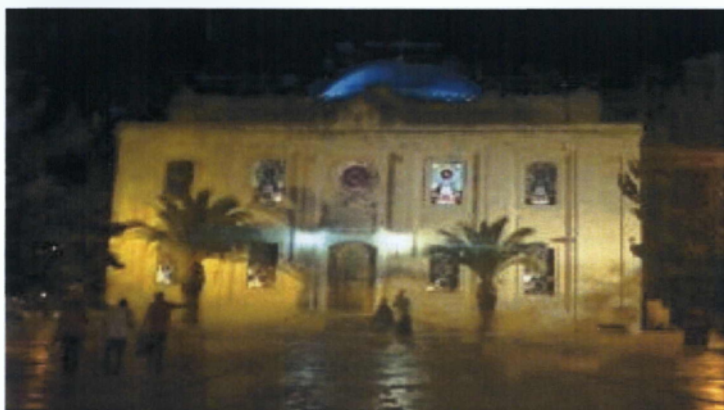
Εικόνα 6. Η Επισκοπή της Ιεράπετρας.

Σημαντικότερο ρόλο στη διατήρηση του εθνικοχριστιανικού φρονήματος των κατοίκων της περιοχής στα χρόνια της εθνικής υποδούλωσης από τους Ενετούς και τους Τούρκους, διαδραμάτισε η ιστορική Επισκοπή της Ιεράπυτνας (Εικόνα 6), της οποίας η ίδρυση ανάγεται στον 1ο μ.Χ. αιώνα. Πιστεύεται ότι ιδρυτής της ήταν ο Απόστολος Τίτος, μαθητής του κορυφαίου των Αποστόλων, του Παύλου. Ο Τίτος θεωρείτο Κρητικός και γύρω στα 65-70 μ.Χ. εδραίωσε το Χριστιανισμό στην Κρήτη, αφού χειροτονήθηκε πρώτος Επίσκοπος Κρήτης (Παπαδάκης.,2000).