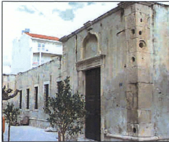
Εικόνα 11. Το Μεχτέπι της Ιεράπετρας.

Αξίζει επίσης να αναφερθεί και το ακατοίκητο νησάκι Γαΐδουρονήσι, που βρίσκεται στο Λιβυκό Πέλαγος, σε απόσταση περίπου 8 μιλίων από την Ιεράπετρα. Έχει μέγιστο μήκος 5 χλμ. και μέσο πλάτος 1 χλμ. Είναι γνωστό και ως Χρυσή. Η ονομασία αυτή δόθηκε από το χρυσαφί αντιφέγγισμα των κρυστάλλινων νερών της, που σε συνδυασμό με τους πρασινόξανθους κέδρους δημιουργείται ένα καθαρά αφρικάνικο τοπίο. Οι παραλίες της είναι σκεπασμένες με χρυσή άμμο και μια πληθώρα κογχυλίων. Η μοναδική ανθρώπινη παρέμβαση σ' αυτό το νησάκι είναι το εκκλησάκι του Αγίου Νικολάου, οι λαξευτοί τάφοι της Ρωμαϊκής περιόδου, ο αρχαίος λιμενοβραχίονας, ο φάρος και το μοναδικό σπίτι του νησιού (Εικόνα 13).