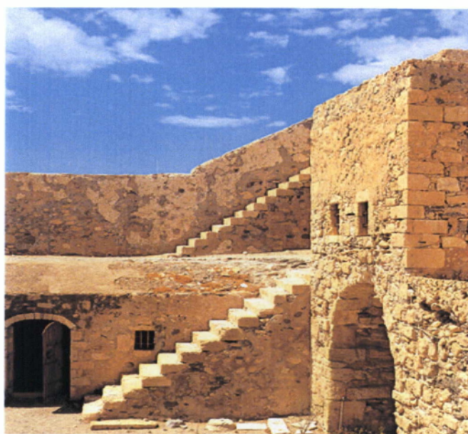
Εικόνα 8. Το εσωτερικό του φρουρίου της Ιεράπετρας.

Το Τζαμί που υπάρχει σήμερα στην παλιά πόλη κτίστηκε στα τέλη του περασμένου αιώνα, ενώ οι Τούρκοι για τις θρησκευτικές τους ανάγκες είχαν μετατρέψει σε τζαμί τον Άγιο Ιωάννη (Εικόνα 9). Διατηρείται μέχρι σήμερα σε αρκετά καλή κατάσταση. Ο μιναρές του επισκευάστηκε γύρω στα 1953 και έχει μία μουσουλμανική επιγραφή από το Κοράνιο στο μαρμάρινο ανώφλι της εισόδου (Παπαδάκης, 2000). Εκεί στεγάζεται η Δημοτική Φιλαρμονική, ενώ χρησιμεύει και ως χώρος καλλιτεχνικών εκδηλώσεων. Απέναντι υπάρχει η μουσουλμανική βρύση, που έχει αναστηλωθεί (Εικόνα 10).