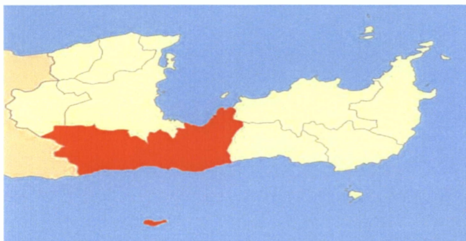
Εικόνα 2. Η απεικόνιση του Δήμου Ιεράπετρας στο χάρτη.

αγράμματων και αυτών που δεν έχουν τελειώσει την Στοιχειώδη εκπαίδευση, μειώθηκαν θεαματικά κατά την τελευταία δεκαετία, ενώ κατά το ίδιο χρονικό διάστημα αυξήθηκαν τα ποσοστά των Απόφοιτων της Γ΄ τάξης του Γυμνασίου και της Μέσης Εκπαίδευσης. Το ίδιο διάστημα επταπλασιάστηκαν περίπου οι πτυχιούχοι Ανώτερων Σχολών και υπερδιπλασιάστηκαν οι πτυχιούχοι Α.Τ.Ε.Ι (ΚΑΤΕ-ΚΑΤΕΕ). Οι πτυχιούχοι Ανώτατων Σχολών καθώς και οι κάτοχοι μεταπτυχιακών αυξήθηκαν, τόσο σε απόλυτες τιμές όσο και σαν ποσοστό στο σύνολο του πληθυσμού του Δήμου.