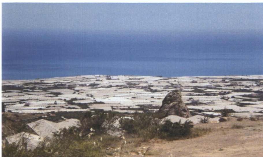
Εικόνα 4. Οι μεγάλες εκτάσεις θερμοκηπίων στην περιοχή του Ξερόκαμπου.

γεωργίας δραστηριοποιούνται 7.000 περίπου εκμεταλλεύσεις και στον κλάδο του εμπορίου 1.200 περίπου.