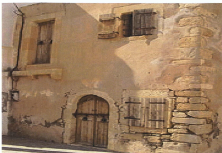
Εικόνα 5. Το σπίτι που φιλοξένησε τον Ναπολέον Βοναπάρτη.

Σημαντικότερο ρόλο στη διατήρηση του εθνικοχριστιανικού φρονήματος των κατοίκων της περιοχής στα χρόνια της εθνικής υποδούλωσης από τους Ενετούς και τους Τούρκους, διαδραμάτισε η ιστορική Επισκοπή της Ιεράπυτνας (Εικόνα 6), της οποίας η ίδρυση ανάγεται στον 1ο μ.Χ. αιώνα. Πιστεύεται ότι ιδρυτής της ήταν ο Απόστολος Τίτος, μαθητής του κορυφαίου των Αποστόλων, του Παύλου. Ο Τίτος θεωρείτο Κρητικός και γύρω στα 65-70 μ.Χ. εδραίωσε το Χριστιανισμό στην Κρήτη, αφού χειροτονήθηκε πρώτος Επίσκοπος Κρήτης (Παπαδάκης.,2000).