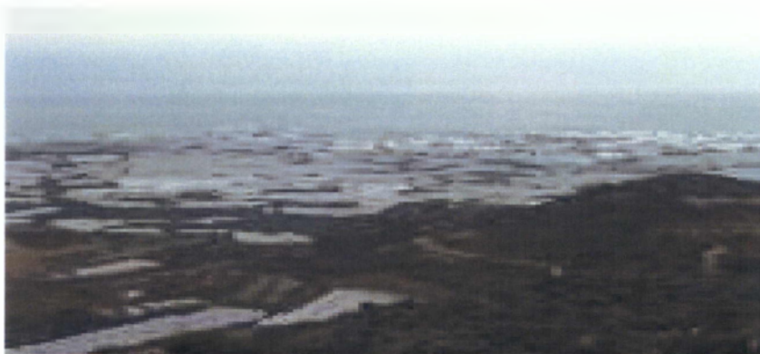
Εικόνα 3. Οι μεγάλες εκτάσεις θερμοκηπίων στη Γρα Λυγιά.

Στην ευρύτερη περιοχή της Ιεράπετρας και ιδιαίτερα στην περιοχή της Γρα Λυγιάς (Εικόνα 3) και του Ξερόκαμπου (Εικόνα 4), καλύπτεται με θερμοκήπια μια έκταση πάνω από 8.000 στρέμματα με ετήσια απόδοση παραγωγής πάνω από 120.000 τόνους. Τα πρώτα χρόνια καλλιεργούνταν μόνο αγγούρια, αλλά σήμερα παράγονται επίσης τομάτες, μελιτζάνες, φασόλια, πιπεριές, κολοκύθια, καρπούζια και πεπόνια. Η αποπεράτωση του φράγματος των Μπραμιανών έδωσε άφθονο και καλό νερό, το οποίο με μόνιμα δίκτυα αρδεύει 22.000 στρέμματα, ενώ με την υδρομάστευση των νερών της Μαλαύρας θα ποτιστούν άλλα 50.000 στρέμματα.