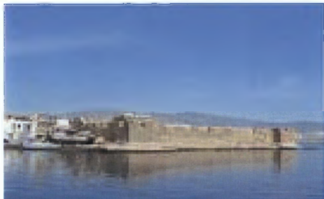
Εικόνα 7. Η εξωτερική πλευρά του φρουρίου.

δύσκολες για το Έθνος μας εποχές. Την προστασία του έχει αναλάβει το Κράτος, που το συντηρεί και έχει αρχίσει αναστηλωτικές εργασίες, για να αποκαταστήσει πιο γνήσια το εσωτερικό του (Εικόνα 8).