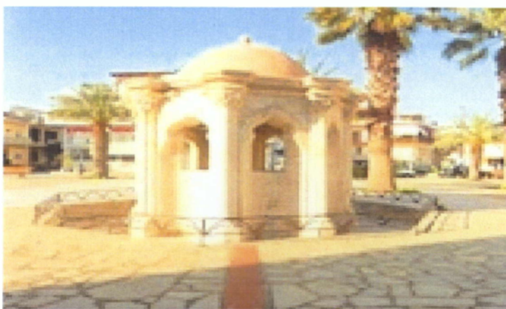
Εικόνα 10. Η μουσουλμανική βρύση μπροστά από το Τζαμί

Στην πλατεία Κανουπάκη, όπου βρίσκεται και το Δημαρχείο, υπάρχει ένα στενόμακρο κτίριο, γνωστό σαν Οθωμανική Σχολή ή Μεχτέπι (Εικόνα 11). Έγινε το 1899 μετά την απελευθέρωση, για τα Τουρκόπουλα (Παπαδάκης, 2000). Κατά καιρούς εγκαταστάθηκε εκεί η Οικοκυρική Σχολή, η Φιλαρμονική και χρησιμοποιήθηκε για αποθήκη αρχαίων. Σήμερα, έχει αναστηλωθεί και στεγάζει την Αρχαιολογική Συλλογή. Το κτίριο χρησιμοποιείται σαν Μουσείο, και αποτελείται από δύο αίθουσες και ένα ενδιάμεσο χολ. Στη μία αίθουσα εκτίθενται τα κεραμικά και τα μικροευρήματα, από την Πρωτομινωική ως την Ρωμαϊκή εποχή, κυρίως από τη Βασιλική και τα Γουρνιά και στην άλλη τα γλυπτά. Το εσωτερικό του οικήματος έχει παραδοσιακή ομορφιά. Είναι ιδιοκτησία του Δήμου Ιεράπετρας.