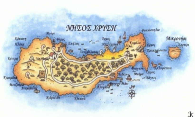
Εικόνα 13. Ο χάρτης της Χρυσής

Αξίζει επίσης να αναφερθεί και το ακατοίκητο νησάκι Γαΐδουρονήσι, που βρίσκεται στο Λιβυκό Πέλαγος, σε απόσταση περίπου 8 μιλίων από την Ιεράπετρα. Έχει μέγιστο μήκος 5 χλμ. και μέσο πλάτος 1 χλμ. Είναι γνωστό και ως Χρυσή. Η ονομασία αυτή δόθηκε από το χρυσαφί αντιφέγγισμα των κρυστάλλινων νερών της, που σε συνδυασμό με τους πρασινόξανθους κέδρους δημιουργείται ένα καθαρά αφρικάνικο τοπίο. Οι παραλίες της είναι σκεπασμένες με χρυσή άμμο και μια πληθώρα κογχυλίων. Η μοναδική ανθρώπινη παρέμβαση σ' αυτό το νησάκι είναι το εκκλησάκι του Αγίου Νικολάου, οι λαξευτοί τάφοι της Ρωμαϊκής περιόδου, ο αρχαίος λιμενοβραχίονας, ο φάρος και το μοναδικό σπίτι του νησιού (Εικόνα 13).