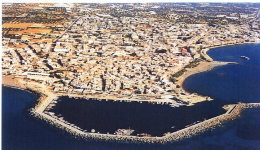
Εικόνα 1. Η αεροφωτογραφία της Ιεράπετρας

Η πιο νοτιοανατολική παραθαλάσσια περιοχή της Κρήτης, η οποία είναι σταυροδρόμι τριών ηπείρων και πέντε θαλασσών, και η νοτιότερη πόλη της Ευρώπης, η Ιεράπετρα (Εικόνα 1), που απλώνεται νοητικά στ' αγκάλιασμα του ανοιχτού πελάγου, γνώρισε μεγάλη άνθηση κατά την περίοδο της Αραβοκρατίας, της Ενετοκρατίας και της Τουρκοκρατίας, αφού έχει μια από τις πιο στρατηγικές θέσεις στην Ευρώπη. Συνδυάζει ένα ένδοξο παρελθόν με μια σημερινή μεγάλη πληθυσμιακή και οικονομική εξέλιξη, αποτελώντας έτσι ένα σημαντικό πόλο έλξης για την προσέλκυση του ντόπιου πληθυσμού από το ένα μέρος και του ξένου επισκέπτη από το άλλο, αφού βρίσκεται σ' αυτήν ένα θαυμάσιο συνδυασμό ενδιαφερόντων και ηρεμίας.