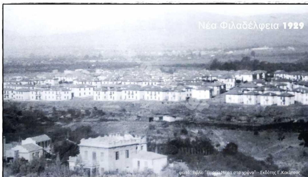
Εικόνα 1: Νέα Φιλαδέλφεια έτος 1929

Η περιοχή κατοικήθηκε μαζικά για πρώτη φορά την περίοδο 1922-1928 από πρόσφυγες της Μικράς Ασίας. Στη συνέχεια τη δεκαετία του '50 και έπειτα δέχθηκε μεγάλο κύμα εσωτερικής μετανάστευσης. Από τη δεκαετία του '80 και '90 ξεκίνησε η εγκατάσταση στο δήμο προσφύγων και μεταναστών από άλλες χώρες.