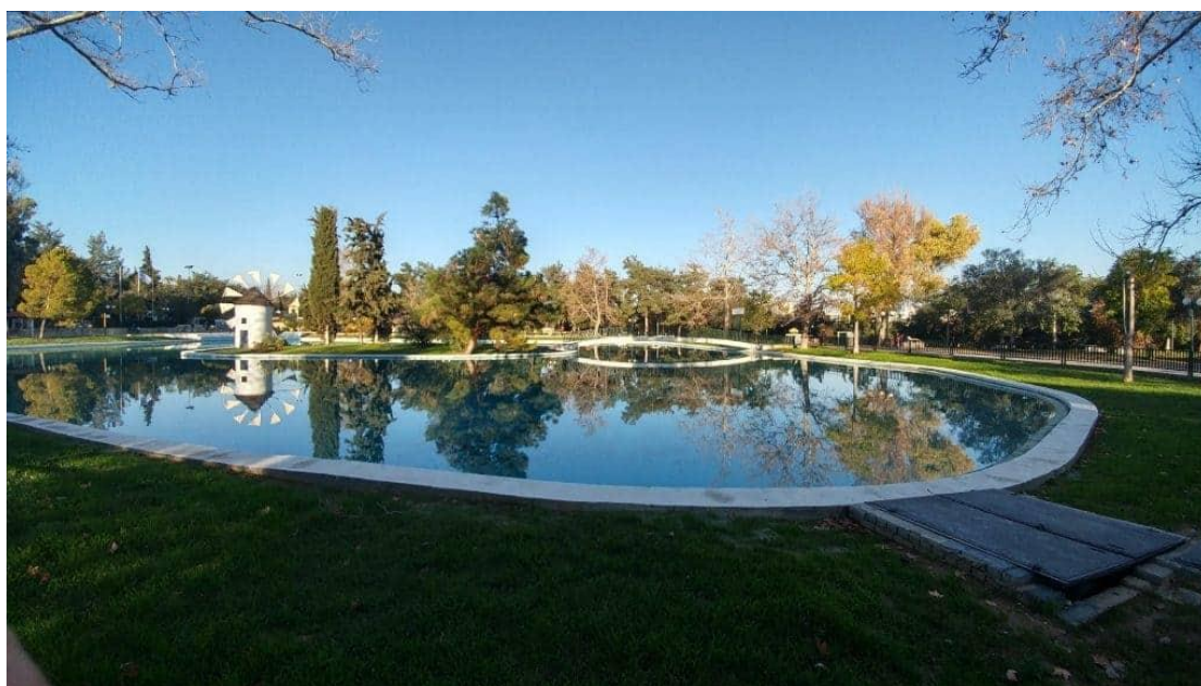
Εικόνα 2: Άλσος Νέας Φιλαδέλφειας

Η περιοχή έχει αρκετό πράσινο (περίπου 25%), στο οποίο συμβάλλουν τα πάρκα που έχει η περιοχή και το Άλσος της Νέας Φιλαδέλφειας το οποίο κατέχει κομβική θέση στον ευρύτερη περιοχή.