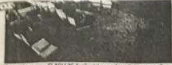
Αεροπλανία του FLASH 96. Έγινε από το αεροδρόμιο ακουμπώντας το αεροπλάνο πάνω στον έρμα δεν έχουμε παρά να βορράκιμα.