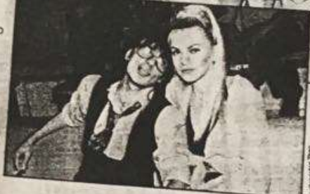
Στο σταί καταφέ, Ελένη Φ χαροκρ στοχεία