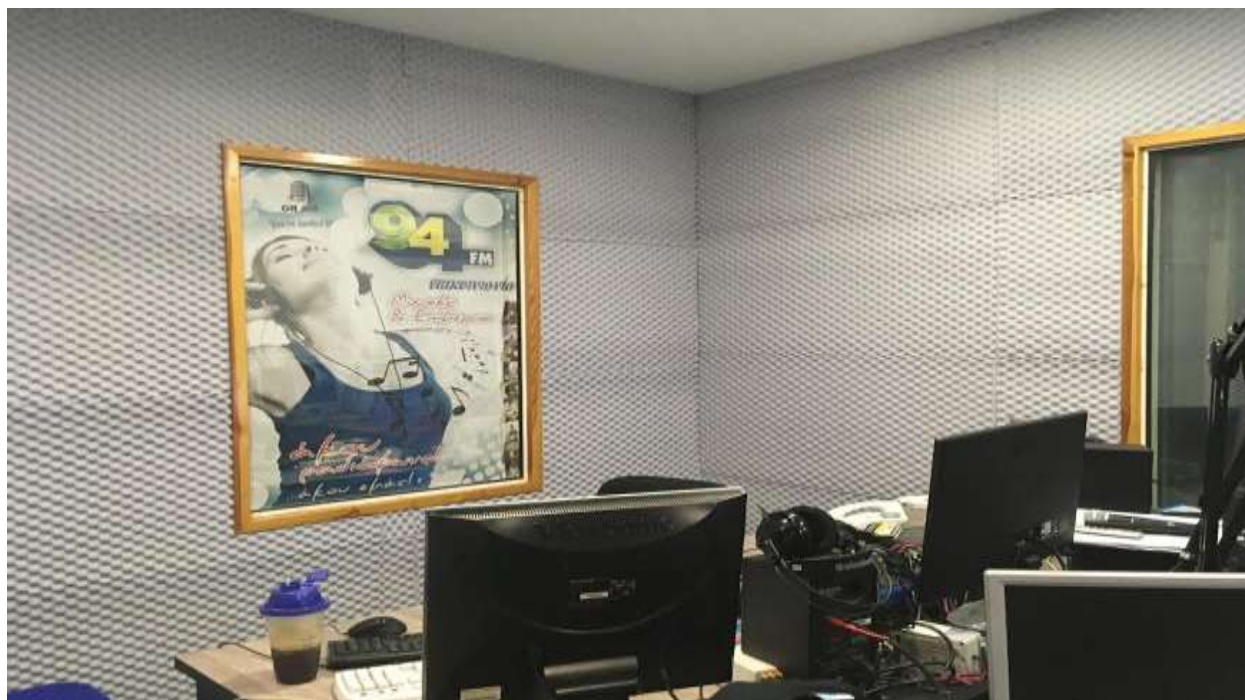
Εικόνα 1: Αίθουσα παραγωγής του δημοτικού ραδιοφωνικού σταθμού «Επικοινωνία 94fm».

«Κανάλι 1» του Πειραιά, ο «Διάυλος 10» των δυτικών προαστίων, ο «Τik-Tak» στα ανατολικά προάστια, ο «Ραδιόφωνο 5» των προάστειων του Πειραιά, ο «Επικοινωνία fm» του Νέου Ηρακλείου Αττικής, ο "Ράδιο ΚΥΚΛΟΣ" των βορειοανατολικών προαστίων και ο «Ξένιος» των Άνω Λιοσίων.