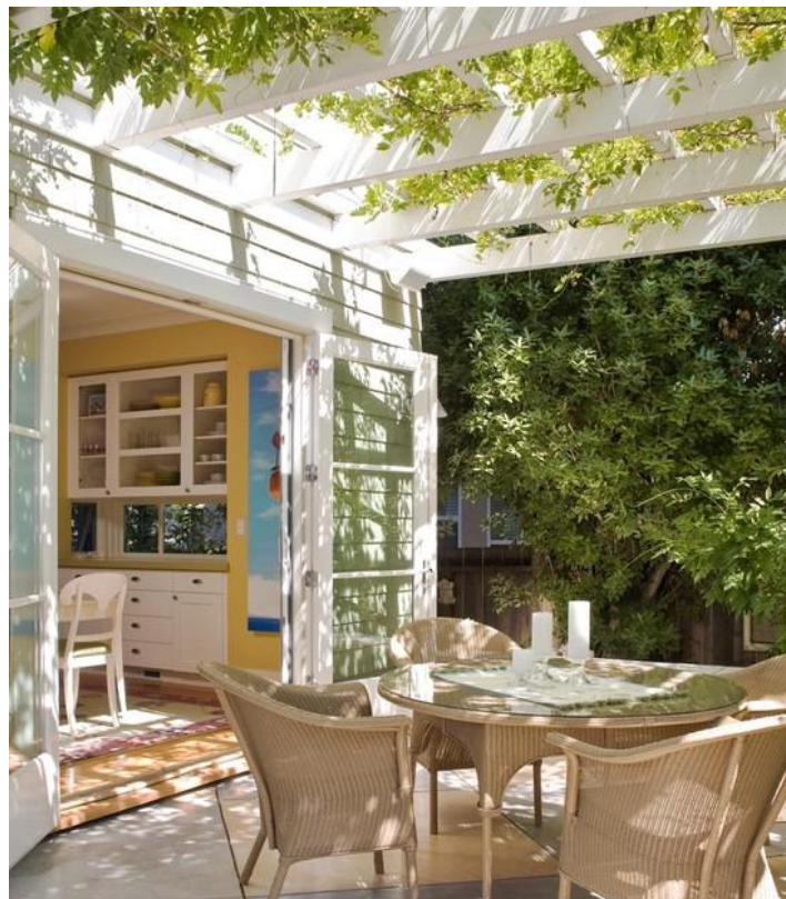
Εικόνα 4.13: Βεράντα με πέργκολα για την ανάπτυξη αναρριχητικού φυτού -70- και την σκίαση του χώρου.