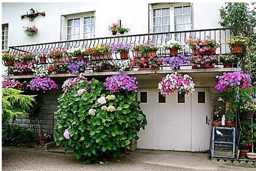
Εικόνα 1.1: Διακόσμηση μικρού μπαλκονιού σε ρομαντικό ύφος.

❖ Μινιμαλιστικό, που χαρακτηρίζεται από απλότητα και λιτότητα των στοιχείων μέσα στο χώρο. Τα στοιχεία τοποθετούνται με τέτοιο τρόπο ώστε να αντανακλώνται τα χρώματα και οι γραμμές τους χωρίς να δημιουργείται σύγχυση αυτών. Σε έναν τέτοιο χώρο πρέπει να αποφεύγεται η υπερβολή και η πολυχρωμία (Τσαλικίδης, 2008).