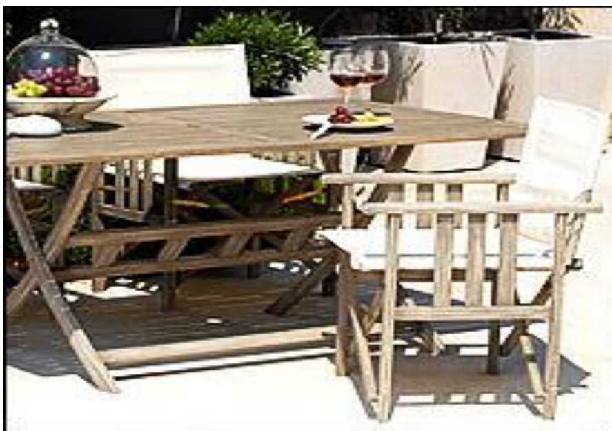
Εικόνα 1.3: Έπιπλα διακόσμησης μπαλκονιού από ξύλο.