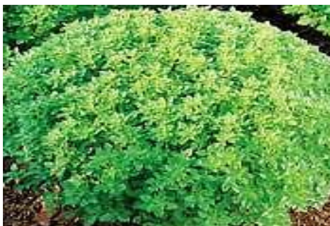
Εικόνα 2.1: Βασιλικός.

Φυτό ποώδες μονοετές καλλωπιστικό, το οποίο είναι πολύ δημοφιλές στην Ελλάδα με φύλλα ελλειπτικά και ωοειδή και άνθη άσπρα που σχηματίζουν στάχτες στις κορφές των βλαστών. Υπάρχουν δεκάδες ποικιλίες με διαφορές στο μέγεθος και στο χρώμα του φυλλώματος (εικόνα 2.1).