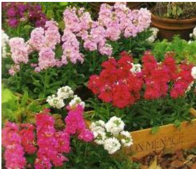
Εικόνα 2.13: Βιολέτες (πηγή: http://www.iliapress.gr ).

Είναι μονοετή ή πολυετή ποώδη φυτά ή σπάνια μικροί θάμνοι. Τα φύλλα είναι συνήθως απλά, έχουν πάντα παράφυλλα και αναπτύσσονται κατ'εναλλαγή στα είδη με βλαστό ή είναι παράρριζα στα είδη χωρίς βλαστό. Τα άνθη είναι ασύμμετρα και το σχήμα των πετάλων καθορίζει την ποικιλία στην οποία ανήκουν, ενώ το χρώμα τους επίσης διαφοροποιείται. Άλλοτε είναι βιολετί, όπως υποδεικνύει το όνομά τους, άλλοτε μπλε, κίτρινο, λευκό, ζαχαρί ή και δίχρωμο, συνήθως μπλε και κίτρινο (εικόνα 2.13) (Κανταρτζής, 1991).