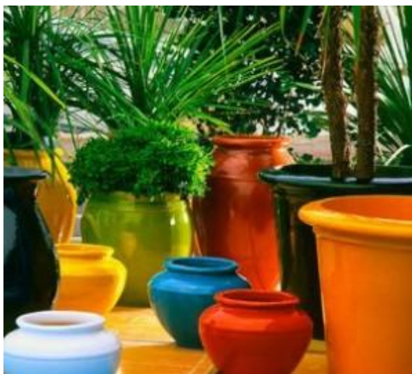
Εικόνα 3.4: Φυτοδοχεία πηλινες σε διάφορα χρώματα, σχήματα και μεγέθη.

Υπάρχουν πολλές προτάσεις οι οποίες εξυπηρετούν ταυτόχρονα την καλή αισθητική και λειτουργικότητα του χώρου. Για παράδειγμα, εάν το ύφος της διακόσμησης τείνει να είναι αισιόδοξο και χαρούμενο προτείνεται να χρησιμοποιούνται πολύχρωμες φυτοδοχεία σε διάφορα σχήματα και σε διάφορα μεγέθη (εικόνα 3.4).