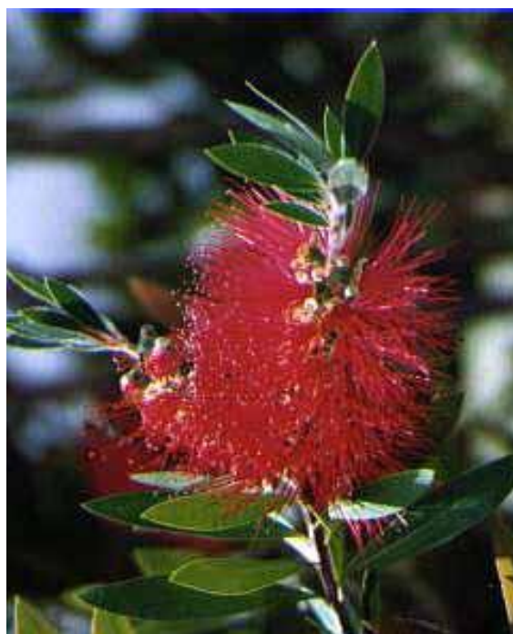
Εικόνα 2.22: Καλλιστήμων.

Ένα αυστραλέζικο λουλούδι με ελληνικό όνομα. Είναι ένα από τα πιο παράξενα λουλούδια και μάλλον αυτός είναι ο λόγος που είναι τόσο δημοφιλές σε όλο τον κόσμο. Τα άνθη του μοιάζουν με βούρτσες που καθαρίζουν μπουκάλια και στο εξωτερικό είναι διαδεδομένο με αυτό το όνομα (Bottlebrush) (εικόνα 2.22).