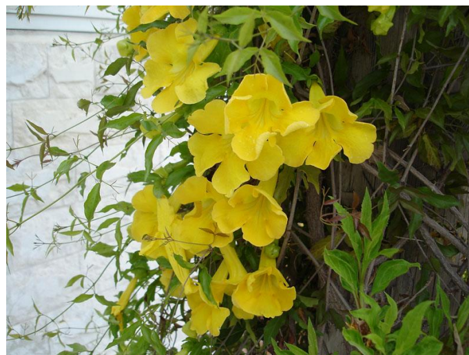
Εικόνα 2.40: Βιγκόνια (πηγή: http://www.gardenland.gr/full_product.php?prod_id=212 ).

Αειθαλές αυτοαναρριχώμενο φυτό, ταχείας ανάπτυξης με ύψος έως και 20-25 μέτρα. Τα άνθη της είναι μεγάλα, κίτρινου χρώματος που εμφανίζονται το Μάιο – Ιούνιο. Είναι ευαίσθητη στο κρύο ενώ οι εδαφικές απαιτήσεις δεν είναι μεγάλες. Μπορεί να καλλιεργηθεί σε φυτοδοχείο οι ζαρντινιέρες (εικόνα 2.40) (Κανταρτζής, 1999).