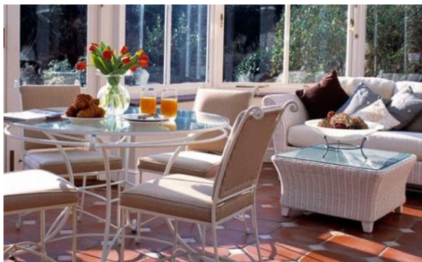
Εικόνα 3.3: Διαχωρισμός βεράντας σε καθιστικό και τραπεζαρία με την κατάλληλη επιλογή επίπλων.

Εάν η έκταση του χώρου το επιτρέπει τότε μπορεί η βεράντα ή το μπαλκόνι να διαιρεθεί σε τμήματα μέσω των επίπλων. Τα έπιπλα μπορούν να αποτελέσουν τα νοητά όρια μεταξύ μιας τραπεζαρίας και ενός καθιστικού (εικόνα 3.3).