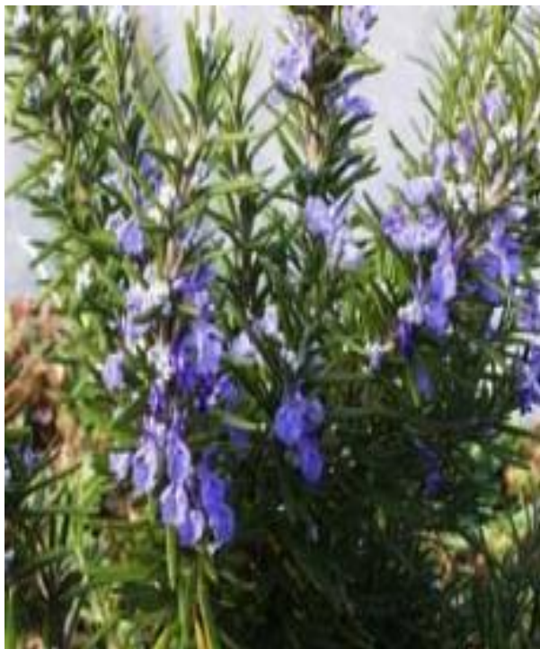
Εικόνα 2.6: Δενδρολίβανο.

γραμμωτά σαν βελόνες έλατου. Τα άνθη του βγαίνουν στις μασχάλες των φύλλων και είναι σε ανοιχτό γαλάζιο χρώμα και σπάνια λευκό (εικόνα 2.6).