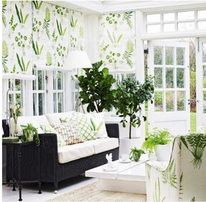
Εικόνα 4.10: Διακόσμηση του χώρου σε μινιμαλιστικό ύφος. Έχει επιλεγεί το λευκό ως κυρίαρχο χρώμα με ενσωματωμένες διαβαθμίσεις του πράσινου χρώματος στα διακοσμητικά είδη και το φυτικό υλικό. Το ύφος αυτό προσδίδει ισορροπία και ηρεμία στο χώρο.