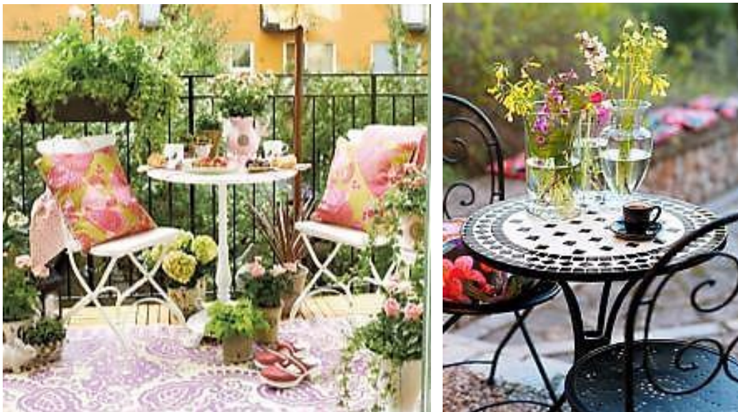
Εικόνα 1.4: Έπιπλα διακόσμησης μπαλκονιού από μέταλλο, σε λευκό και μαύρο χρώμα.