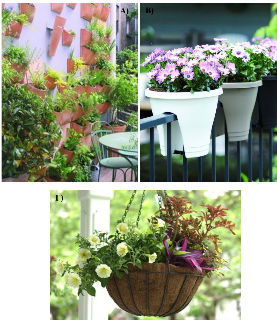
Εικόνα 3.5: Α) Επιτοίχιες φυτοδοχεία, Β) Φυτοδοχεία προσαρμοζόμενες στα κάγκελα του μπαλκονιού και Γ) Κρεμαστές φυτοδοχεία για την καλύτερη εξοικονόμηση χώρου.

φυτοδοχεία που προσαρμόζονται στα κάγκελα του μπαλκονιού ή της βεράντας (εικόνα 3.5β) αλλά και κρεμαστές φυτοδοχεία (εικόνα 3.5γ). Με τον τρόπο αυτό εξοικονομείται χώρος χωρίς να δεσμεύεται ο ιδιοκτήτης στον αριθμό των φυτών που θέλει να φυτέψει. Οι φυτοδοχεία αυτές είναι συνήθως πλαστικές ή πήλινες αλλά τα σχήματα και τα χρώματα ποικίλλουν ανάλογα με τα θέλω του κάθε ιδιοκτήτη.