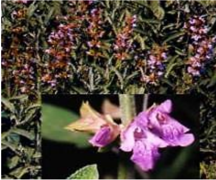
Εικόνα 2.8: Φασκόμηλο.

Οι Κινέζοι το ονομάζουν ελληνικό βραστάρι και το θεωρούν καλύτερο από το τσάι. Οι Γάλλοι το ονομάζουν ελληνικό τσάι και το χρησιμοποιούν όπως και οι υπόλοιποι Ευρωπαίοι όχι μόνο για φαρμακευτικούς αλλά και για μαγειρικούς σκοπούς. Στην αρχαιότητα οι πρόγονοί μας το χρησιμοποιούσαν σαν πολυφάρμακο και έχει εκθειαστεί από τον Ιπποκράτη, τον Διοσκουρίδη, τον Γαληνό και τον Αέτιο. Οι Λατίνοι το θεωρούσαν ιερό φυτό και το χρησιμοποιούσαν σε τελετές (Σκρουμπής, 1998).