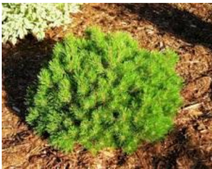
Εικόνα 2.18: Πεύκο νάνο.

Το νάνο πεύκο είναι ένα πανέμορφο χαμηλής και αργής ανάπτυξης μικρό πεύκο. Έχει πράσινο σκούρο φύλλωμα που αποτελείται από σκληρές βελόνες 2-3 ιντσών (εικόνα 2.18).