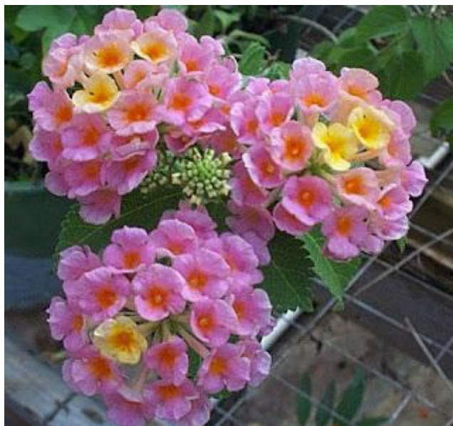
Εικόνα 2.20: Λαντάνα νάνα.

Η λαντάνα είναι ένας αειθαλής, πολυετής, γρήγορης ανάπτυξης θάμνος με πράσινα φύλλα και αγκαθωτά κλαδιά και ανήκει στην οικογένεια των Verbenaceae (εικόνα 2.20).