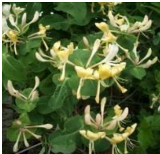
Εικόνα 2.34: Αγριόκλημα.