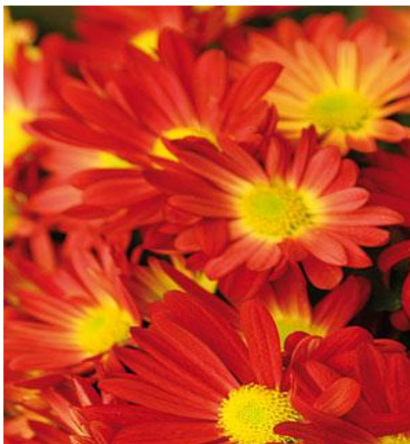
Εικόνα 2.10: Καμπανούλα.

Το χρυσάνθεμο είναι κατάλληλο φυτό για εσωτερικούς και εξωτερικούς χώρους. Χρειάζεται μέτριο φωτισμό και μέτριο πότισμα, ενώ είναι ανθεκτικό σε χαμηλές θερμοκρασίες, 5°C-20°C (Κανταρτζής, 1991).