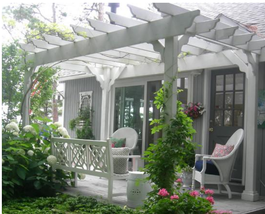
Εικόνα 3.6: Ξύλινη πέργκολα σε βεράντα με διακόσμηση αναρριχώμενων φυτών που θα προσφέρουν σκίαση στον χώρο.

Εάν το επιτρέπουν οι διαστάσεις του εξωτερικού χώρου τότε μπορούν να χρησιμοποιηθούν ψηλές ξύλινες κατασκευές σε διάφορα χρώματα και σχέδια ανάλογα με τις απαιτήσεις του ιδιοκτήτη (εικόνα 3.6).