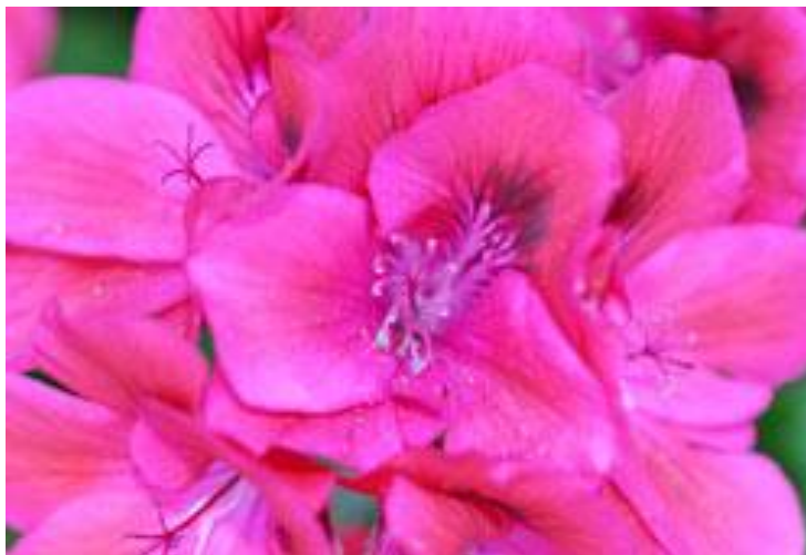
Εικόνα 2.11: Γεράνι (πηγή: http://www.gardenguide.gr/ ).

Τα άνθη τους εμφανίζουν μεγάλη ποικιλία χρωμάτων. Η ανθοφορία στο γεράνι έχει μεγάλη διάρκεια που μπορεί να φτάσει και τους 6 μήνες. Τα άνθη ανοίγουν από τις αρχές Μαΐου και μπορεί να παραμείνουν έντονα ανοιχτά μέχρι και το τέλος του φθινοπώρου.