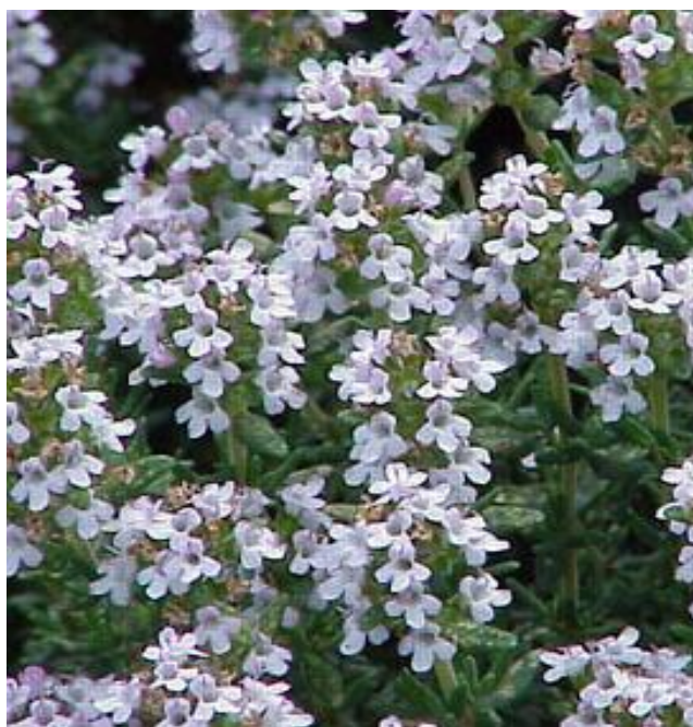
Εικόνα 2.3: Θυμάρι.

Θάμνος ποώδης πολυετής με φύλλα σχεδόν άμισχα, πράσινα, λογχοειδή με τα άκρα κουλουριασμένα προς τα κάτω. Άνθη ακραία σε χρώμα μπλε ανοικτό με ραβδωτό κάλυκα (εικόνα 2.3).