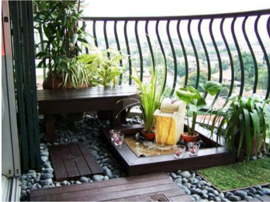
Εικόνα 3.8: Μπαλκόνι σε πολυκατοικία με συνδυασμό των στοιχείων του νερού, του ξύλου και των βότσαλων. Δημιουργούνται αντιθέσεις οι οποίες όμως εντείνουν το αίσθημα χαλάρωσης.