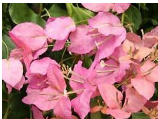
Εικόνα 2.35: Βουκαμβίλια.

Έχει εντυπωσιακά λεπτά λαμπερά φύλλα σε σχήμα καρδιάς με μωβ, κόκκινες, άσπρες, και πορτοκαλί αποχρώσεις. Η υφή τους είναι χάρτινη και με την πάροδο μερικών εβδομάδων πέφτουν και αντικαθίστανται με καινούργια. Ανθίζει από τα μέσα της άνοιξης έως και της αρχές του φθινοπώρου. Χρειάζεται ηλιόλουστα σημεία, αντέχει σε παραθαλάσσιες περιοχές αλλά θα πρέπει να προστατεύεται από τους ανέμους. Δεν αντέχει στον παγετό.