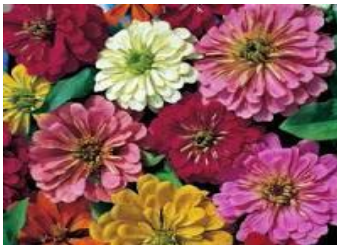
Εικόνα 2.14: Ζίννιες.

Οι ζίννιες ( Zinnia elegans , Compositae ) είναι ετήσια καλλωπιστικά ποώδη φυτά, που παραμένουν ανθισμένα καθόλη τη διάρκεια του καλοκαιριού. Έχει βλαστούς όρθιους, ισχυρούς και οξύληκτα, τραχεία, χωρίς μίσχο φύλλα. Τα άνθη της είναι πολύ μεγάλα με διάμετρο έως 15cm, με διάφορους χρωματισμούς (εικόνα 2.14).