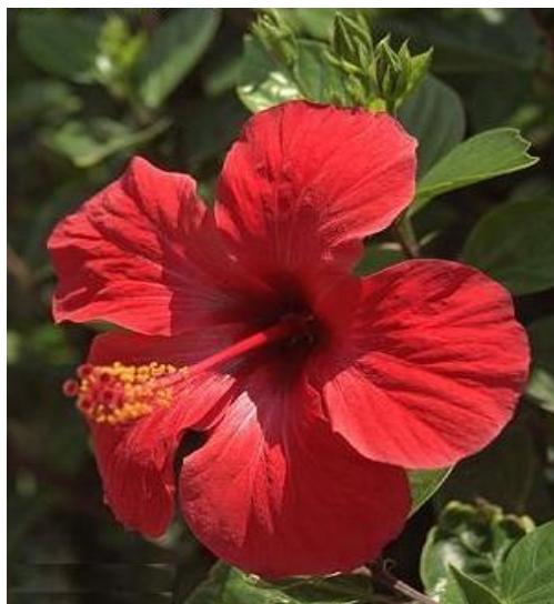
Εικόνα 2.19: Ιβίσκος.