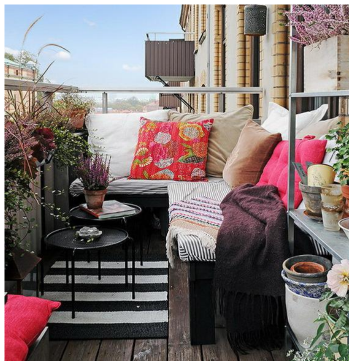
Εικόνα 4.3: Χρήση καναπέ για μεγαλύτερη άνεση και χαλάρωση με πολλά αρωματικά φυτά. Μια εναλλακτική πρόταση για ένα μικρό μπαλκόνι (πηγή: http://www.texnotropieskaidiakosmisi.com ).