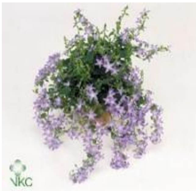
Εικόνα 2.9: Καμπανούλα.

Φυτό πολυετές με ισχυρό βλαστό και φύλλα δερματώδη, καρδιοειδή, πριονωτά. Τα κατώτερα φύλλα φέρουν μακρύ μίσχο ενώ τα ανώτερα είναι επιφυή (εικόνα 2.9).