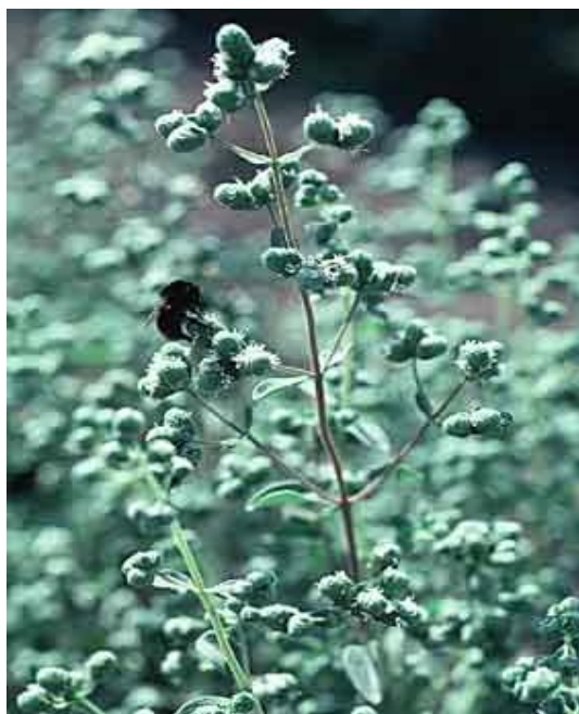
Εικόνα 2.5: Ματζουράνα.

Φυτό ποώδες με πολλές παραφυάδες, με φύλλα μικρά και μυρωδάτα. Αποτελεί συγγενικό είδος της ρίγανης. Τα άνθη της είναι φαιά με λέπια. Ανθίζει από Ιούλιο μέχρι Σεπτέμβριο (εικόνα 2.5).