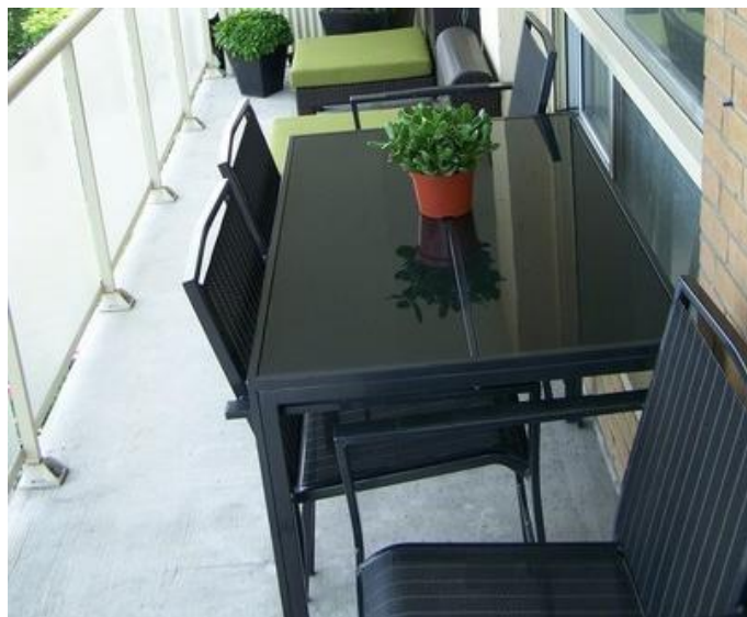
Εικόνα 3.2: Έπιπλα ξύλινα σε μαύρο χρώμα με αυστηρές γραμμές και γωνίες.

Ένας δεσμευτικός παράγοντας όσον αφορά την επιλογή επίπλων είναι η έκταση του μπαλκονιού ή του εξώστη, χωρίς αυτό να σημαίνει πως ένα μικρό μπαλκόνι δεν μπορεί να είναι κομψό και λειτουργικό ταυτόχρονα. Για το λόγο αυτό υπάρχουν