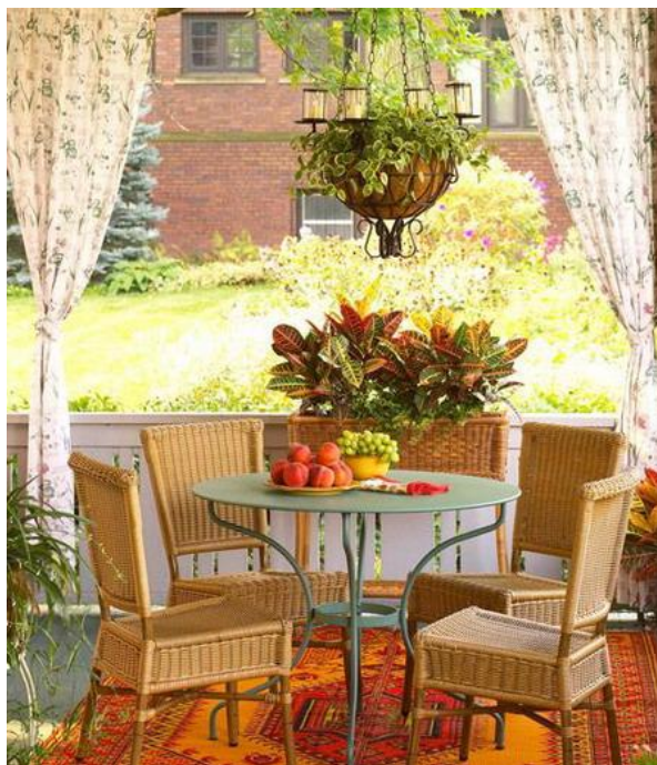
Εικόνα 4.9: Επιλογή χρωμάτων και φυτών σε εξοχικό ύφος με συνδυασμό του μεταλλικού με το ξύλινο στοιχείο στα έπιπλα. Έχει χρησιμοποιηθεί κρεμαστή γλάστρα για την ενίσχυση της αισθητικής του χώρου.