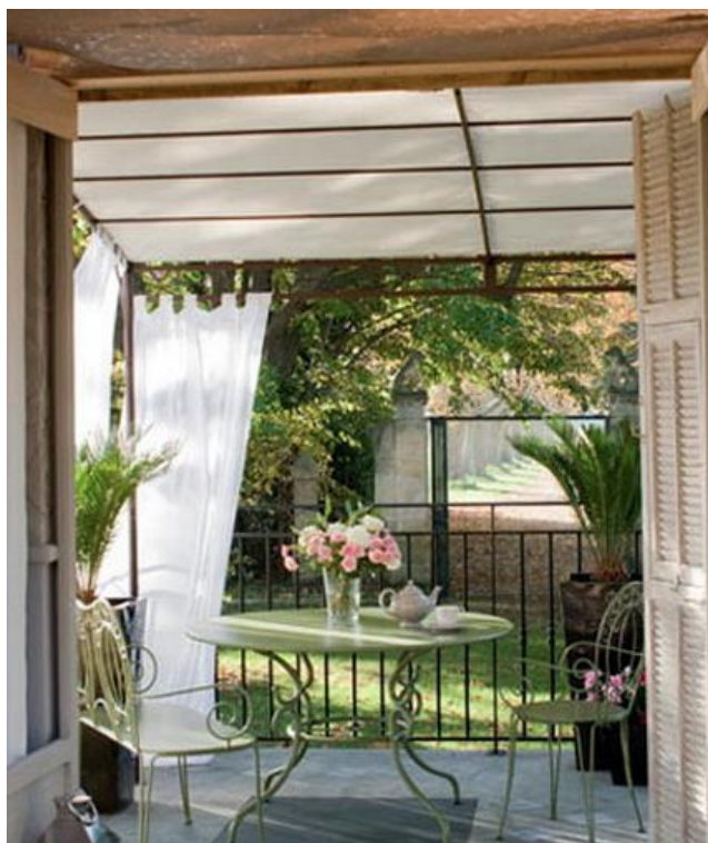
Εικόνα 3.7: Κιόσκι κατασκευασμένο από σίδηρο σε συνδυασμό με ύφασμα για την σκίαση του χώρου.

Από την άλλη μεριά σε έναν μικρότερο χώρο θα μπορούσαν να χρησιμοποιηθούν κατασκευές από μέταλλο όχι τόσο πομπώδεις όσο είναι οι ξύλινες με διάφορα υφάσματα για την σκίαση του χώρου όπως φαίνεται στην εικόνα 3.7.