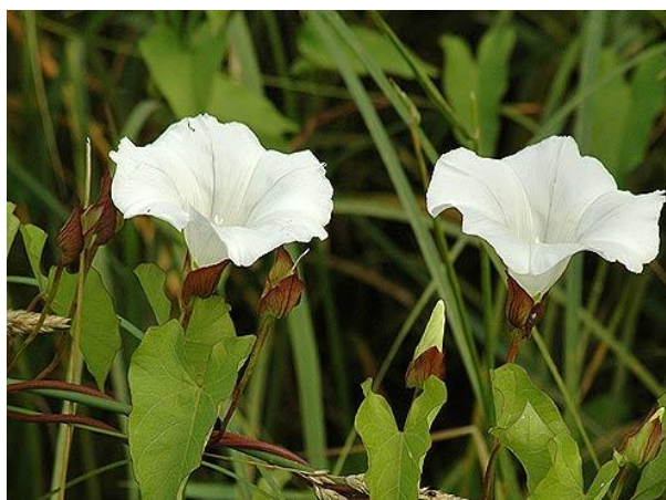
Εικόνα 2.36: Περικοκλάδα.

Είναι πολυετές αναρριχητικό φυτό με φύλλα μεγάλα βελοειδή-καρδιοειδή, λίγο κυματιστά. Τα άνθη είναι λευκά, μονήρη με κοντούς ποδίσκους και φύονται στις μασχάλες των φύλλων. Η περίοδος ανθοφορίας της είναι η εποχή του καλοκαιριού, από τέλη Μαΐου μέχρι μέσα Σεπτεμβρίου. Το φυτό φτάνει σε ύψος τα 3μ. Απαιτεί ηλιοφάνεια και προστασία από τους ισχυρούς ανέμους (εικόνα 2.36) (Κανταρτζής, 1999).