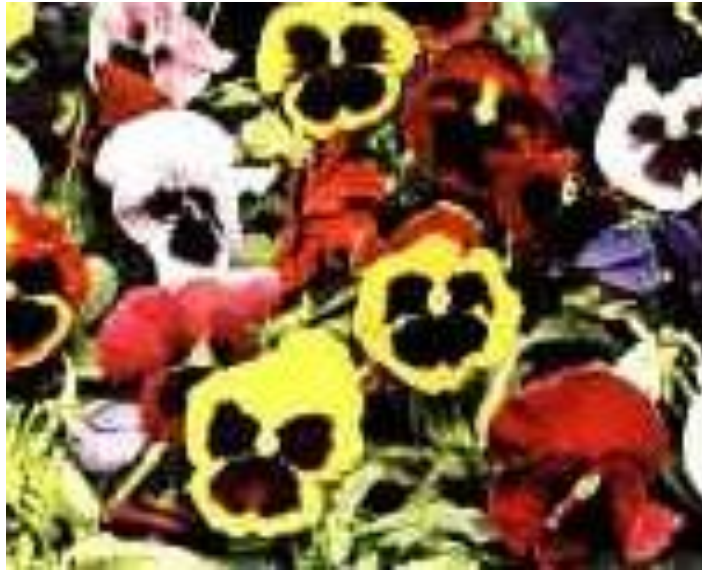
Εικόνα 2.15: Πανσέδες.

Οι μικροσκοπικοί πανσέδες μινιατούρες γνωστότεροι σαν βιόλες καλλιεργούνται όπως και οι υπόλοιποι πανσέδες και μπορούν να φυτευτούν επίσης και σε δοχεία.