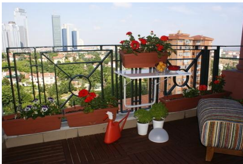
Εικόνα 3.2: Πτυσσόμενο τραπεζάκι για την εξοικονόμηση χώρου.

εναλλακτικές προτάσεις όπως για παράδειγμα τα πτυσσόμενα έπιπλα (εικόνα 3.3) ή καθίσματα τα οποία τους χειμερινούς μήνες μπορούν να μεταφερθούν σε κάποιον εσωτερικό χώρο.