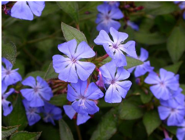
Εικόνα 2.31: Κερατόστιγμα.