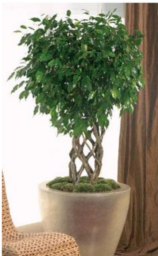
Εικόνα 2.17: Φίκος.

Ο φίκος ανήκει στην οικογένεια των μοριδών. Είναι τροπικό φυτό και κατάγεται από την Μαλαισία. Απαντούν σε διάφορες μορφές: δέντρα ή θάμνοι, αναρριχώμενα ή κρεμοκλαδή. Κοινό χαρακτηριστικό τους το μη δηλητηριώδες γάλα τους που περιέχει καουτσούκ (εικόνα 2.17).