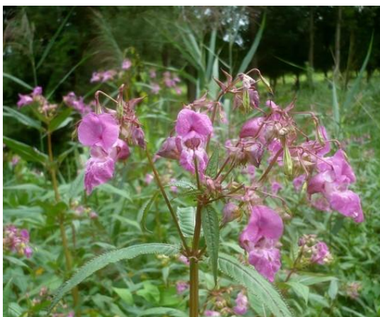
Εικόνα 2.26: Ανυπόμονα.