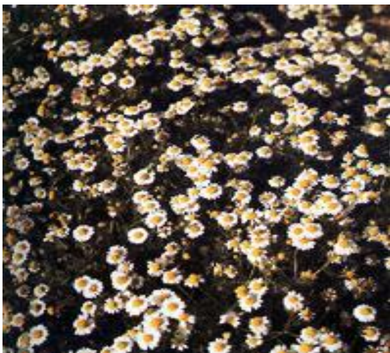
Εικόνα 2.7: Χαμομήλι.

Αυτοφύεται σε χέρσα και καλλιεργημένα μέρη σε όλη σχεδόν την Ελλάδα. Η άνθηση αρχίζει τον Απρίλιο και διαρκεί μέχρι και τον Ιούνιο. Οι θεραπευτικές του ιδιότητες είναι γνωστές από την αρχαιότητα και βέβαια ο Ιπποκράτης το θεωρούσε θαυματουργό για πολλές περιπτώσεις. Από το φυτό συλλέγονται τα άνθη, όταν ανοίξουν καλά. Το ρόφημα του εξαιρετικό καταπραϊντικό για το στομάχι και θαυμάσιο μαλακτικό, βοηθά στην αϋπνία, στον παροξυσμό άσθματος, στις νευραλγίες και στις ημικρανίες.