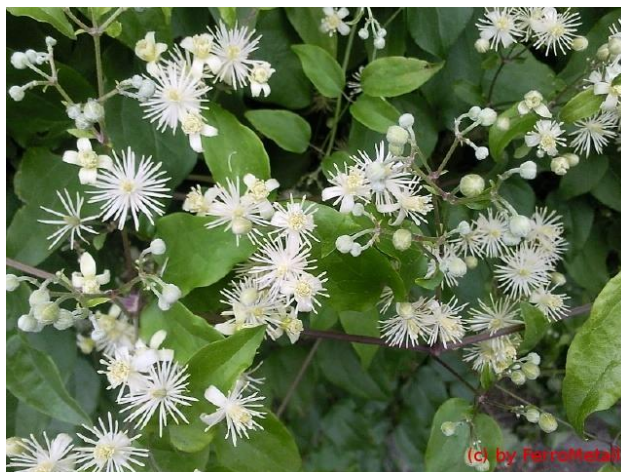
Εικόνα 2.37: Κληματίδα.