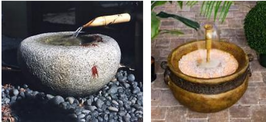
Εικόνα 1.5: Ενσωμάτωση του στοιχείου του νερού στη διακόσμηση μπαλκονιού με τη μορφή μικρών και σιντριβανιών και βρύσης (πηγή: http://www.texnotropieskaidiakosmisi.com/ ).

μετατρέποντας το μπαλκόνι σε έναν χαλαρωτικό και γαλήνιο χώρο (εικόνα 1.5) (Brookes, 1994b).