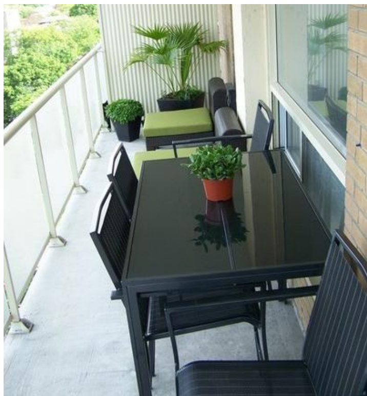
Εικόνα 4.4: Χρήση των επίπλων με τέτοιο τρόπο ώστε να διαιρείται ο χώρος σε δύο τμήματα, το καθιστικό και την τραπεζαρία. Η επιλογή των γραμμών στα έπιπλα και των χρωμάτων γενικότερα προσδίδει στο χώρο ένα μινιμαλιστικό ύφος.

Είναι φυσικό πως σε έναν μεγαλύτερο χώρο έχεις περισσότερες επιλογές και περισσότερες εναλλακτικές ώστε να τολμήσεις σε συνδυασμούς κυρίως υλικών αλλά και χρωμάτων. Σε αυτές τις περιπτώσεις δίνεται και η δυνατότητα να γίνει διαχωρισμός του μπαλκονιού σε καθιστικό και τραπεζαρία χρησιμοποιώντας ως διαχωριστικά φυτά ή και τα ίδια τα έπιπλα. Ένα τέτοιο παράδειγμα αποτελεί η εικόνα 4.4 στην οποία όμως επικρατεί η συμμετρία και η απλότητα στη γραμμή και το χρώμα κάτι που δίνει ένα αίσθημα ισορροπίας στο χώρο.