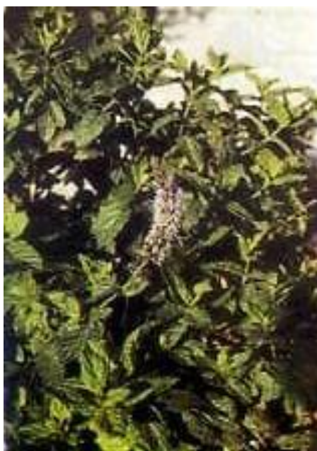
Εικόνα 2.2: Δυόσμος.

Φυτό με βλαστούς και φύλλα πράσινα. Τα φύλλα του είναι ωοειδή, ενώ τα άνθη του είναι μικρά χρώματος ρόδινα ή μωβ ανοιχτό (εικόνα 2.2).