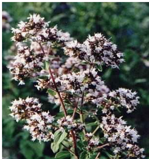
Εικόνα 2.4: Ρίγανη.

Θάμνος κοντός και φρυγανώδης με κορμό ξυλώδη χωρίς ελαστικότητα. Τα κλαδιά του είναι λεπτά και σχηματίζουν ανθοφόρα κεφάλια στις άκρες. Τα φύλλα έχουν σχήμα αυγοειδές, είναι χνουδωτά και σταχτόχρωμα (εικόνα 2.4).