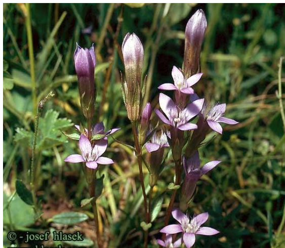
Εικόνα 2.28: Γεντιανή.

Η γεντιανή είναι ποώδες δικότυλο, πολυετές ή σπάνια διετές φυτό, με βλαστό ευθύ ο οποίος φθάνει μέχρι 1 μέτρο σε ύψος. Τα φύλλα του είναι αντίθετα και μυτερά. Τα άνθη έχουν διάφορα χρώματα, ενώ συνηθέστερα είναι τα κίτρινα ή μωβ-βιολετί και ανθίζει από τα τέλη Αυγούστου μέχρι τις αρχές Οκτωβρίου (εικόνα 2.28). Είναι ανθεκτικό φυτό και ευδοκιμεί σε ουδέτερα ή όξινα, ηλιαζόμενα ή ημισκιερά γόνιμα στραγγερά εδάφη. Είναι κατάλληλο φυτό για φύτευση σε ομάδες αμειγείς ή σε συνδυασμό με άλλα είδη (Κανταρτζής, 1991).