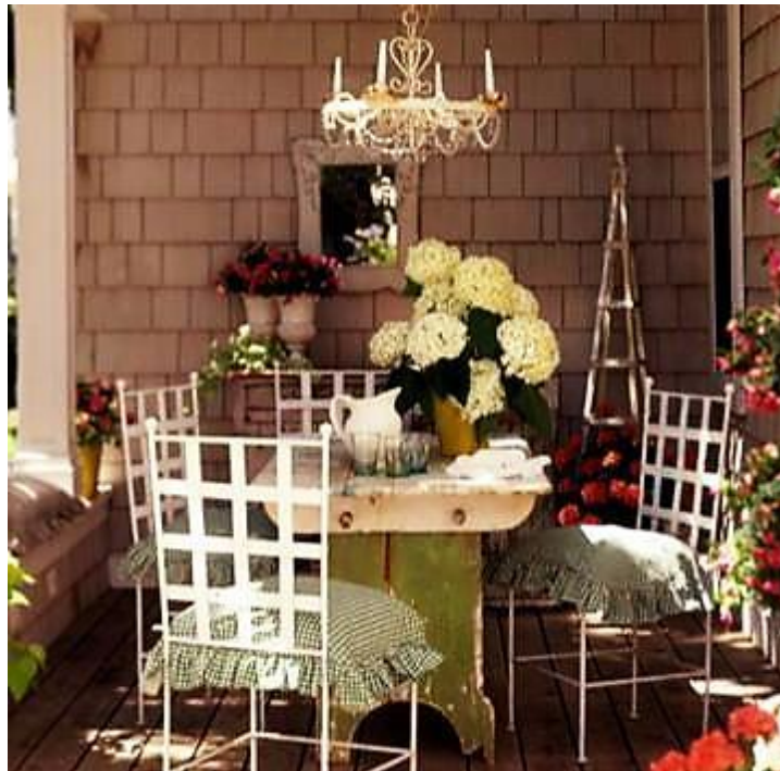
Εικόνα 4.11: Διακόσμηση βεράντας με ρομαντική διάθεση. Γίνεται συνδυασμός του μεταλλικού στοιχείου με το στοιχείο του ξύλου και χρησιμοποιούνται ανθόφυτα σε απαλούς αλλά και έντονους χρωματισμούς δίνοντας χρώμα στον χώρο.