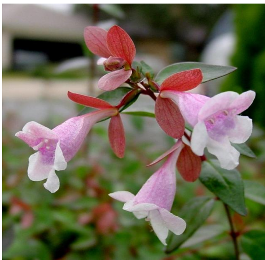
Εικόνα 2.23: Αμπέλια.

κοκκινίζουν με τα πρώτα κρύα απλά όχι τόσο έντονο κόκκινο όπως την άνοιξη (εικόνα 2.23).