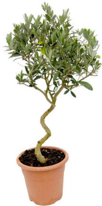
Εικόνα 2.33: Ελιά

.