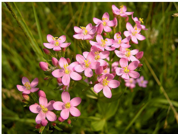
Εικόνα 2.30: Κενταύριο ή ερυθραία (πηγή:

μίσχου. Τα άνθη συσσωρεύονται πολλά μαζί σε συμπαγείς ταξιανθίες και ανθίζουν από Ιούνιο μέχρι Αύγουστο, ενώ οι μίσχοι είναι ραβδωτοί (εικόνα 2.30). Ευνοείται η ανάπτυξη του φυτού στις υγρές, σκιερές τοποθεσίες μακριά από την θάλασσα, στα κράσπεδα και στα λιβάδια (Κανταρτζής, 1991).