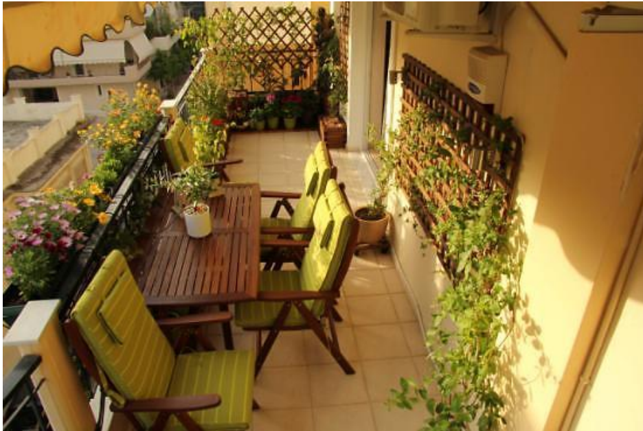
Εικόνα 4.7: Διακόσμηση μπαλκονιού με έμφαση στο φυτικό υλικό. Περιλαμβάνει ανθόφυτα, αναρριχητικά φυτά, αρωματικά φυτά και βότανα.