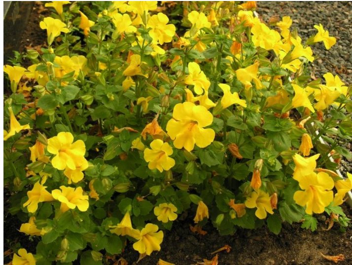
Εικόνα 2.39: Μίμουλους.