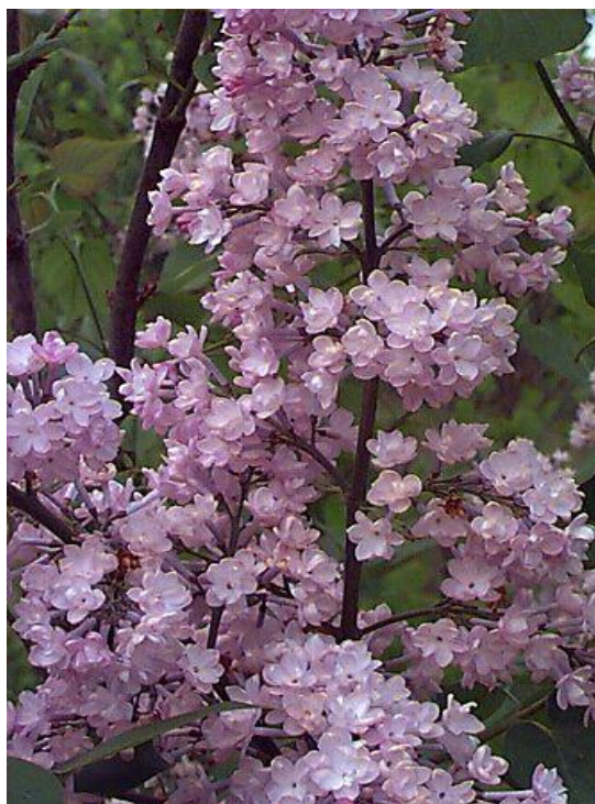
Εικόνα 2.21: Πασχαλιά.

Υπάρχουν εκατοντάδες ονομαστές ποικιλίες πασχαλιάς όπως επίσης και άλλα είδη του γένους Syringa για να διαλέξετε. Πολλές από αυτές είναι κατάλληλες για μπορντούρες με θάμνους (εικόνα 2.21).