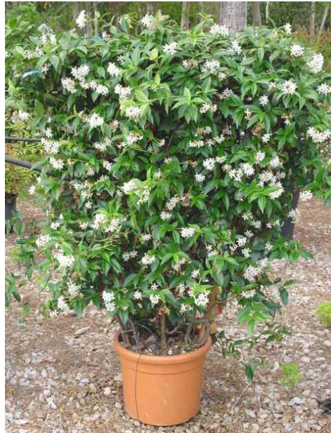
Εικόνα 2.38: Ρυγχόσπερμο (πηγή:

http://staff.aub.edu.lb/~weblhort/Plants/Climbers_Vines/Plants/Rhynchospermum_jasminoides.htm ).