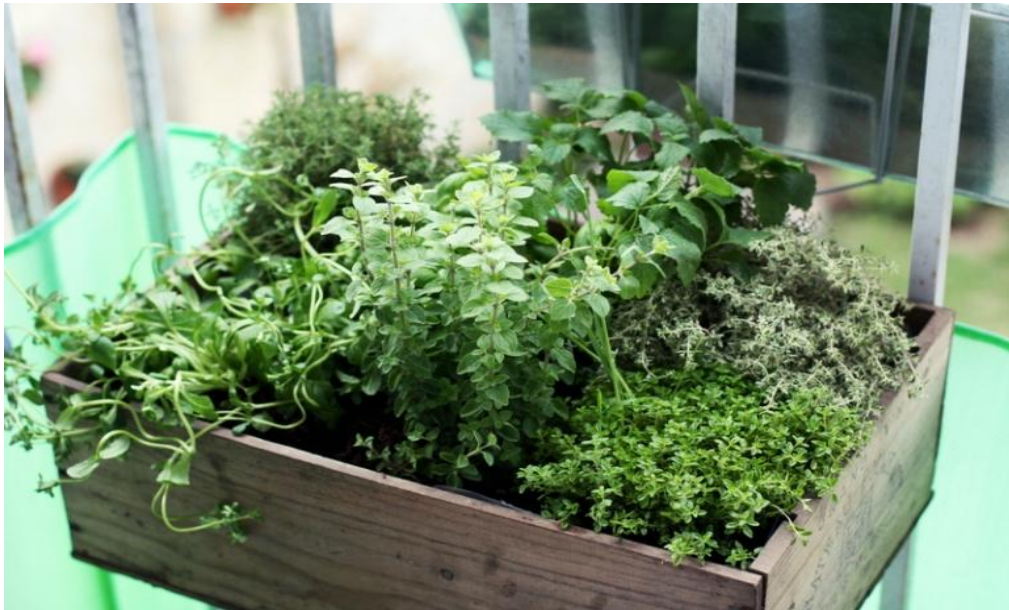
Εικόνα 1.2: Φύτευση αρωματικών βοτάνων σε γλάστρα στο μπαλκόνι.