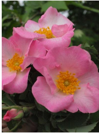
Εικόνα 2.24: Άγρια τριανταφυλλιά (πηγή:

http://aerapatera.files.wordpress.com/2013/05/5100246.jpg ).