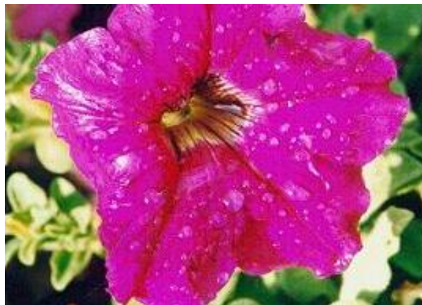
Εικόνα 2.16: Πανσέδες.

Ετήσιο ανθόφυτο με χαρακτηριστικά και πολύχρωμα άνθη. Φυτεύονται την άνοιξη είναι ικανές να ανθίζουν καθ' όλη τη διάρκεια του καλοκαιριού μέχρι τα πρώτα κρύα του φθινοπώρου, αλλά χρειάζονται τακτικό κλάδεμα και λίπανση για να διατηρούνται φρέσκιες. Σε περιοχές χωρίς μεγάλες παγωνιές οι πετούνιες μπορούν να φυτευτούν και το φθινόπωρο (εικόνα 2.16) (Κανταρτζής, 1991).