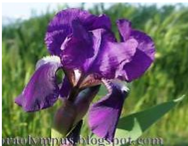
Εικόνα 2.12: Ίριδα (πηγή: http://www.gardenguide.gr/ ).

Πολυετές φυτό με ισχυρό βλαστό που μπορεί να ξεπεράσει το 1μ (εικόνα 2.18). Τα φύλλα του είναι μεγάλα, σπαθοειδή και λίγο κοντύτερα από τον βλαστό (εικόνα 2.12).