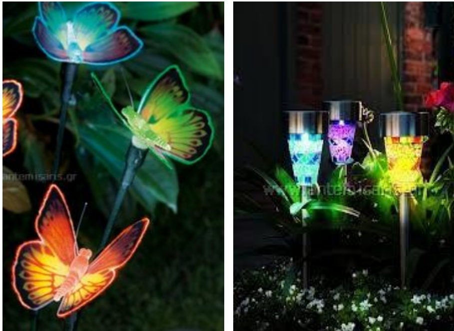
Εικόνα 3.9: Ηλιακά φωτιστικά σε διάφορα χρώματα και σχέδια ειδικά για την διακόσμηση των φυτοδοχείων σε μπαλκόνια και βεράντες (πηγή: http://www.antemisaris.gr/product.aspx?iid=14824 ).