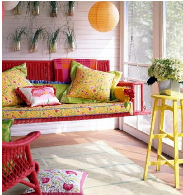
Εικόνα 4.8: Διακόσμηση βεράντας με έμφαση στο παιχνίδισμα των χρωμάτων των επίπλων και των διακοσμητικών στοιχείων. Τα έπιπλα είναι κατασκευασμένα από ξύλο και μπαμπού ενώ έχουν επιλεγθεί γνάλινα βάζα και μεταλλικές φυτοδοχεία για την διατήρηση και ανάπτυξη των φυτών αντίστοιχα. Ο καναπές είναι τύπου κούνιας ενισχύοντας την παιχνιδιάρικη και ρομαντική διάθεση του ιδιοκτήτη.