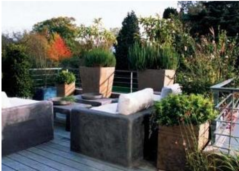
Εικόνα 4.12: Μοντέρνο ύφος με έπιπλα σε απλές γραμμές και πέτρινο χρώμα. Έχει δοθεί ιδιαίτερη έμφαση στο φυτικό υλικό το οποίο έχει περιοριστεί σε αρωματικά φυτά. Το ύφος αυτό αν και μοντέρνο προσδίδει στο χώρο μια αίσθηση αυστηρότητας αλλά και ισορροπίας καθώς όλα τα υλικά τελικά εναρμονίζονται μεταξύ τους.