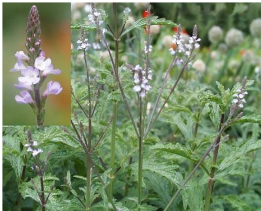
Εικόνα 2.27: Βέρβενα η φαρμακευτική

βάση. Τα άνθη είναι πολύ μικρά, ιώδη σε μακρουλό και λεπτό στάχυ, τα οποία ανθίζουν Ιούνιο με Σεπτέμβριο. Προτιμά πλούσια, ελαφρά, ηλιαζόμενα, τακτικά αρδευόμενα και καλά αποστραγγιζόμενα εδάφη (εικόνα 2.27).