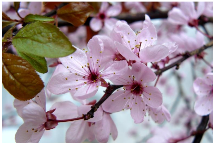
Εικόνα 2.32: Δαμασκηλιά

.