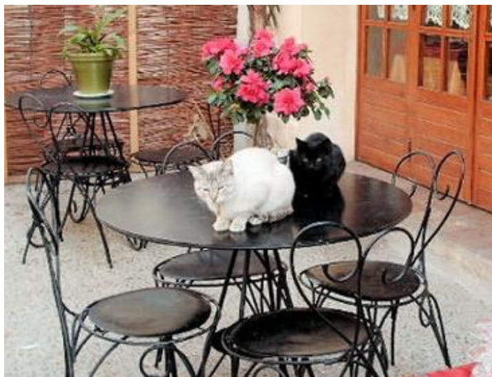
Εικόνα 3.1: Στρογγυλό μεταλλικό τραπέζι σε μαύρο χρώμα με καρέκλες με καμπύλες.