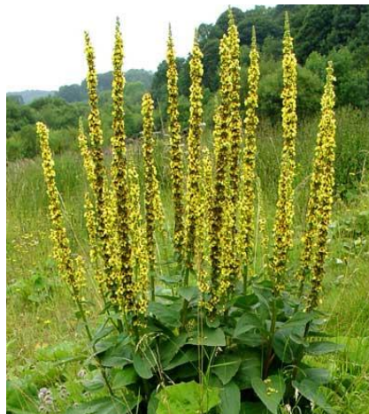
Εικόνα 2.25: Αγριμόνιο

Το αγριμόνιο είναι πολυετές, ποώδες φυτό. Τα φύλλα του είναι αντίθετα, μεγάλα, οδοντωτά, λίγο χνουδωτά και διατεταγμένα σε ρόδακα. Τα άνθη του είναι μικρά, χρυσοκίτρινα και διατεταγμένα σε επιμήκη βότρυ. Φυτρώνει σε υγρές τοποθεσίες, σε δάση, σε ορεινά χωριά και σε δασικούς δρόμους, ενώ φαίνεται να αναπτύσσεται καλά σε όλα τα εδάφη (Κανταρτζής, 1991).