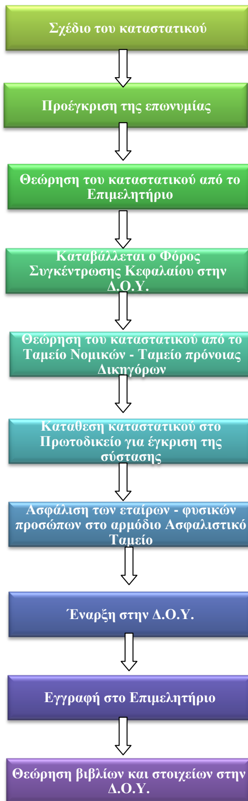
Σχήμα 2.2 Διαδικασία σύστασης Ετερόρρυθμης Εταιρίας